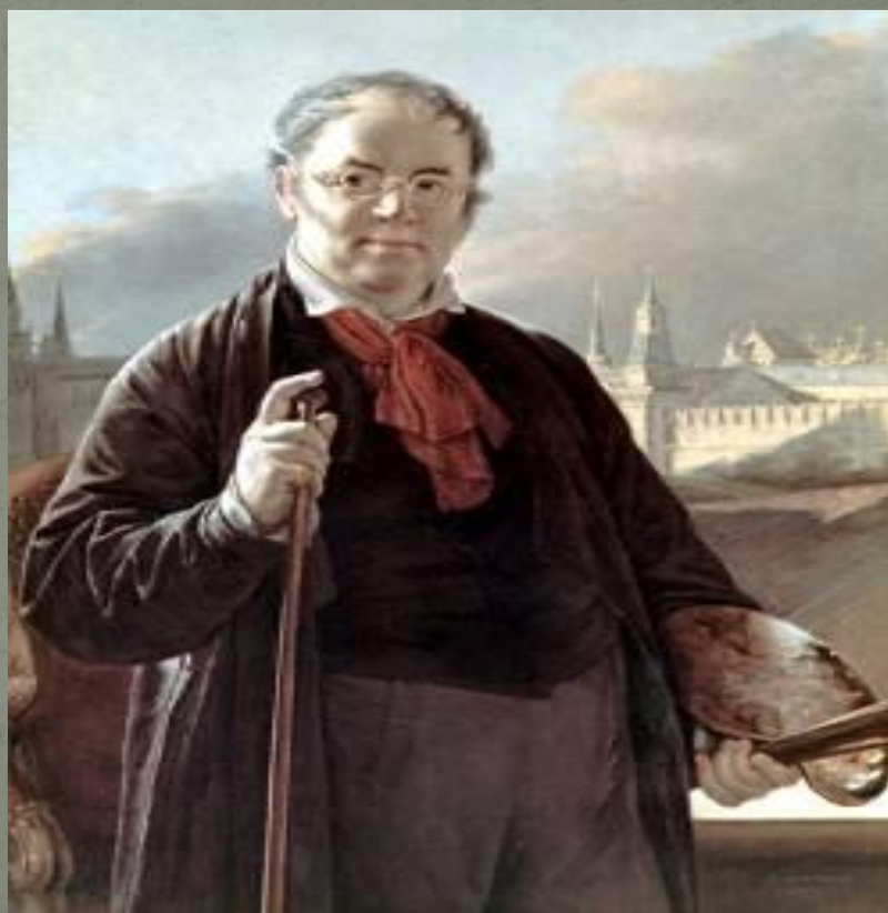
В. Тропинин. Автопортрет