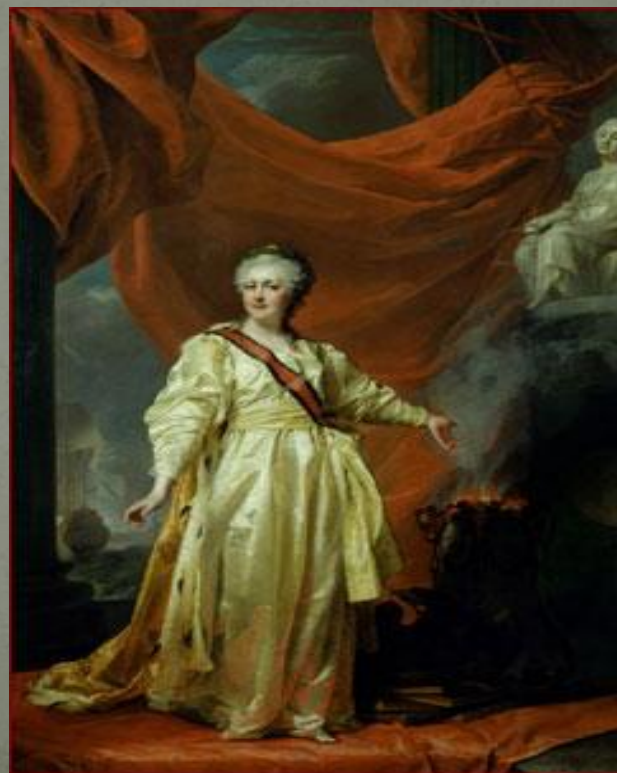
Дмитрий Левицкий Портрет Екатерины II