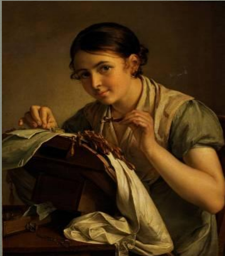
В. Тропинин. Кружевница