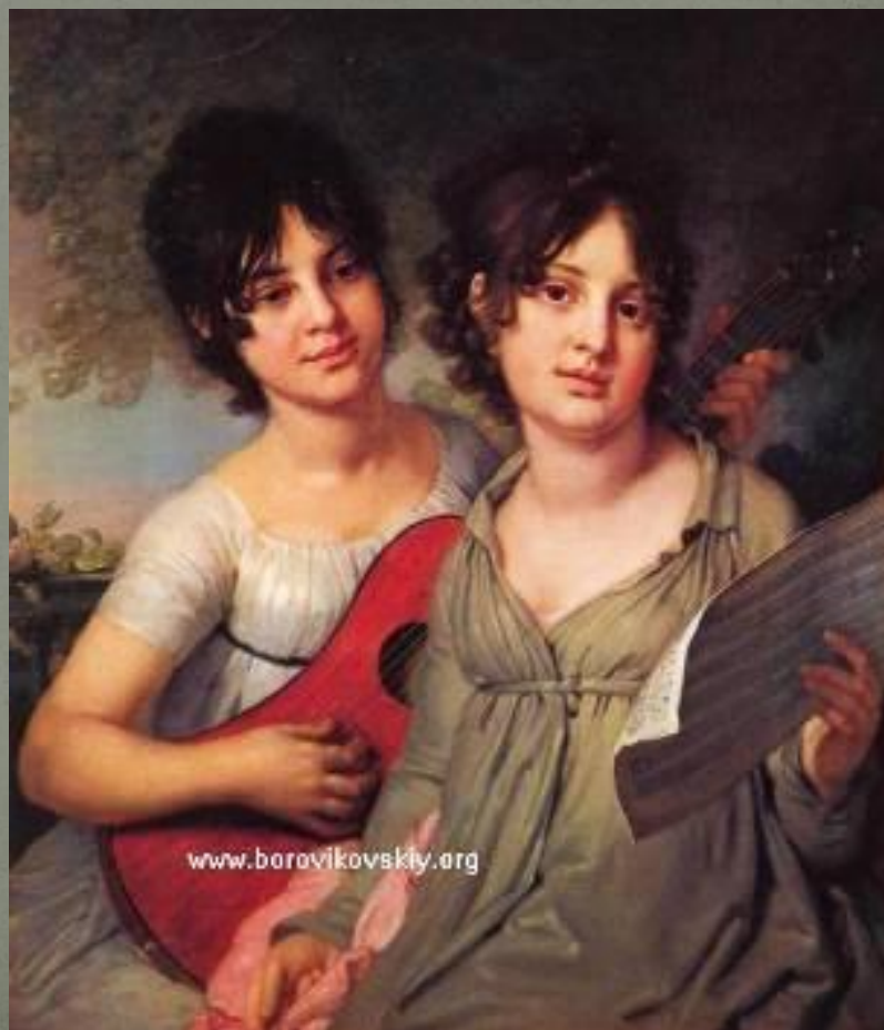
В. Боровиковский. Портрет сестёр Гагариных.