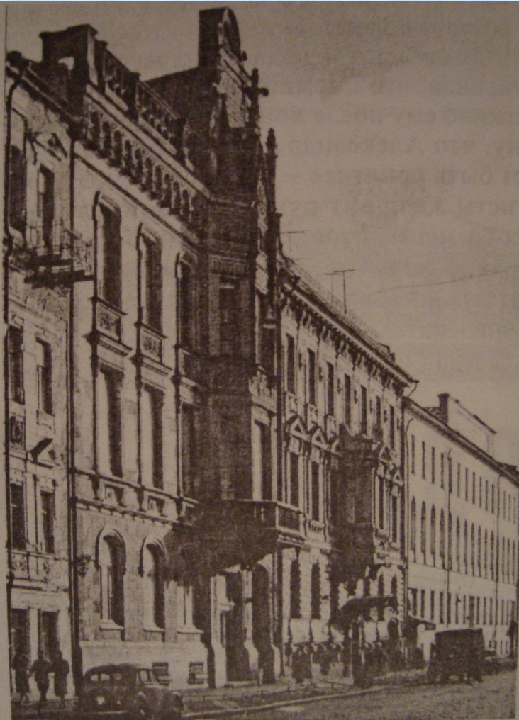
Ленинградский театральный институт им. А.Островского, ул. Моховая. Открыт в 1922 г., преобразован в 1961 году в ЛГИТМиК