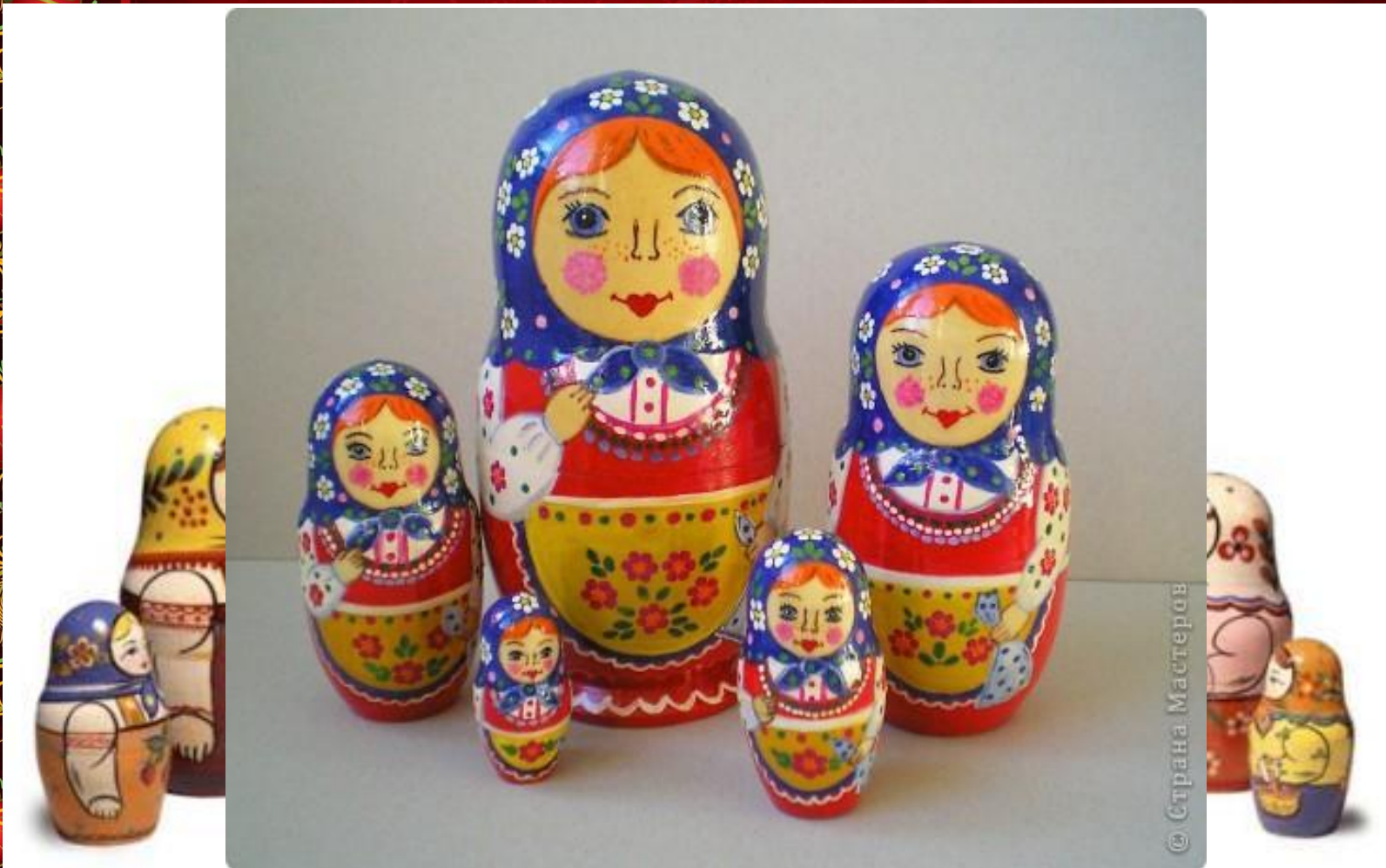
Загорская матрешка, г. Сергиев Посад (Московская область)

Эта игрушка и сейчас похожа на первую матрешку с петухом в руках. Загорская матрешка добротна, крутобока, устойчива по форме. Расписывают ее по белому дереву гуашевыми красками. В росписи обычно используют три - четыре цвета - красный или оранжевый, жёлтый, зелёный и синий. Чёрный – обводка лица и контуров одежды.