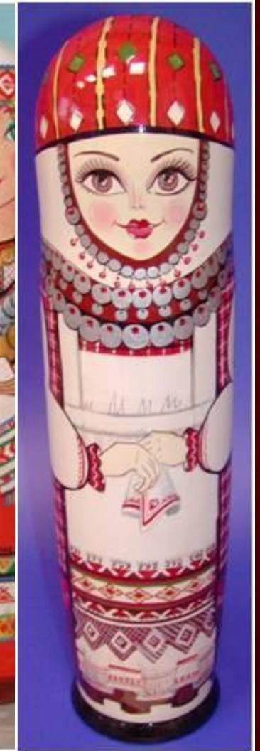
Матрешки разных национальностей