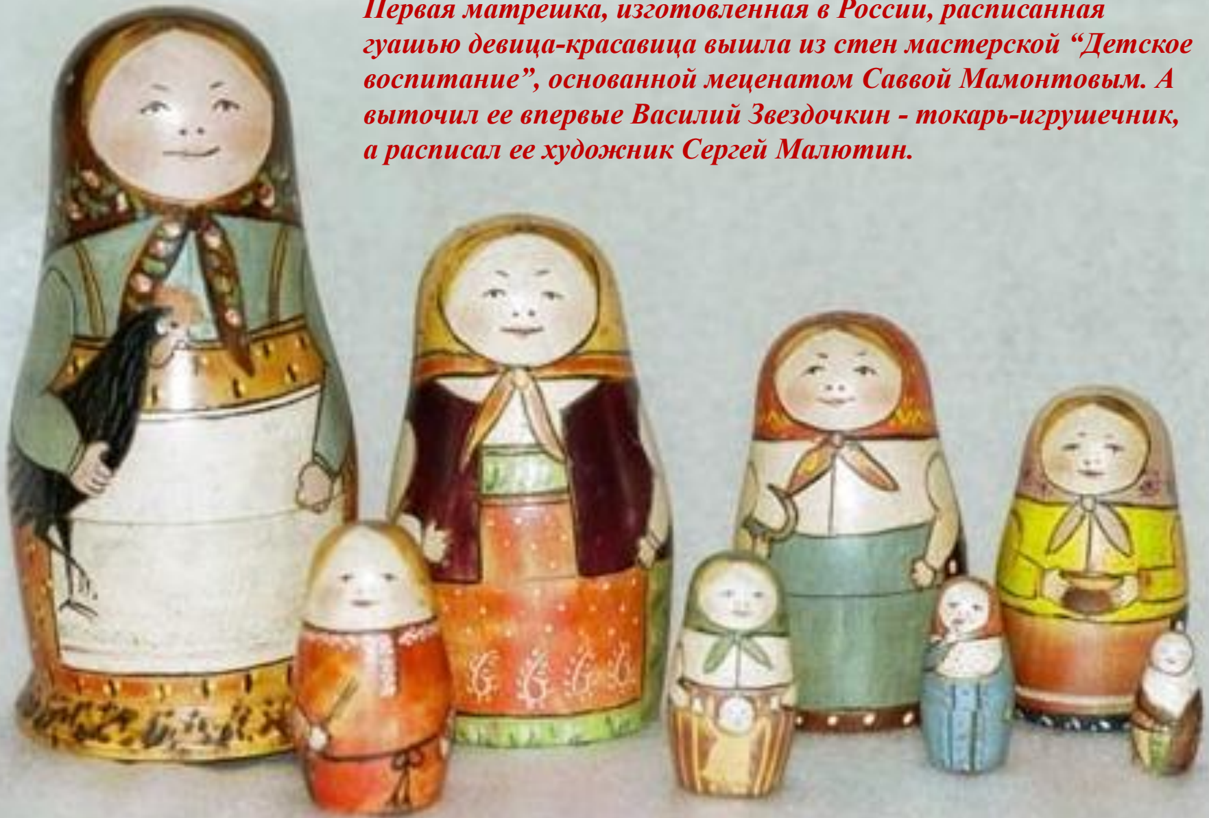
Первая русская матрешка