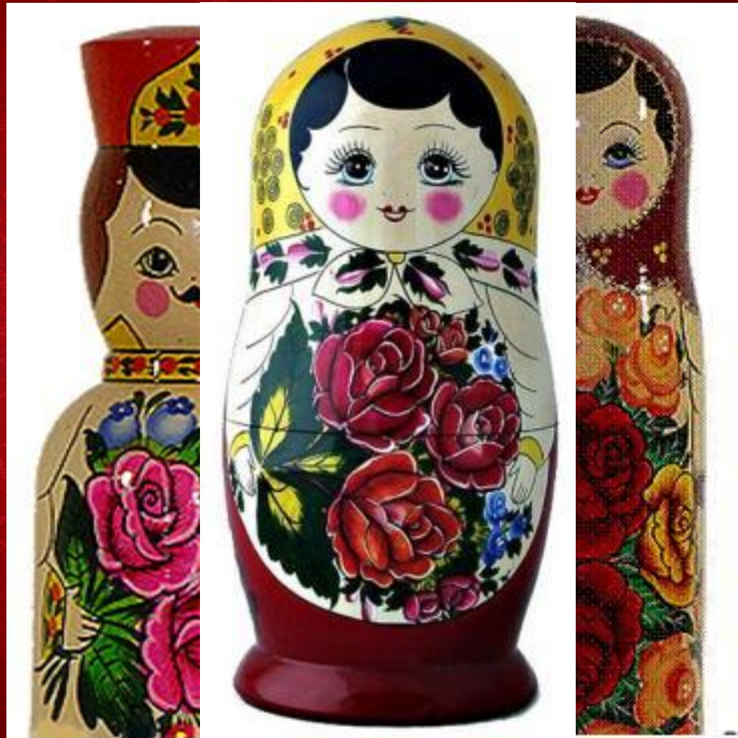
Семёновская матрешка (Нижегородская область)

Мастера в 1922 году заимствовали эту игрушку из Загорска, но украшать её стали по – своему. Большой букет цветов занимает весь фартук. В основном используют три цвета — красный, синий и желтый. Роспись выполняют анилиновыми прозрачными красками.