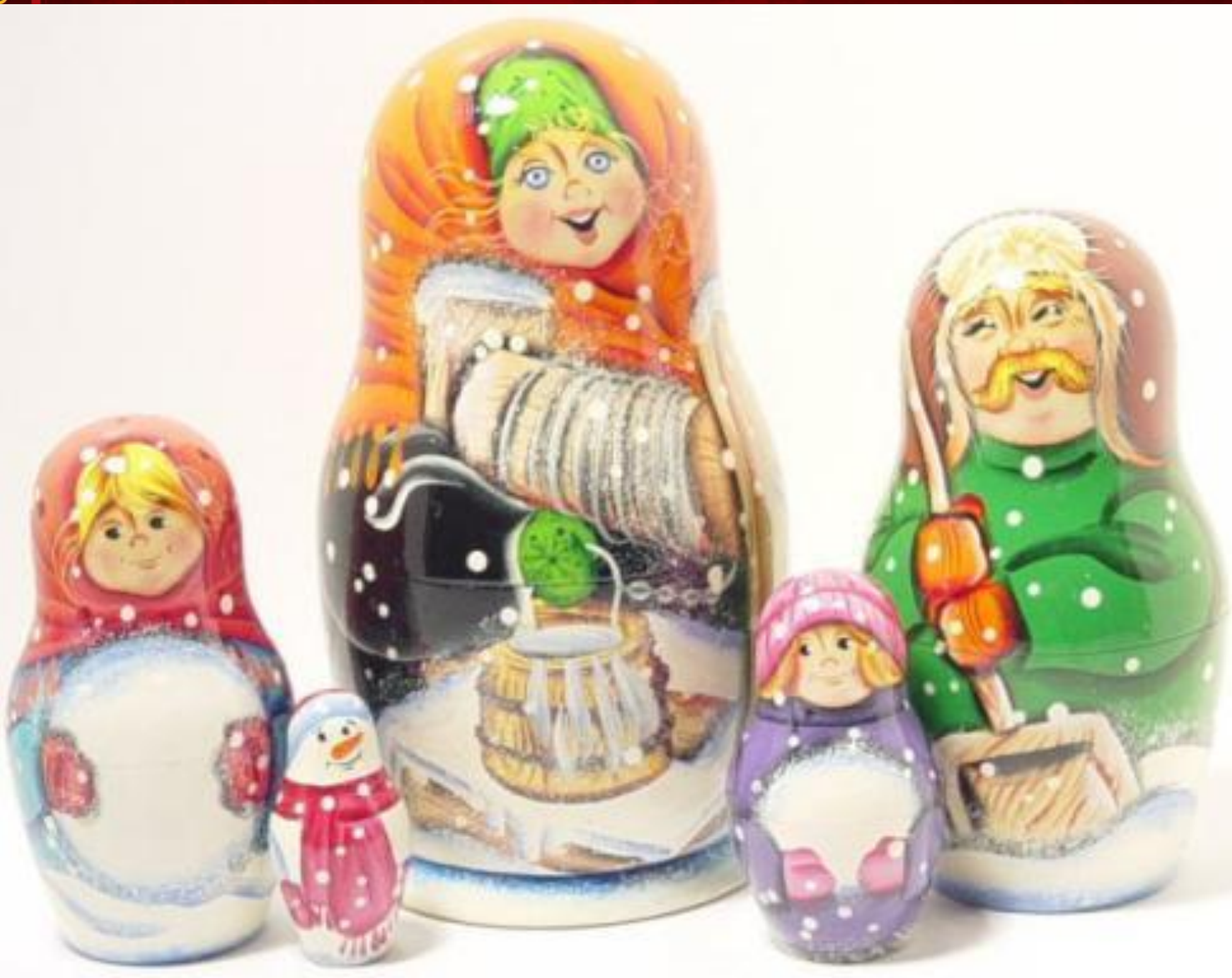
Матрешки с сюжетом

Матрёшки, украшенные живописными сюжетами из сказок и былин, «рассказывают» целые истории.