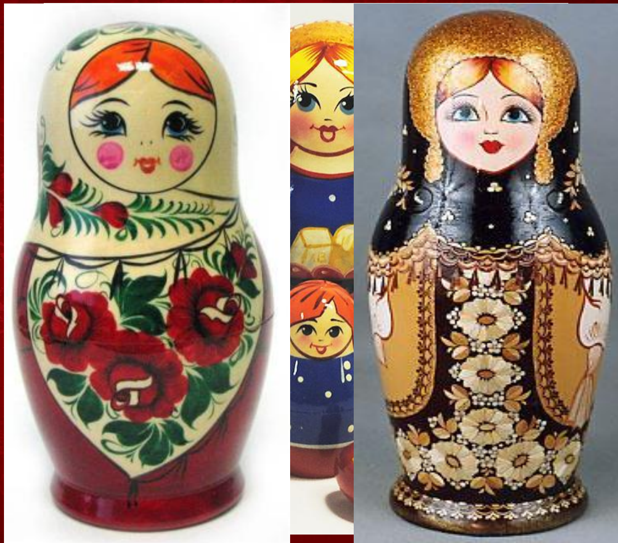
Вятская матрешка ( Кировская область )

Наиболее северная из всех российских матрешек. Матрешку не только расписывают анилиновыми красками, но и инкрустируют соломкой и покрывают лаком.