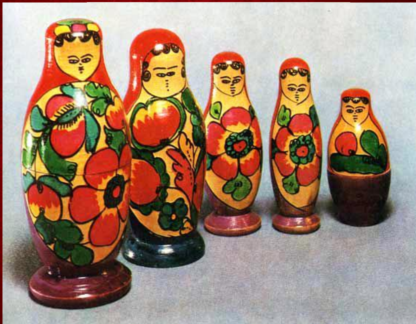
Полхов-Майданская матрешка (Нижегородская область)

Отличается вытянутыми пропорциями, голова небольшая, уплощенная. Овал лица с кудряшками волос, платок ниспадает с головы, на голове трилистник розана, овал, заменяющий передник, заполнен цветочной росписью.