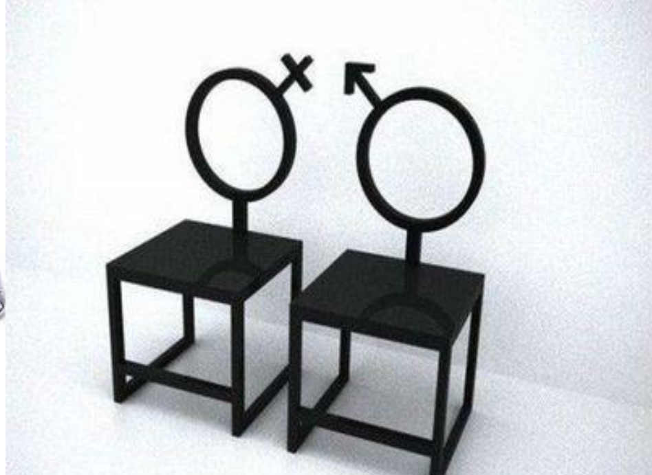
Стул «Коробк а»