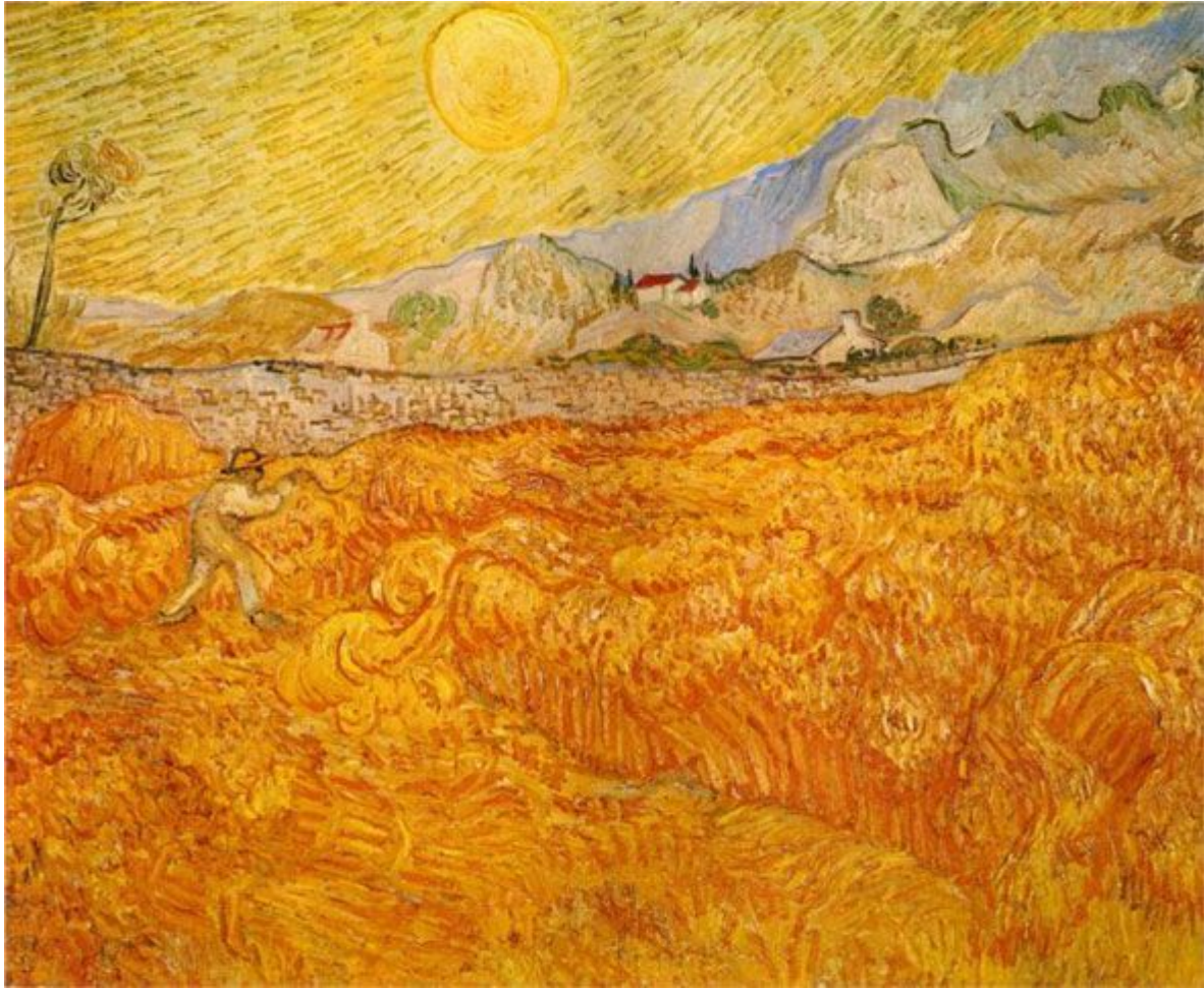
В. Ван Гог