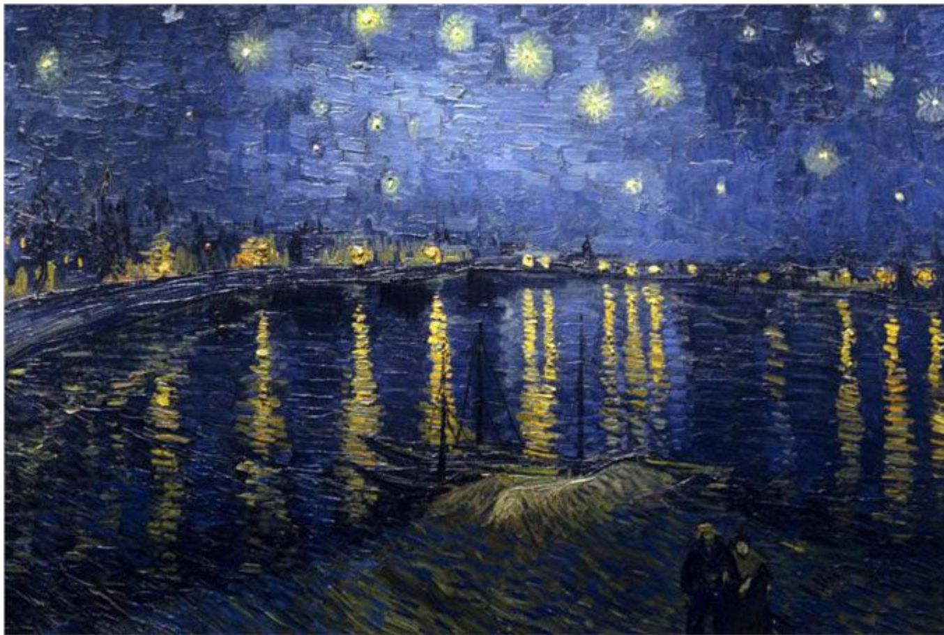
В Ван Гог