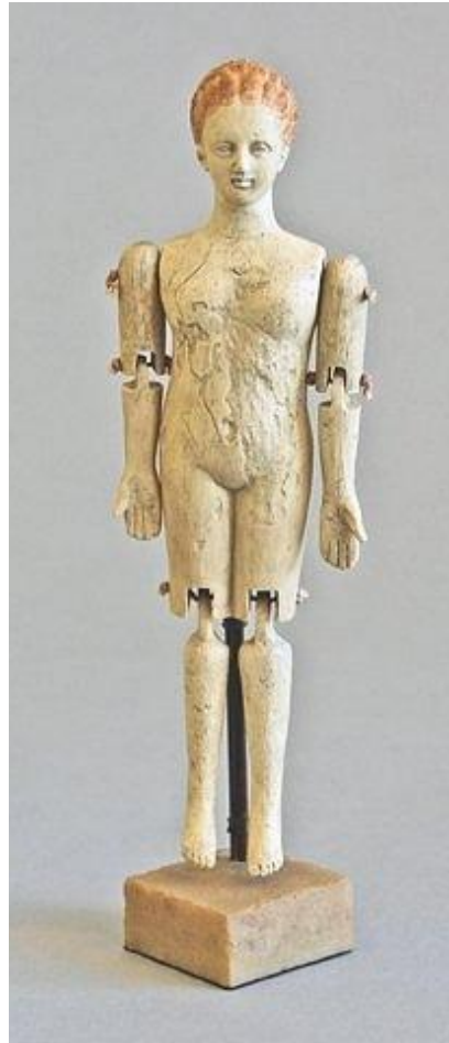
Древнегреческая кукла из терракоты