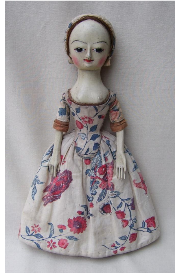
Фарфоровая кукла из Германии. 18 век