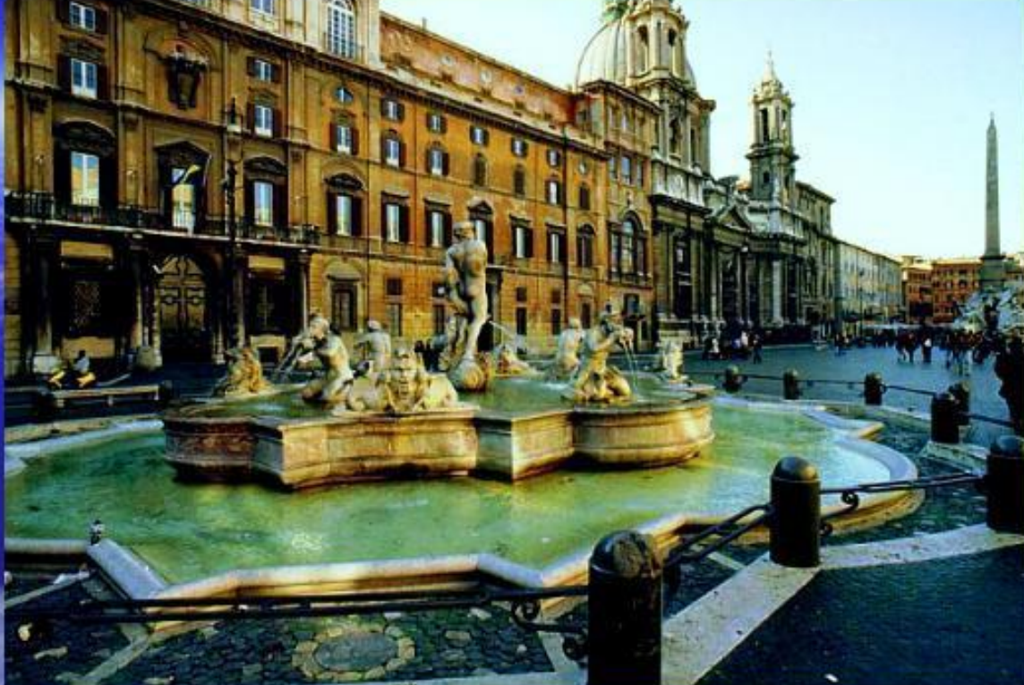
Лоренцо Бернини. Рим. Фонтан Нептуна на площади Навона.