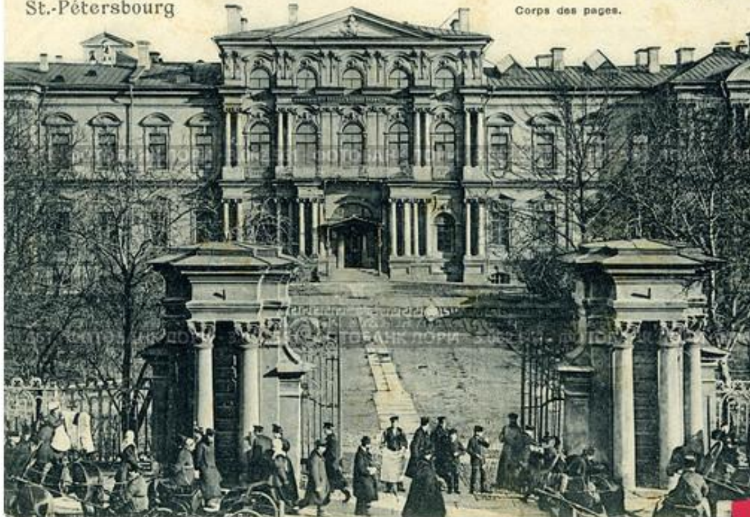
Пажескій Е. И. В. корпусъ. Corps des pages.