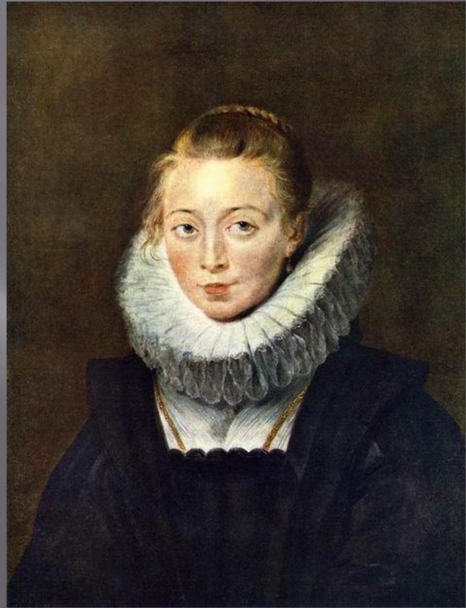
Питер Пауль Рубенс. Инфанта Изабелла, правительница Нидерландов 1625