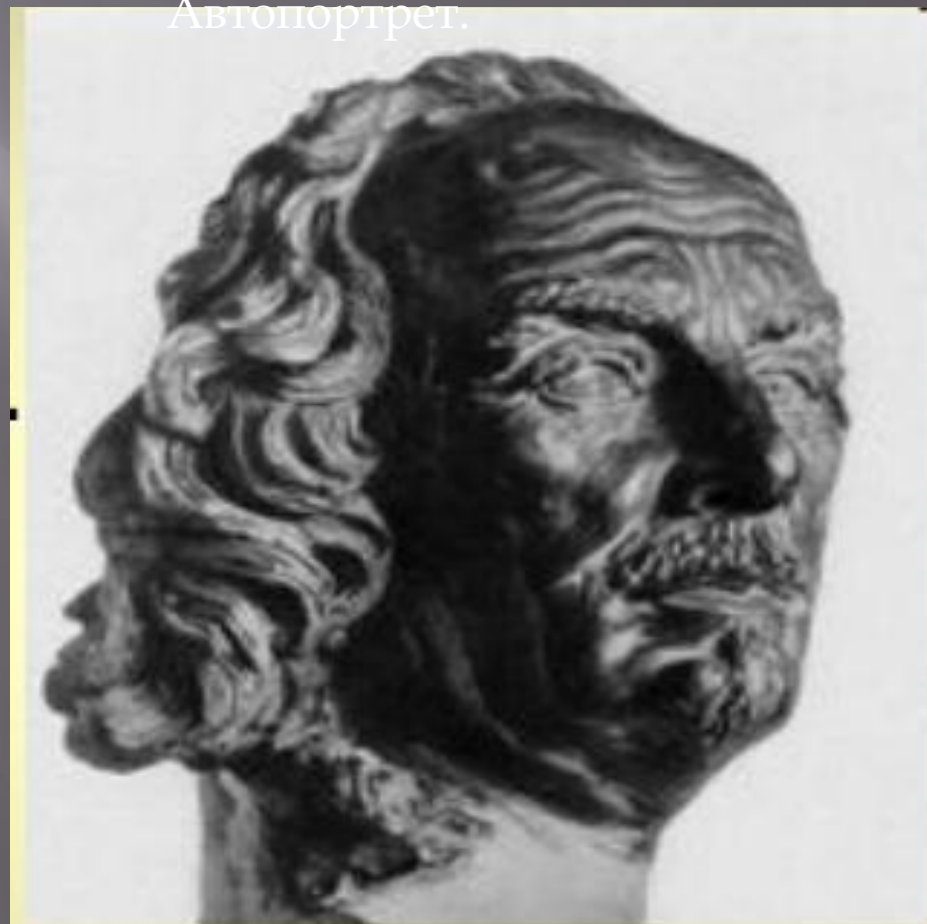
Лоренцо Бернини. Автопортрет.