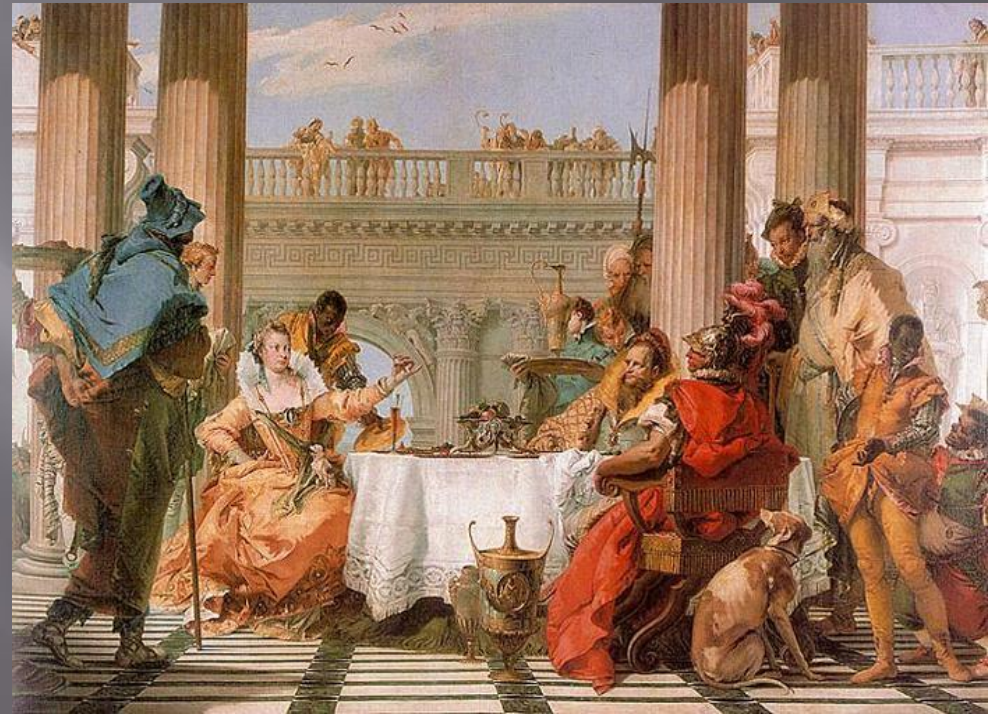
Джованни Батиста «Пир Клеопатры»