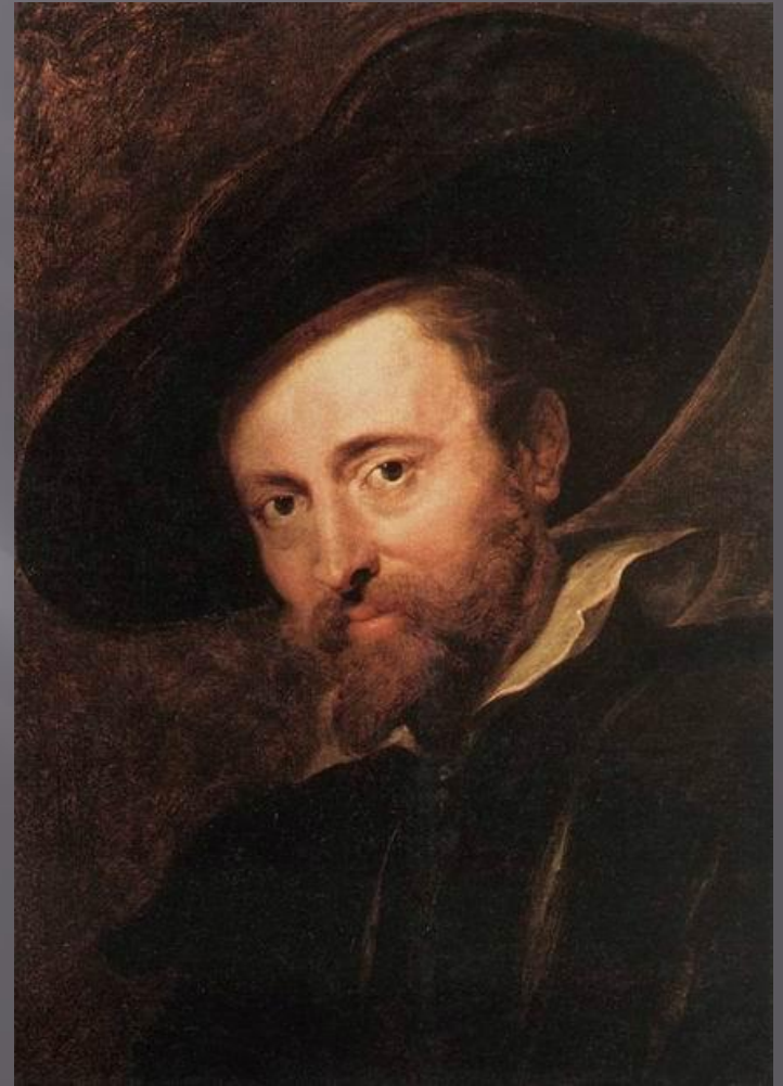
Питер Пауль Рубенс. Автопортрет, 1628-1630

"История искусства не знает ни единого примера такого универсального таланта, такого мощного влияния, такого непреерекаемого, абсолютного авторитета, такого творческого триумфа", - писал о Рубенсе один из его биографов.