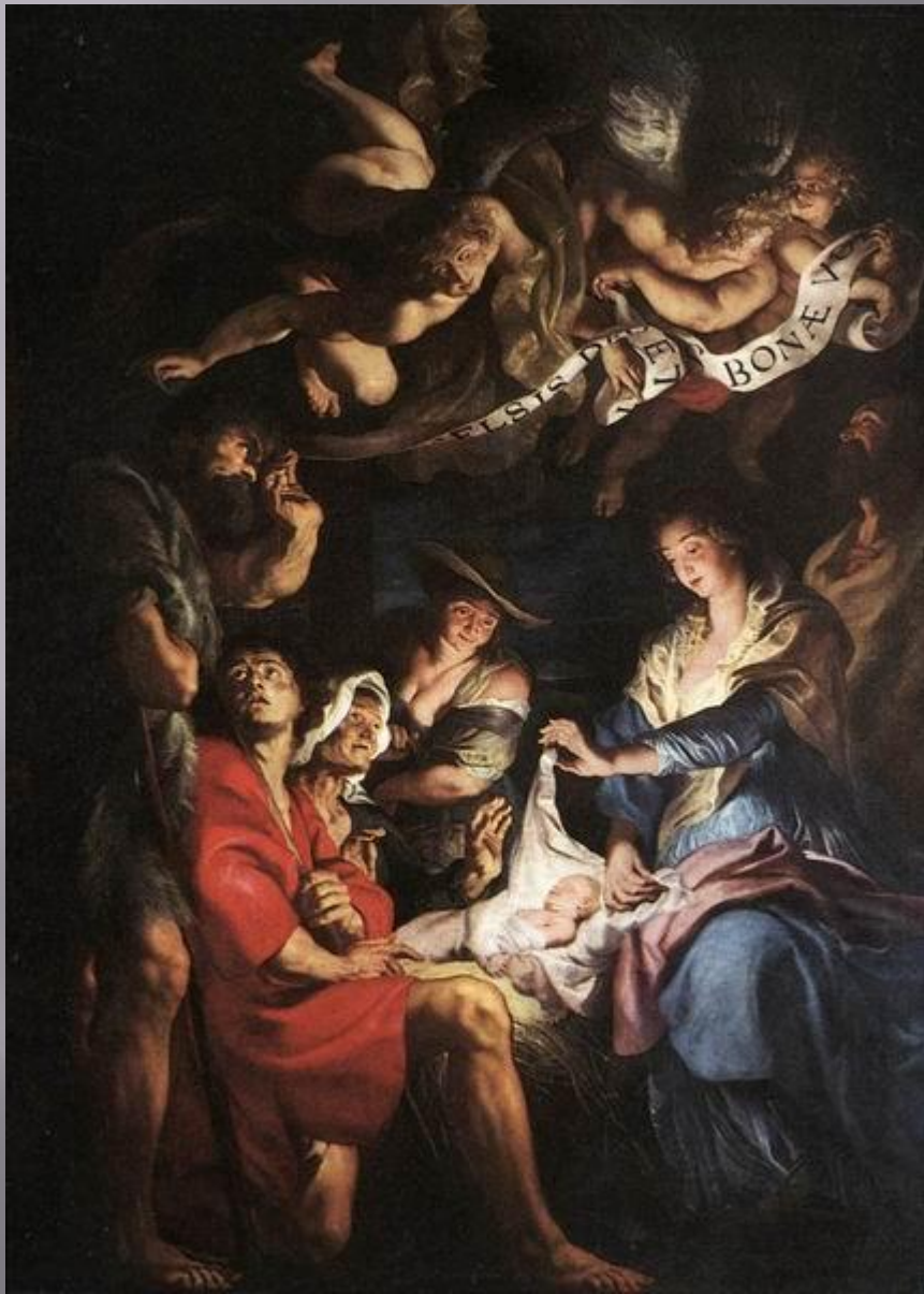
Питер Пауль Рубенс. Поклонение волхов (пастухов), 1608