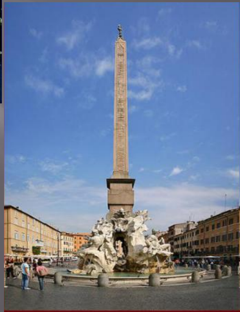
Фонтан Четырех рек.