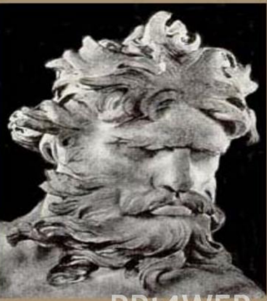
Лоренцо Бернини. Нептун (1620)