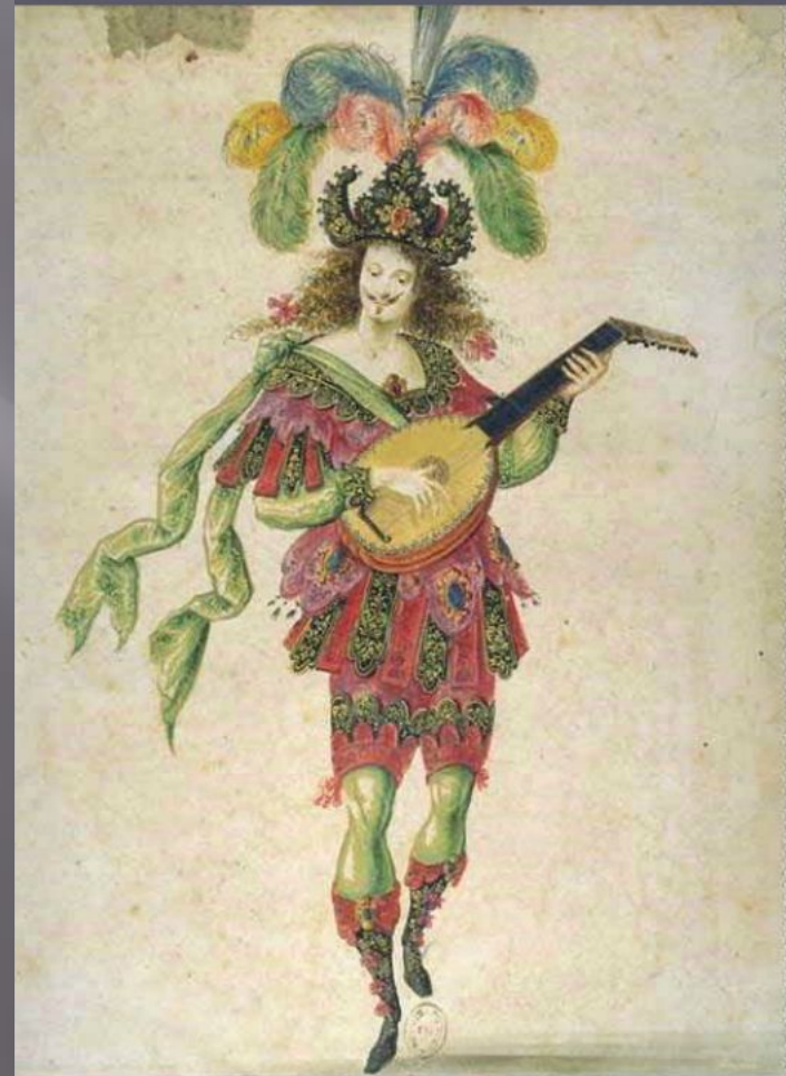
Эскиз костюма лютниста.