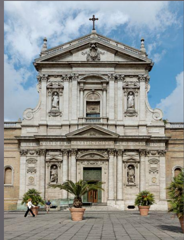
Творение Карла Модерна – Фасад римской церкви Санта- Сусанна.