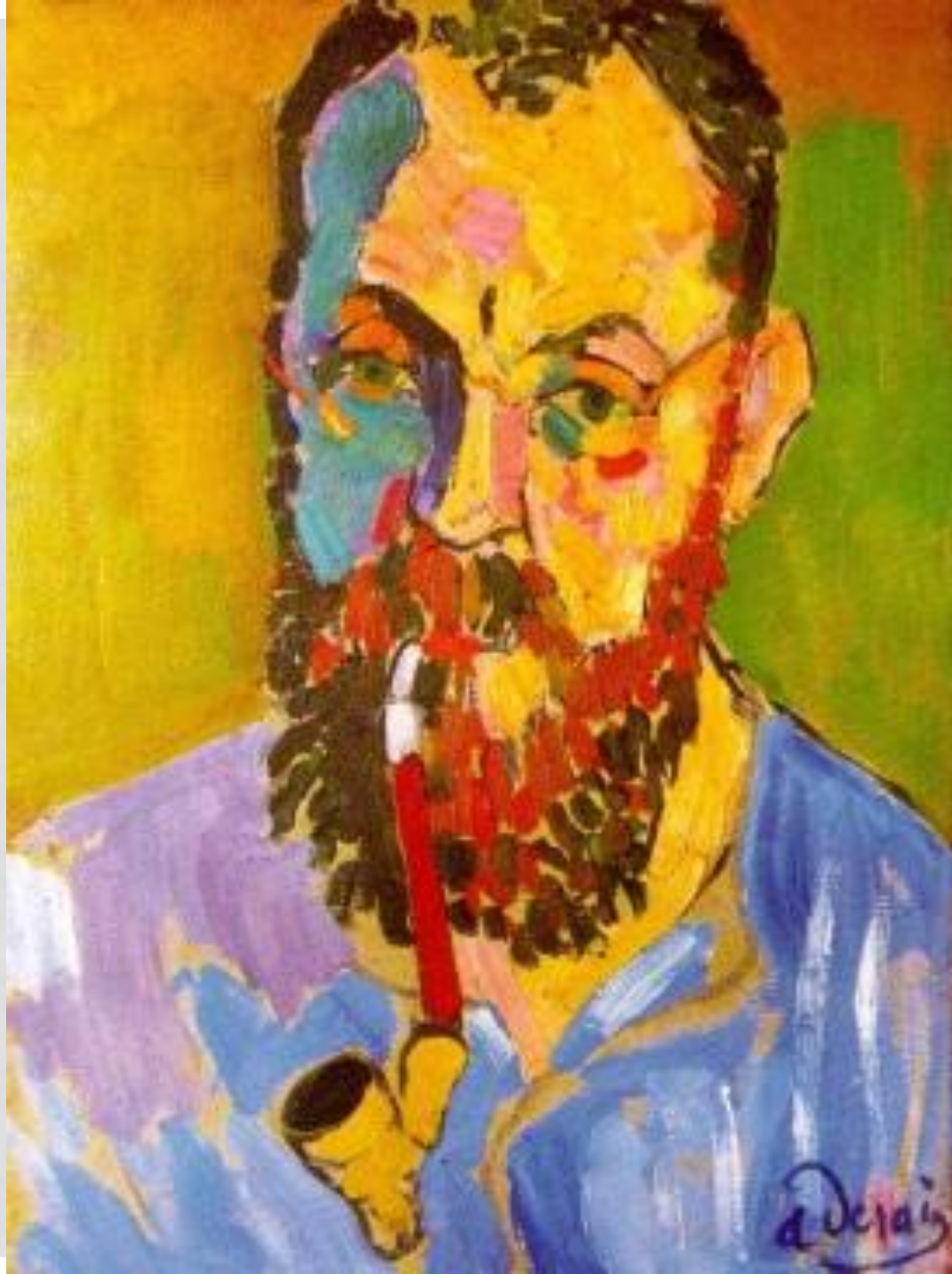
А. Дерен. Портрет художника Анри Матисса.