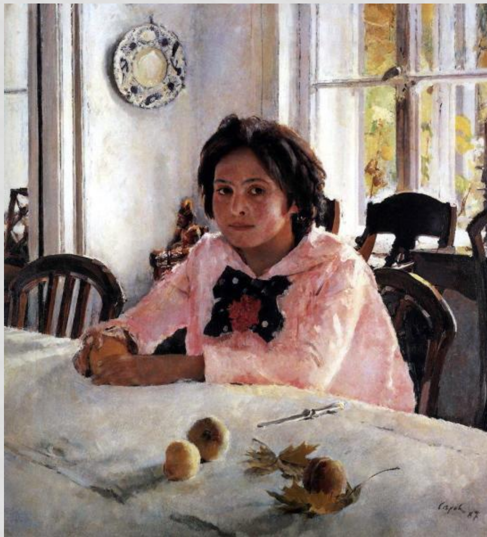
Серов В.А. Девочка с персиками.

Портрет Верочки Мамонтовой поразил сразу многих современников свежестью светлого, сияющего колорита, тонкой передачей света и воздуха. Трепетный, мерцающий голубовато – серый фон картины, пронизанный теплым отражением из окна, розовое пятно платья и создают то впечатление свежести, чистоты и юной радости жизни, которое составляет самую сущность произведения.