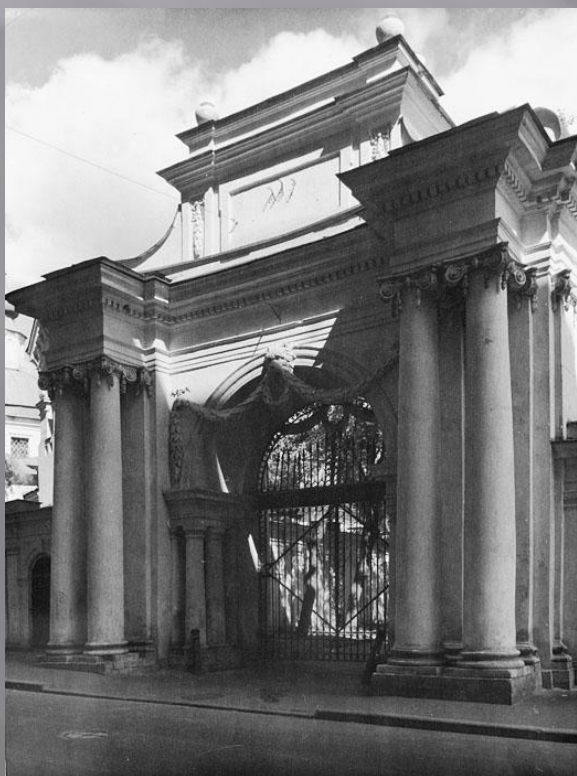
Въездные ворота Дома Пашкова