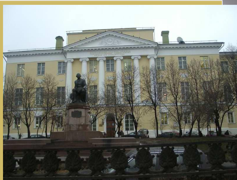
Университет на Моховой (новое здание)

Пусть разрываются, Купю Жизнь любовнику наших сер А я влюблять люблю вам всем, Пробуду и век верна, Когда в сердце Буду я твоим, Всегда одна.