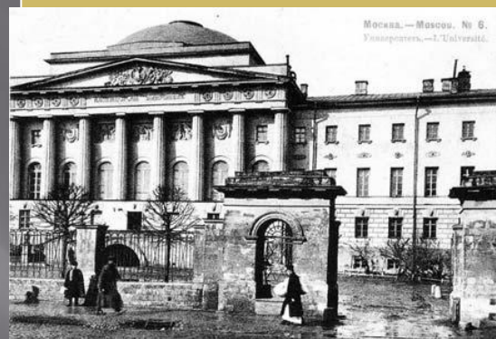
Старое здание Московского Университета на Моховой