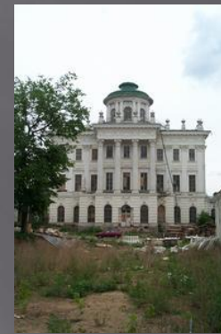
Вид со двора