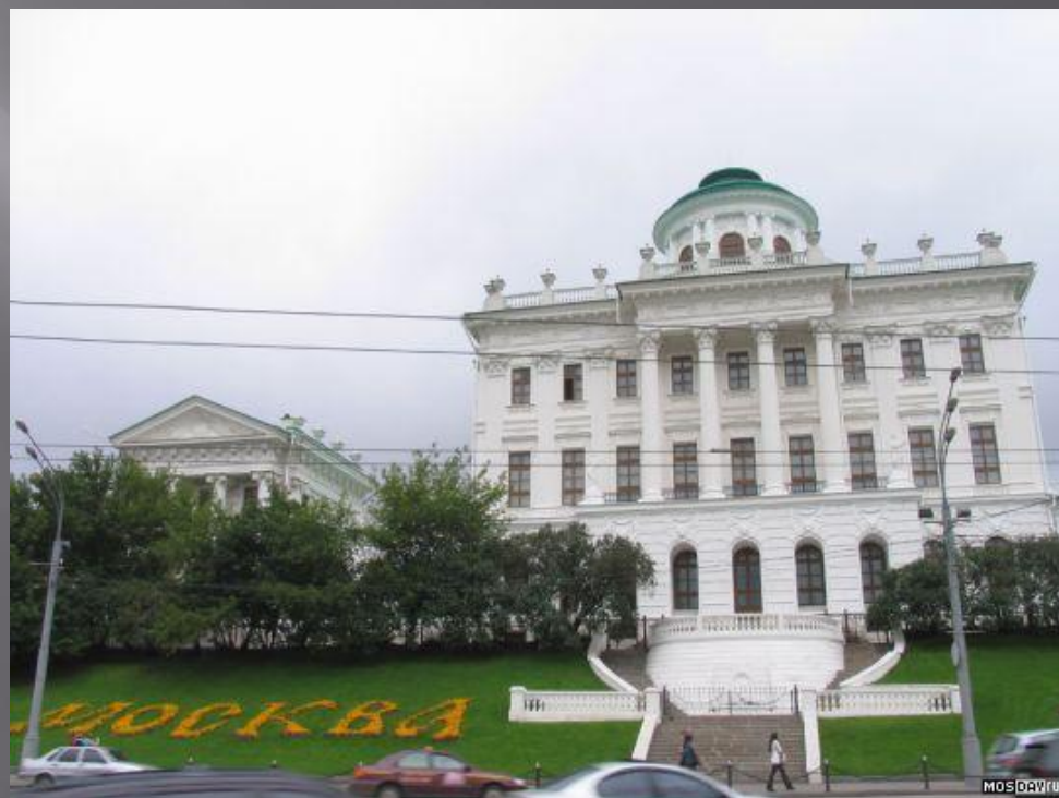
2007 года, улица Знаменка, дом 6. обновленный Пашков дом