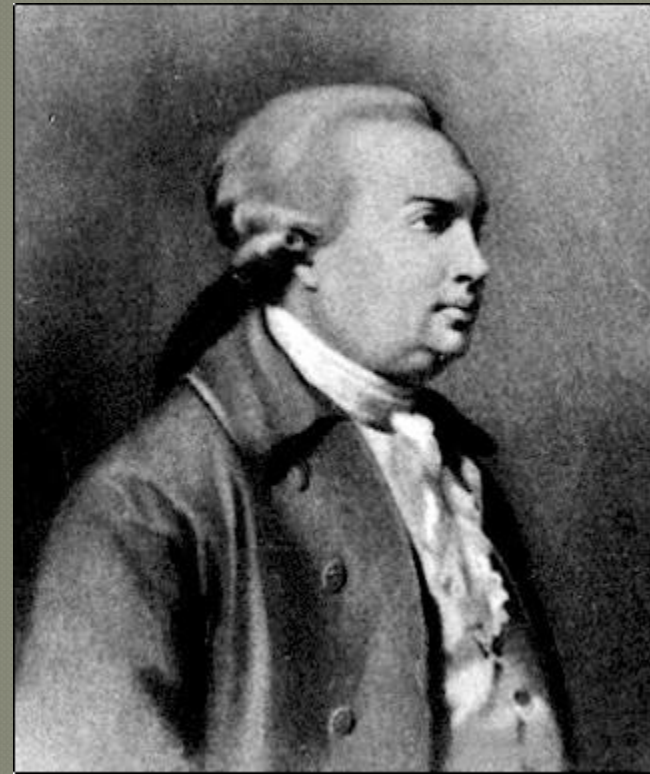
Неизвестный художник 18 века