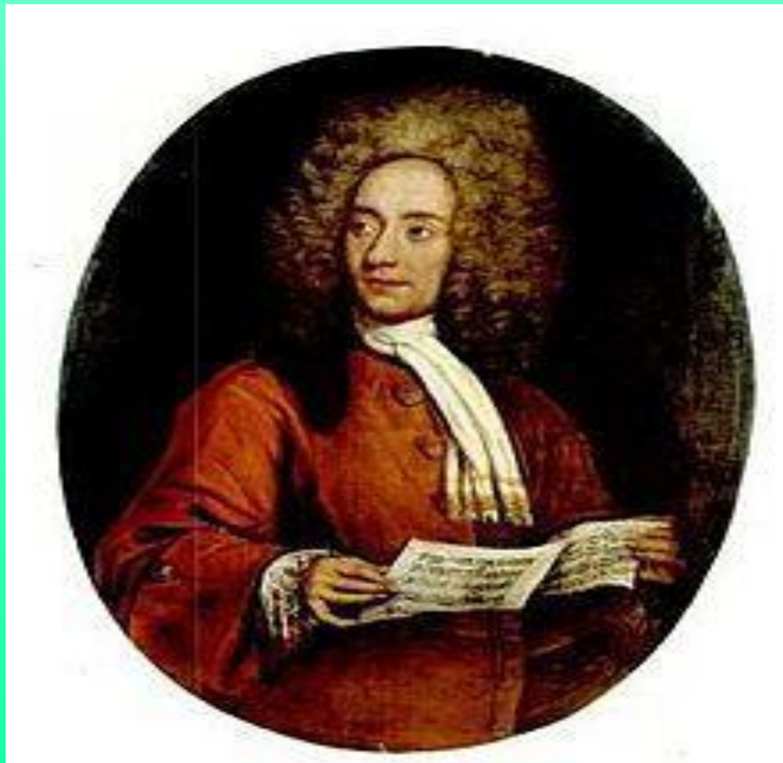
Композитор 18 века