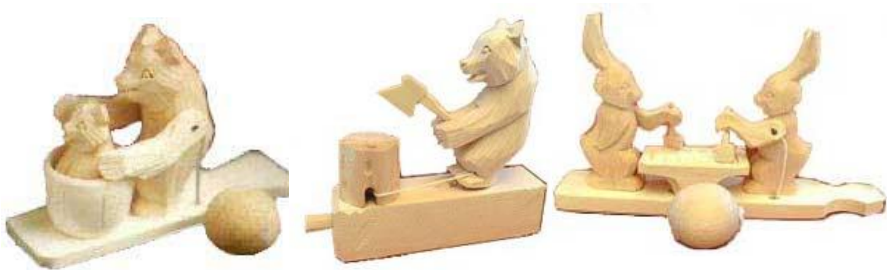
Богородская деревянная игрушка