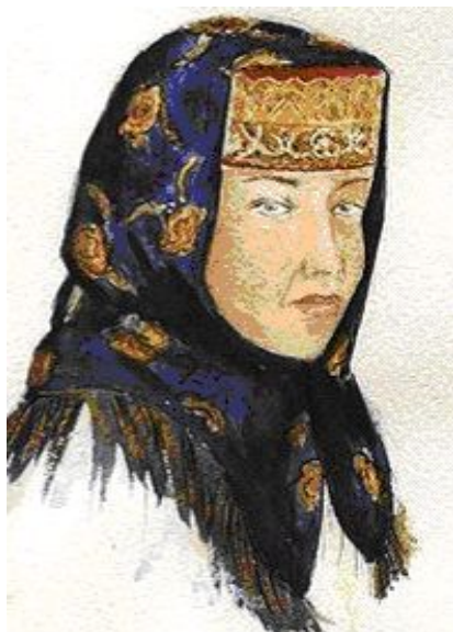
ПОВЯЗКА С ПЛАТКОМ