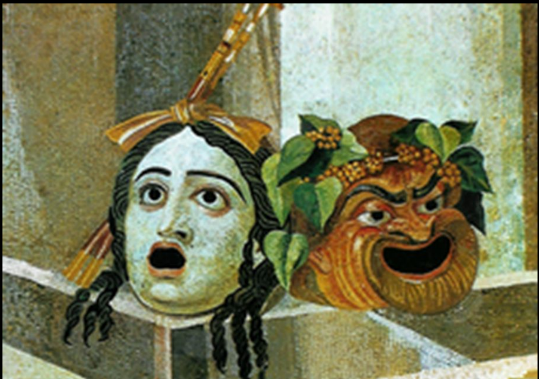
Античные маски трагедии и комедии. Римская мозаика. II век.