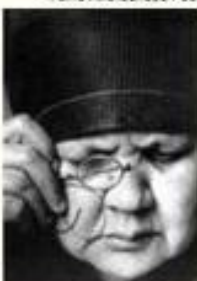
Фото Александра Родченко