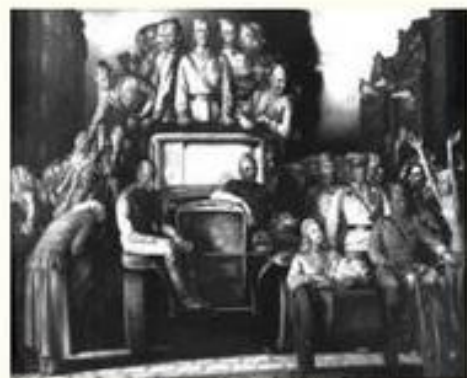
Художник Николай Ерлыкин