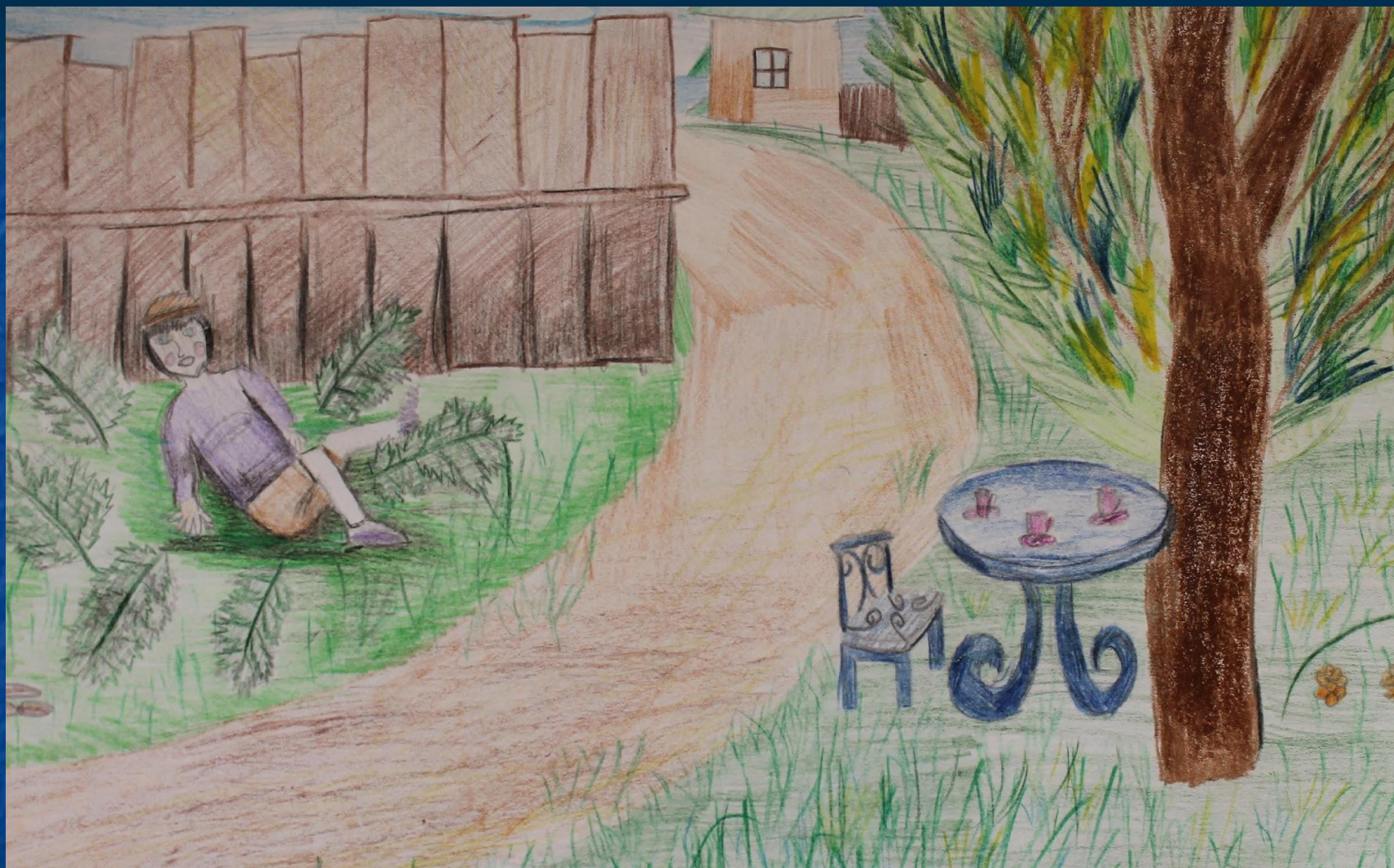
Рисунок Шабалиной Юлии 3 кл. (9 лет) к стихотворению Леонтьева А.К. «Наш Паршион куатаськыз».