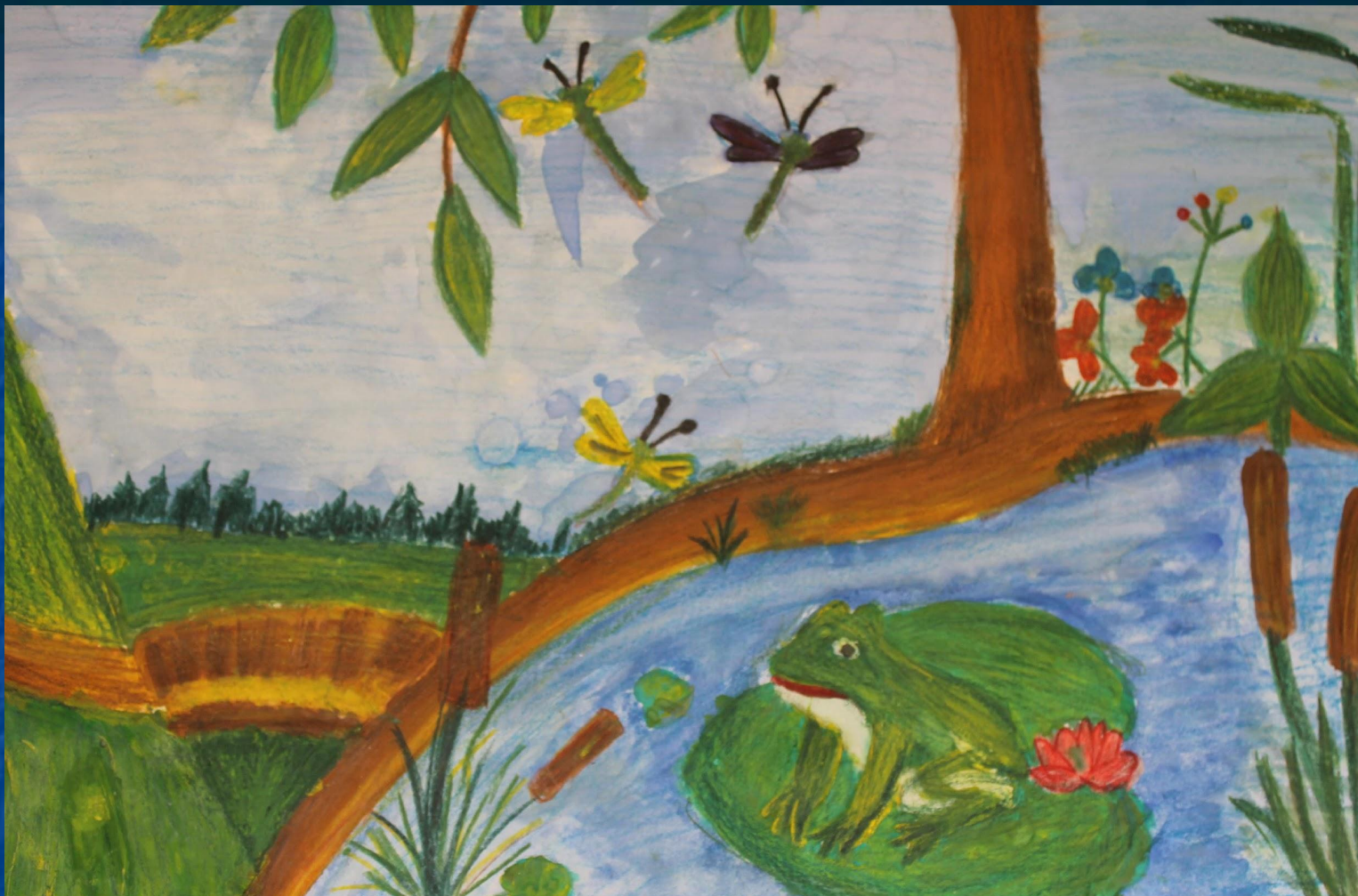
Рисунок Бакрушева Захара 3 кл. (9 лет) к стихотворению Леонтьева А.К.

Бака шедьтэм аслыз куар, Солы кельшем бакакуар. Куар улэ Ватиськыса, Шып улэ Шутэтскыса.