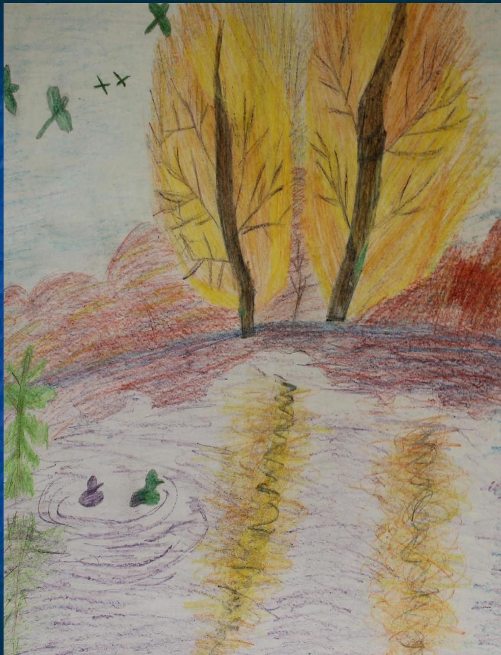
Рисунок Кузнецовой Софии 2 кл.(8 лет.) к стихотворению Леонтьева А.К.

Озеро в чаще лесной притаилось. Откуда взялось оно?