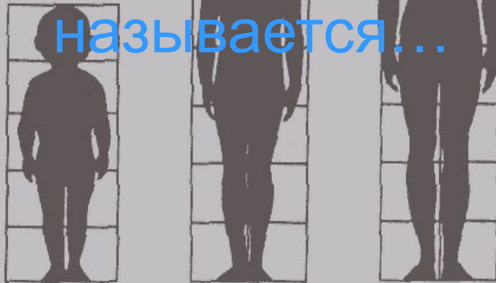
Соотношение частей тела у ребенка, подростка и взрослого человека