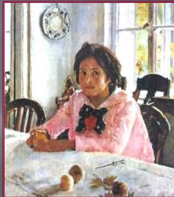
В.Серов «Девочка с персиками».