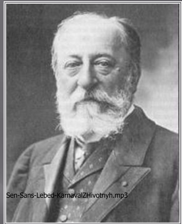
французский композитор, пианист, органист, дирижёр, музыкальный критик и писатель, педагог, музыкально- общественный деятель