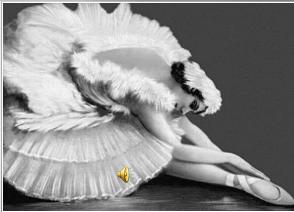
Анна Павлова, исполняющая хореографическую композицию К. Сен-Санса «Умиравший лебедь»