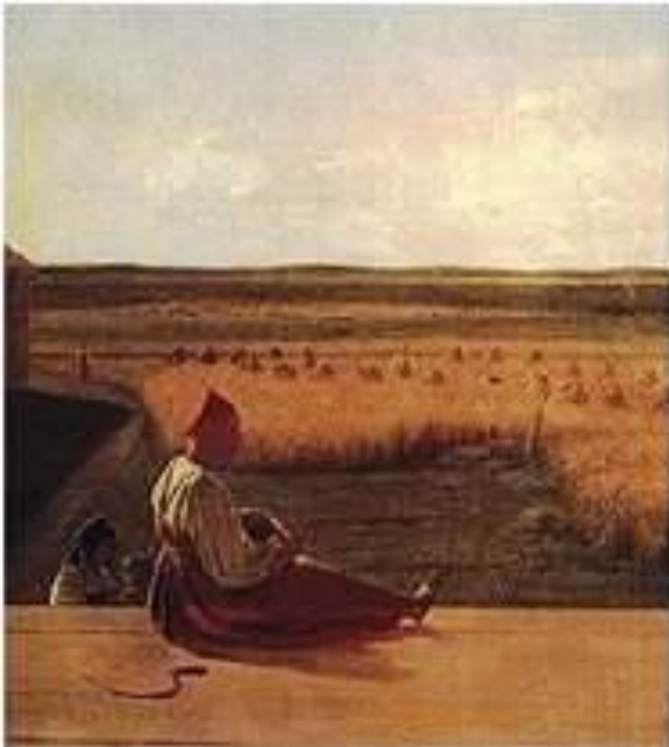
«НА ЖАТВЕ, ЛЕТО» 1820 Г