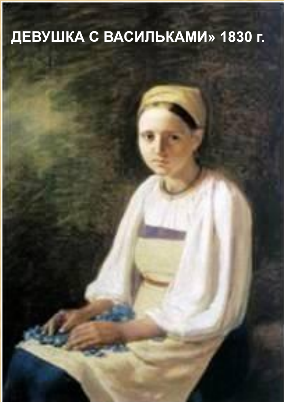
ДЕВУШКА С ВАСИЛЬКАМИ» 1830 г.