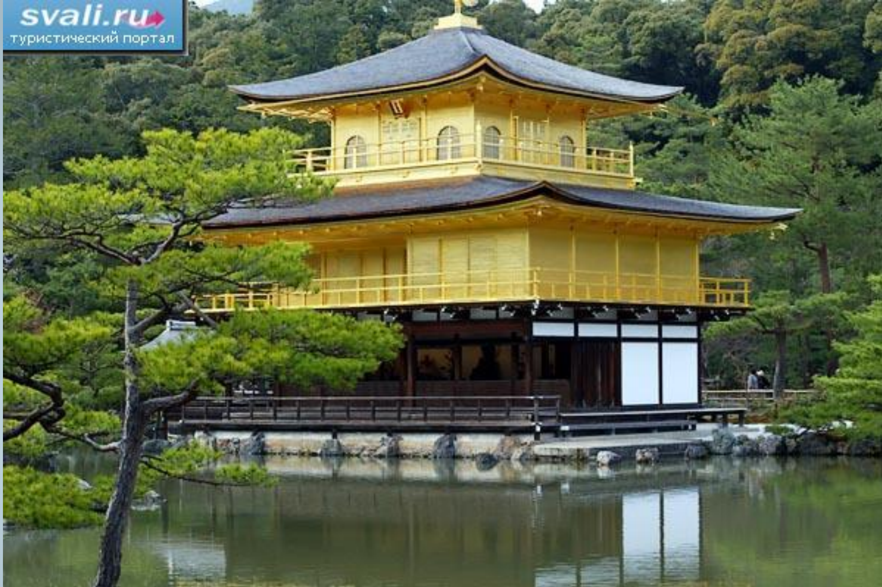
Золотой павильон в Киото.