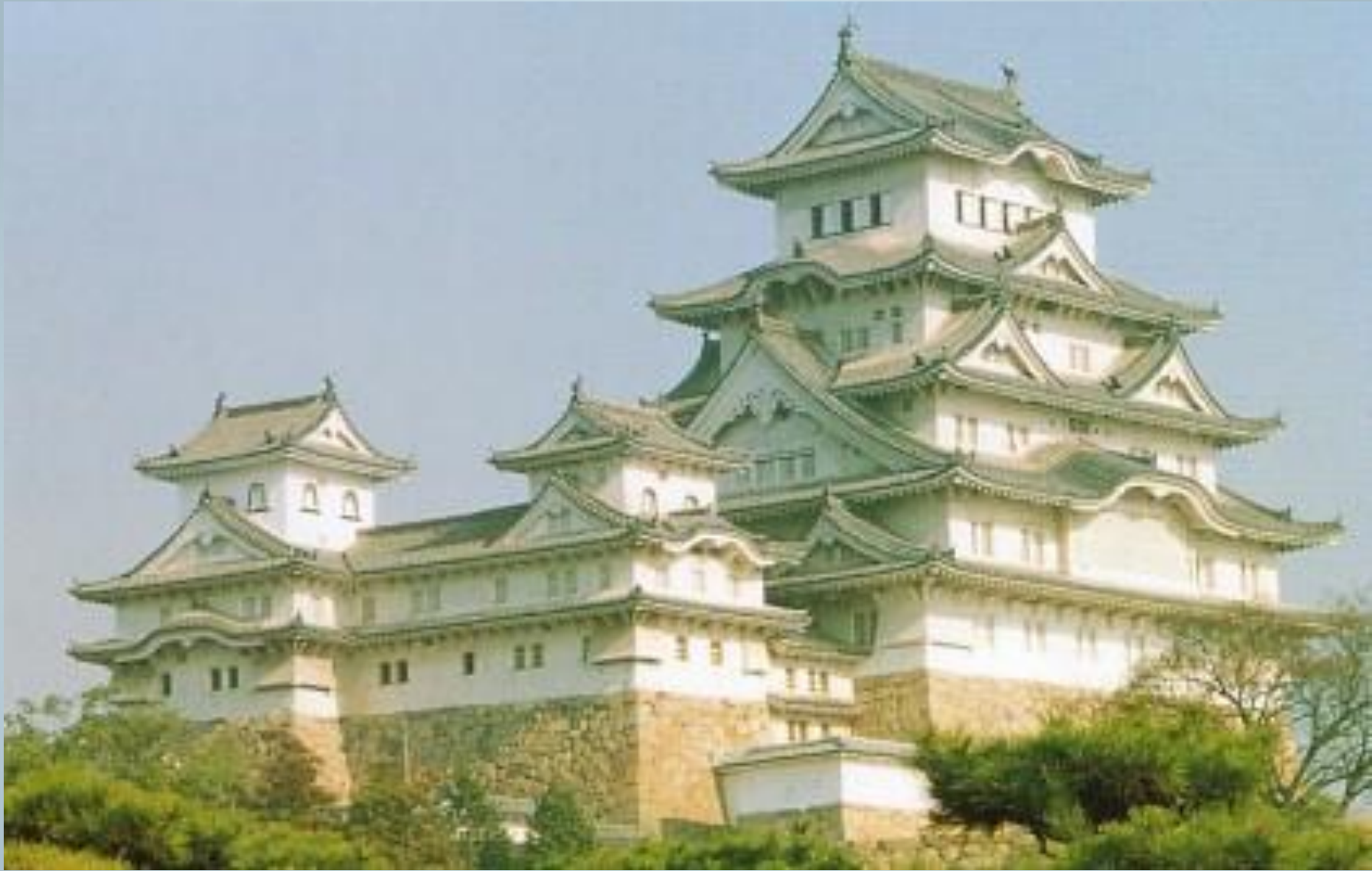
• Замок Химэдзи. 1601-1609г. •