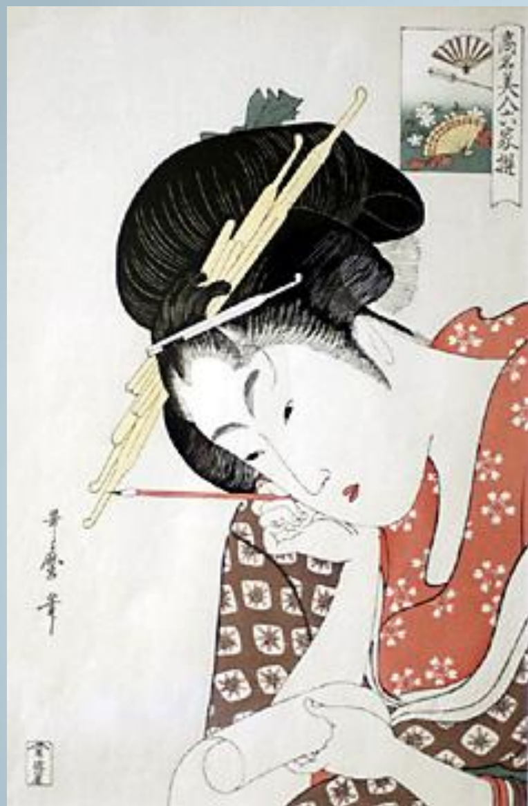
Китагава Утамаро. «Огия Касен»