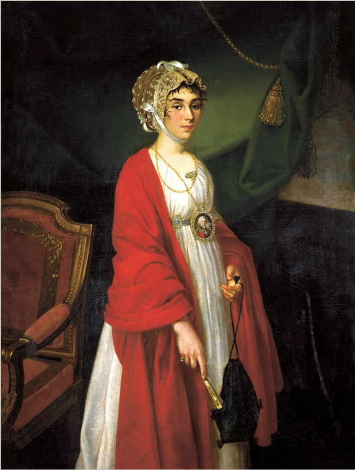
Прасковья Ивановна Жемчугова, русская актриса и певица