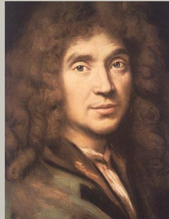
Жан Батист Мольер