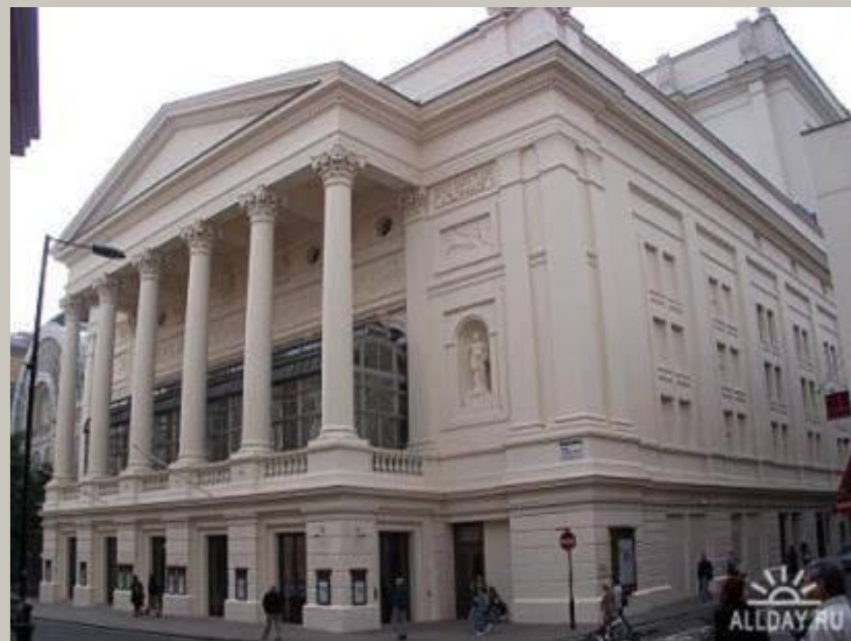
Ковент Гарден (Лондон, Великобритания)