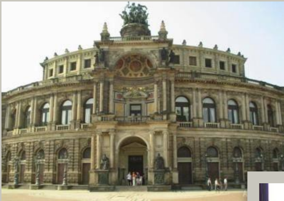
Дрезденская опера (Дрезден, Германия)