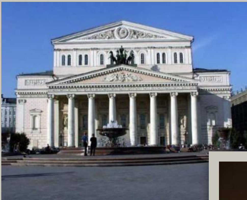
Большой театр (Москва)