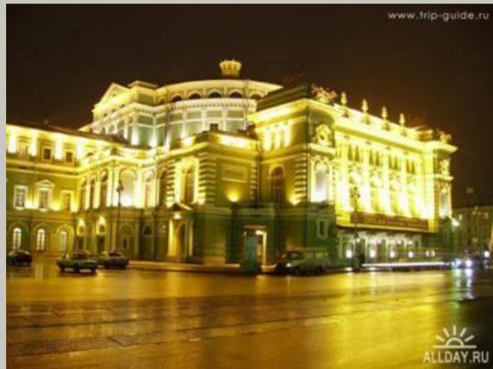
Мариинский театр (Санкт-Петербург)