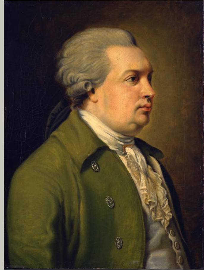
Денис Иванович Фонвизин, создатель русской бытовой комедии