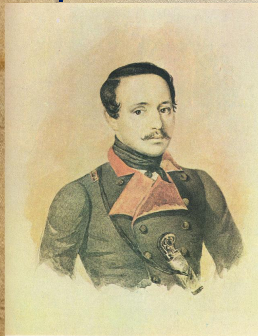
К.А. Горбунов Лермонтова.

й отдел редстав многог юэста. Н сиональ ации (Ф Клюндер рижизн впослед писи) э