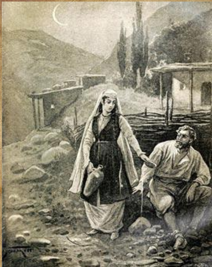
Иллюстрация к роману М.Ю. Лермонтова «Кавказский пленник»