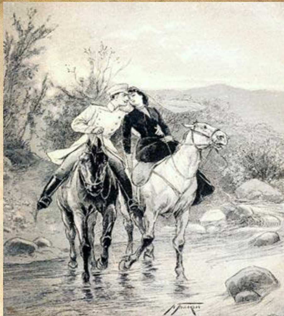
Иллюстрация к поэме М.Ю. Лермонтова, «Герой нашего времени», «Княжна Мэри»