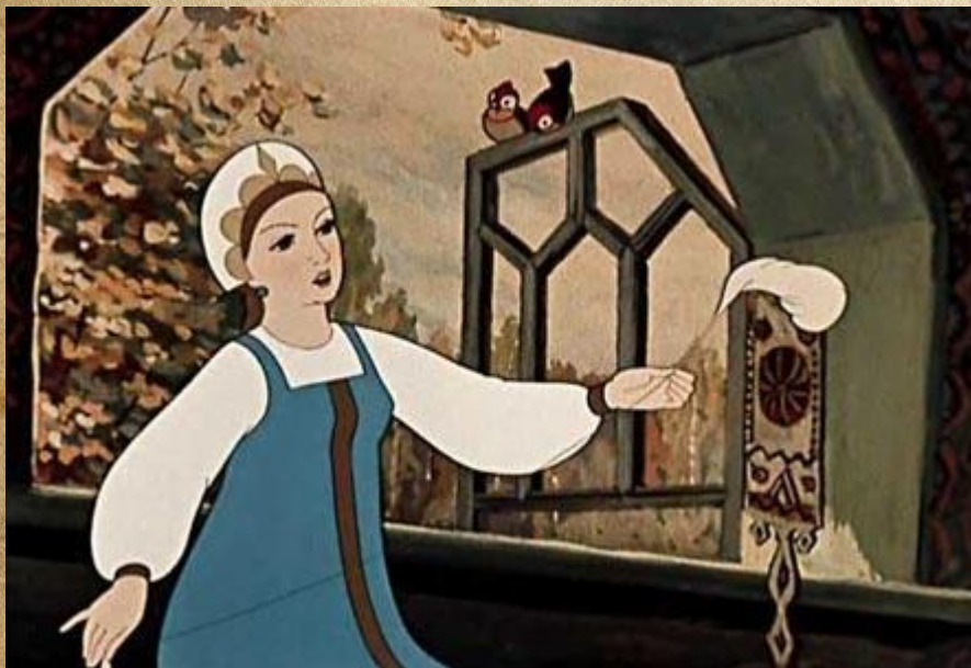
«Сказка о мёртвой царевне и о семи богатырях». Иллюстратор Е. Мешков