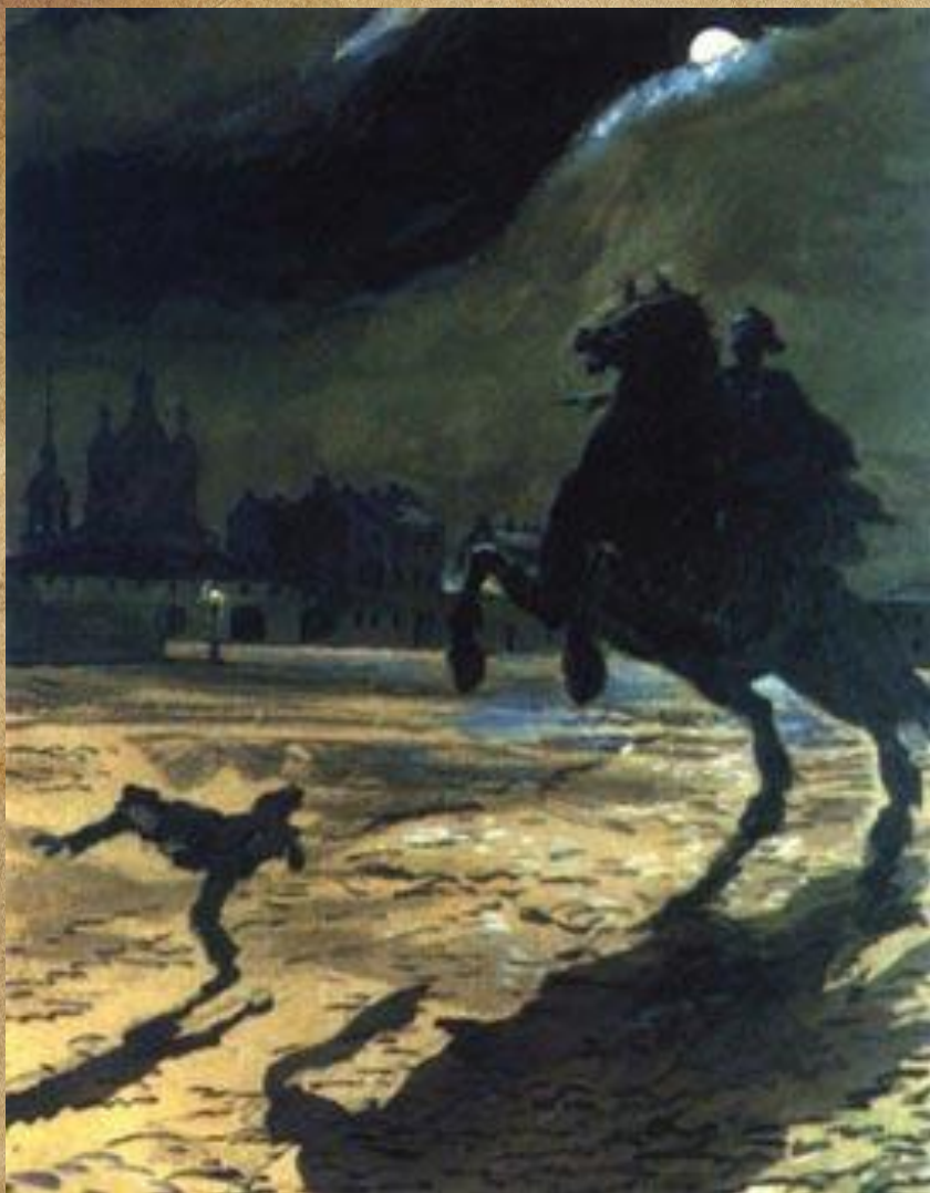
А. Бенуа. Иллюстрация к поэме «Медный всадник»