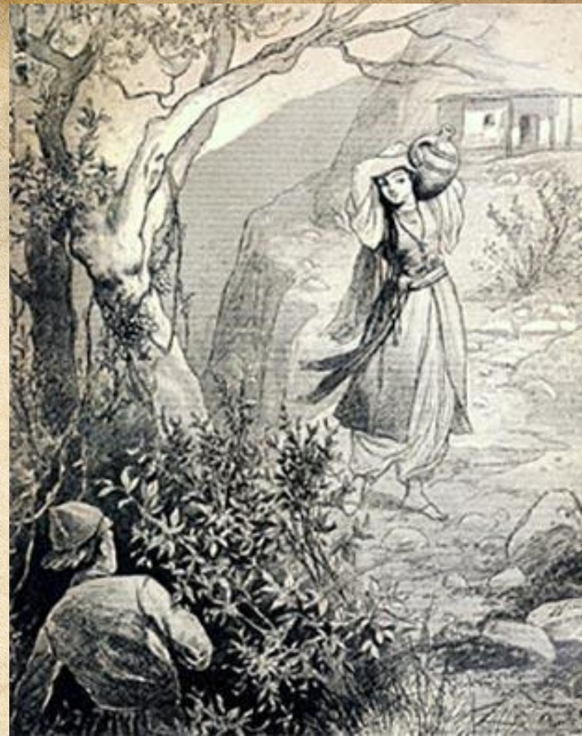
Иллюстрация к поэме М.Ю. Лермонтова, «Мцыри»