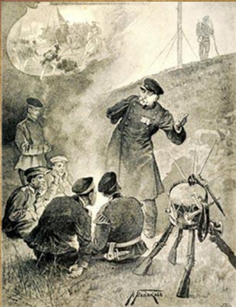
Иллюстрация к стихотворению М.Ю. Лермонтова «Бородино»