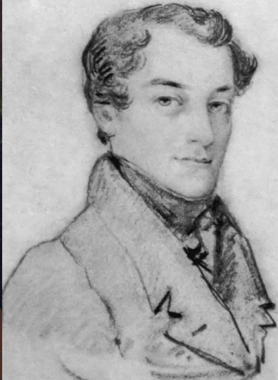
Кондратий Фёдорович Рылеев

Одн портр Искус масте устре роман худож лучш роман своих духот харак Имен преим совре Пушк