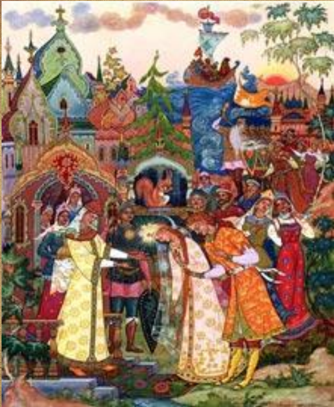
Г. Спирин. Иллюстрация к сказке «Сказка о царе Салтане»