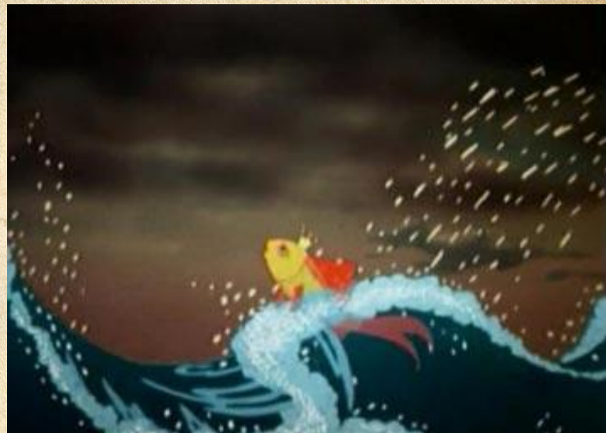
«Сказка о рыбаке и рыбке». Иллюстратор Б.В. Зворыкин