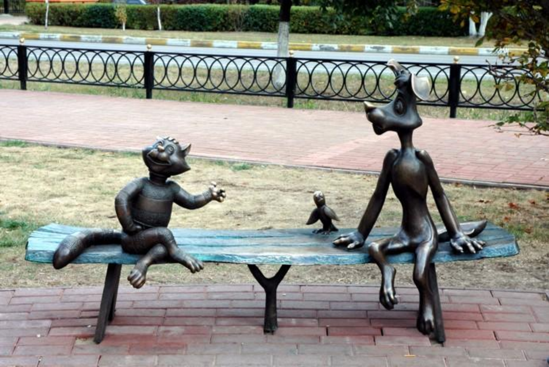
Раменское. Московская область