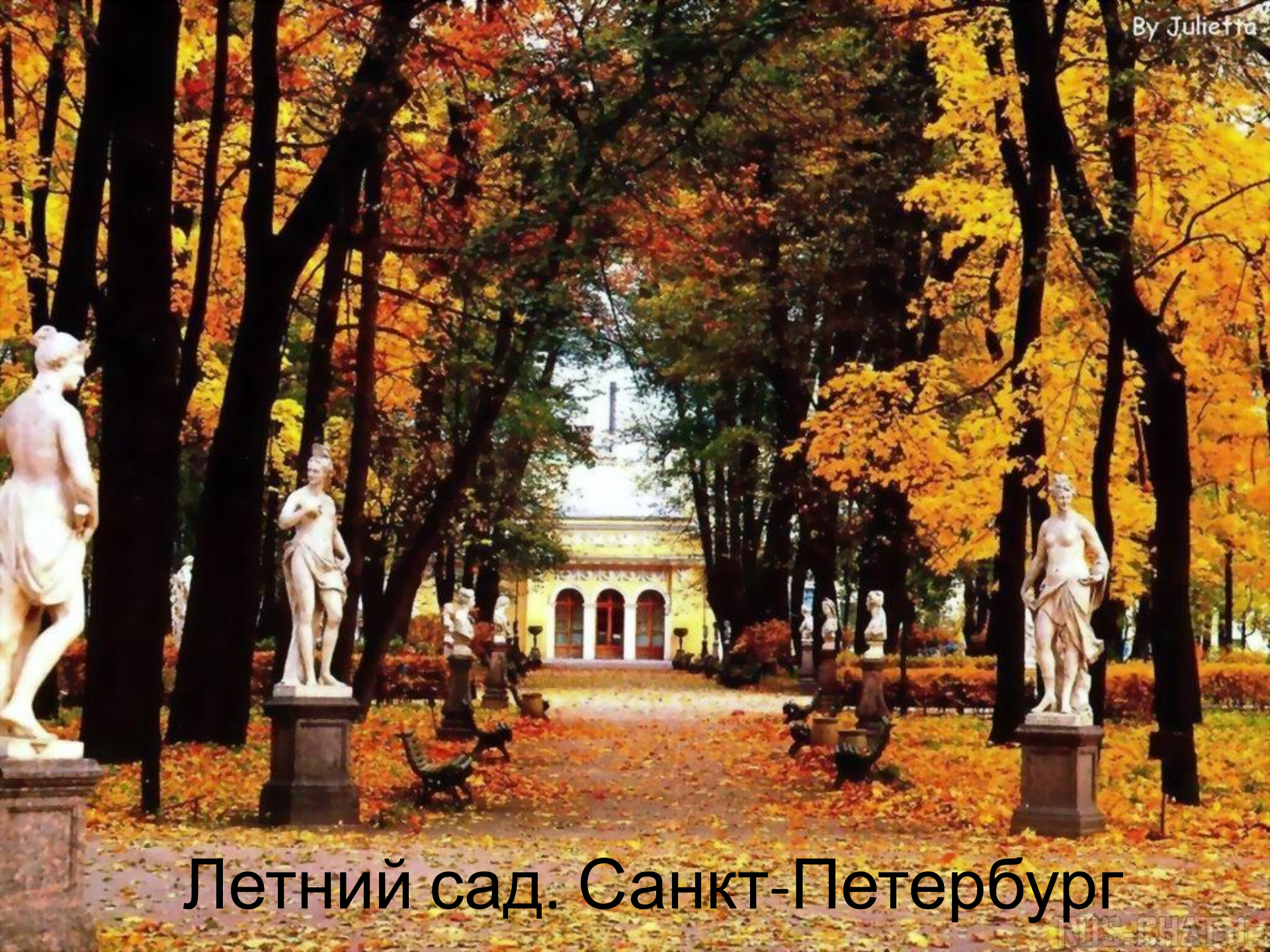
Летний сад. Санкт-Петербург