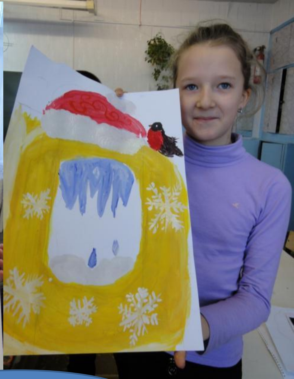
Рисунки 4 х классов