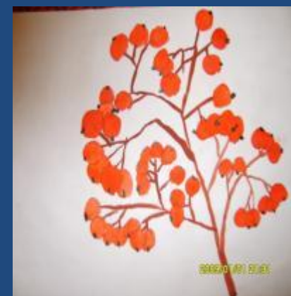
Рисунок ягод шиповника и рябины