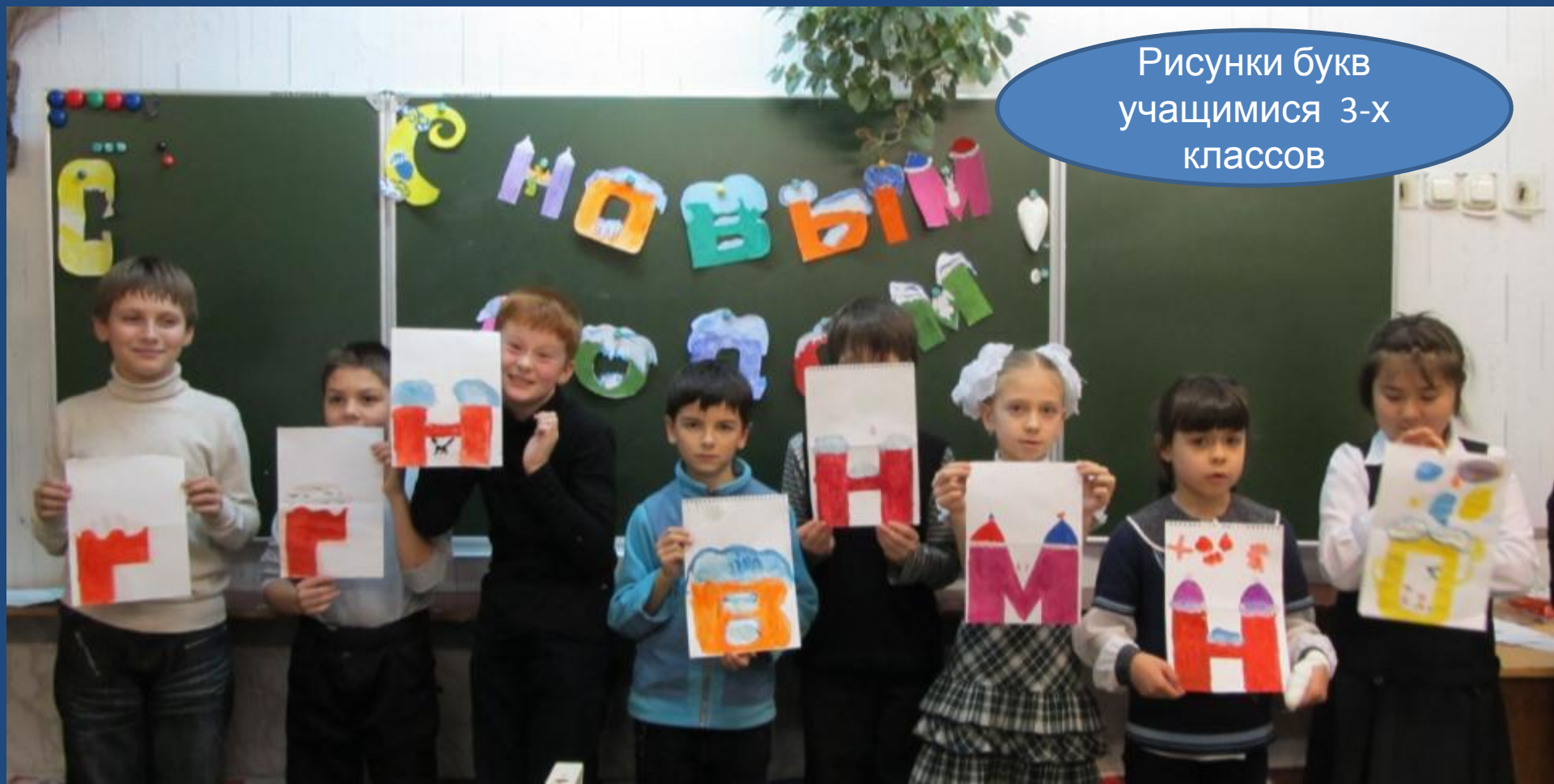
Рисунки букв учащимися 3-х классов