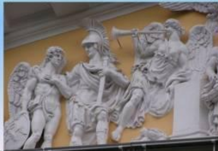
Горельеф на фронте Адмиралтейства

ГОРЕЛЬЕФ - (франц. haut-relief), высокий рельеф, в котором изображение выступает над плоскостью фона более чем на половину своего объёма. Горельефы часто использовались в архитектуре.