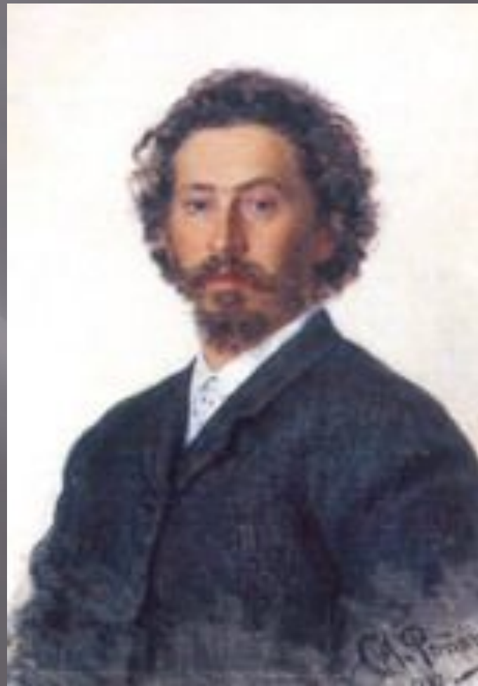
«Автопортрет» Репин Илья Ефимович