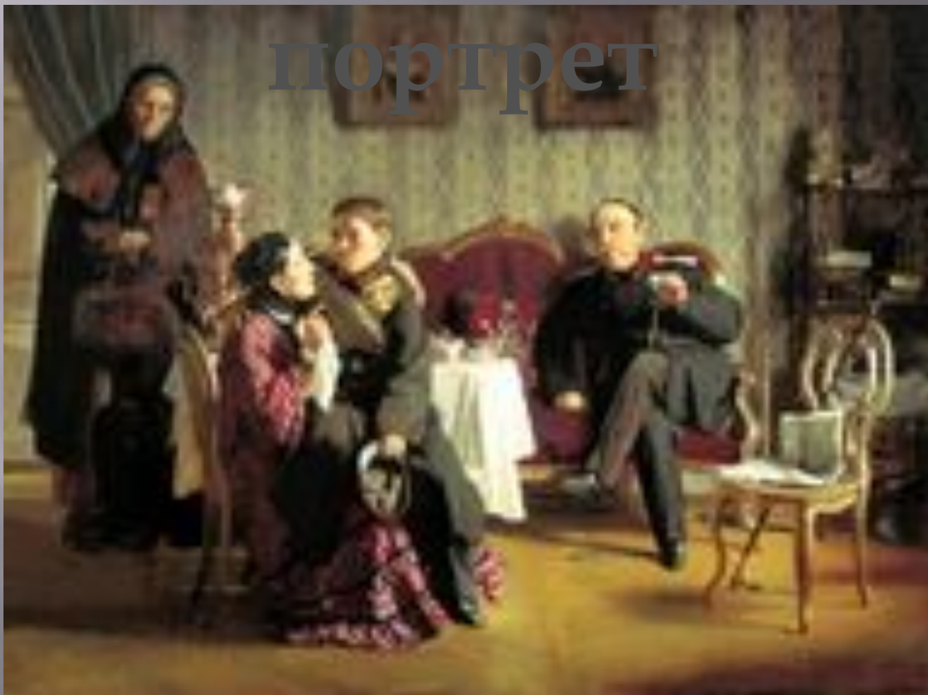
Корзухин Алексей, «Разлука»