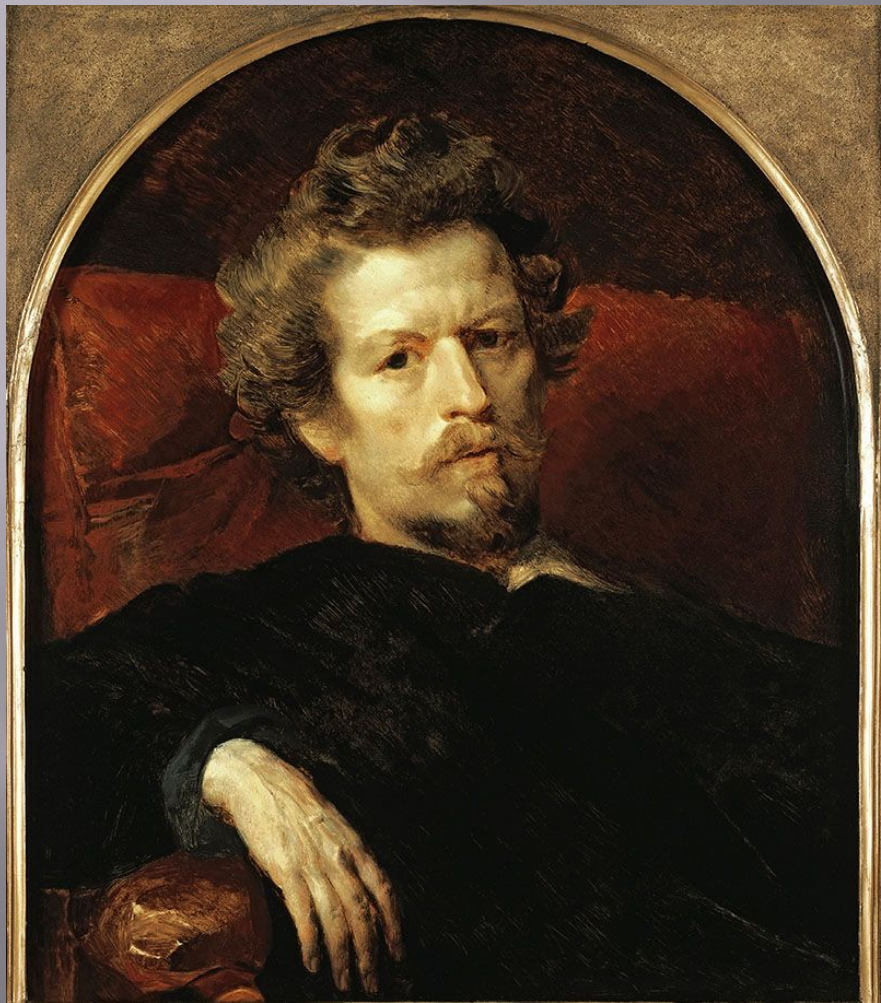
К. Брюллов Автопортрет