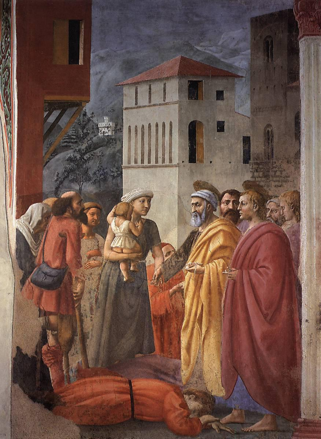
Фреска «Раздача милостыни». Мазаччо (1426-1427гг)