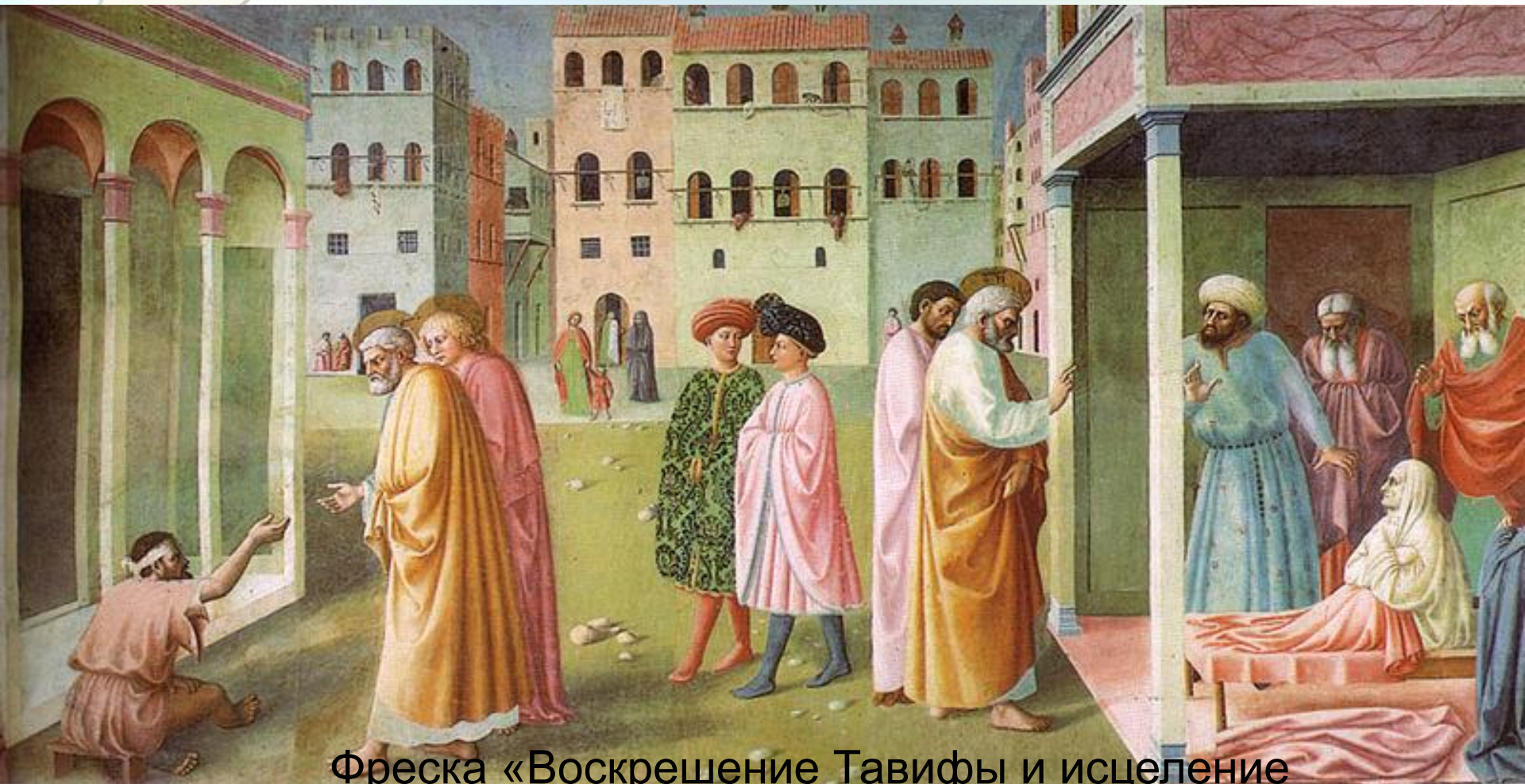
Фреска «Воскрешение Тавифы и исцеление расслабленного». Мазаччо (1426-1427гг)