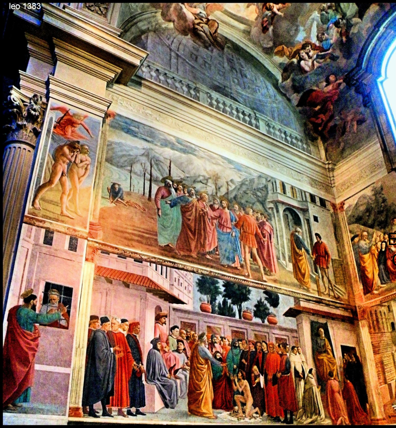
Фрески капеллы Бранкаччи в церкви Санта-Мария дель Кармине во Флоренции.