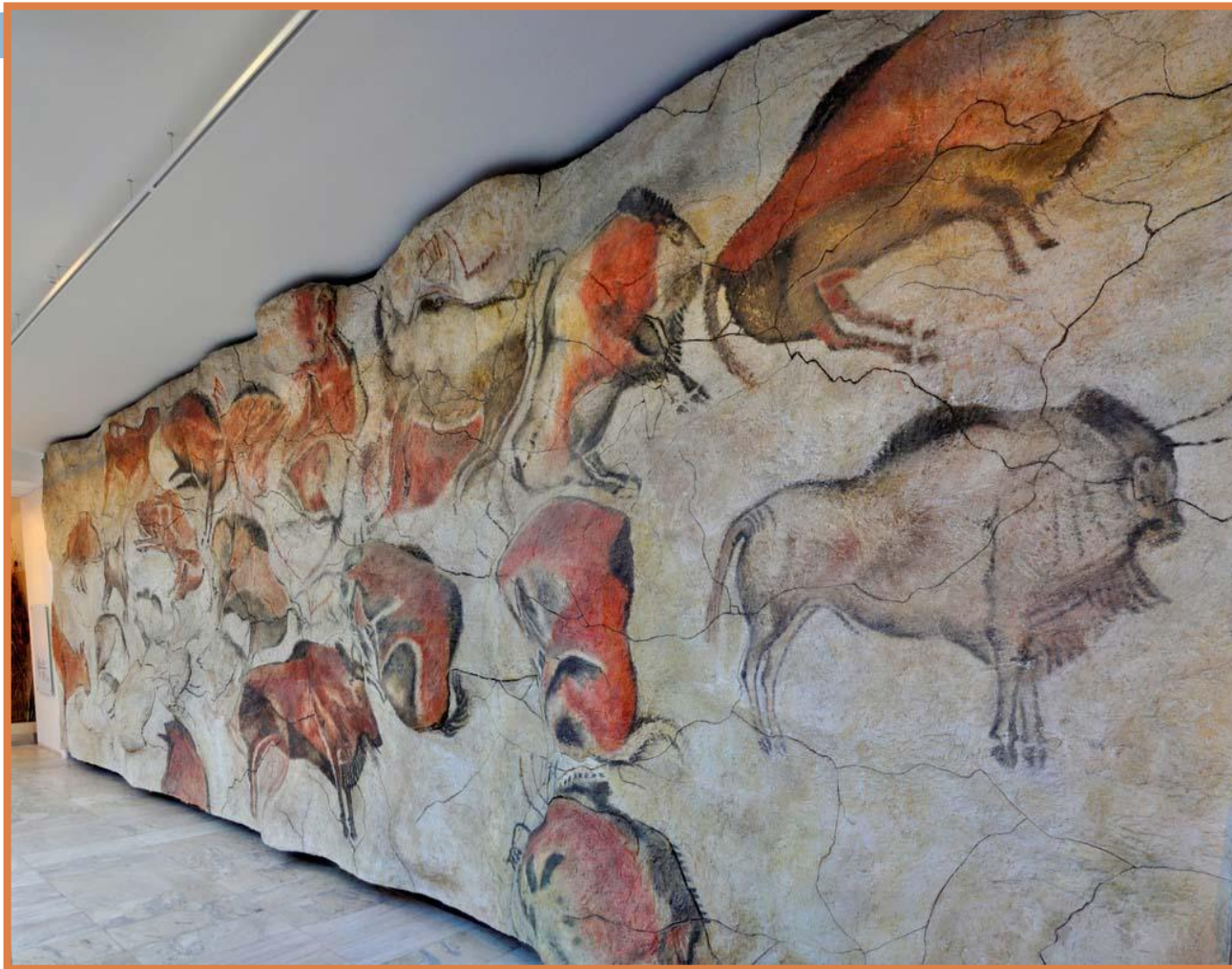
Копии рисунков из пещеры Альтамира