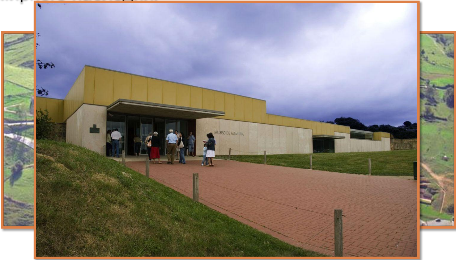
Музейный комплекс Альтамира

Пещера Альтамира — уникальная пещера в Испании, в которой сохранились цветные настенные рисунки времен позднего палеолита. Пещера находится рядом с местечком Сантьяна-дель-Мар, в провинции Кантабрия, на севере страны. В 1985 году ЮНЕСКО присвоило ей статус объекта Всемирного наследия.