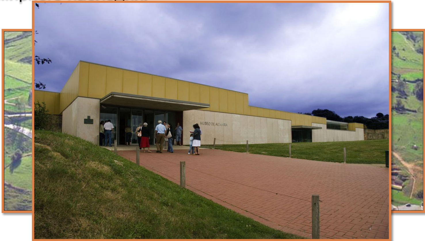
Музейный комплекс Альтамира

Пещера Альтамира — уникальная пещера в Испании, в которой сохранились цветные настенные рисунки времен позднего палеолита. Пещера находится рядом с местечком Сантьяна-дель-Мар, в провинции Кантабрия, на севере страны. В 1985 году ЮНЕСКО присвоило ей статус объекта Всемирного наследия.