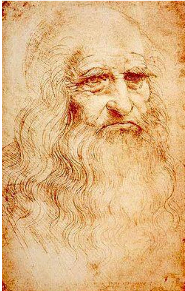
Автопортрет Леонардо да Винчи (1514г.)