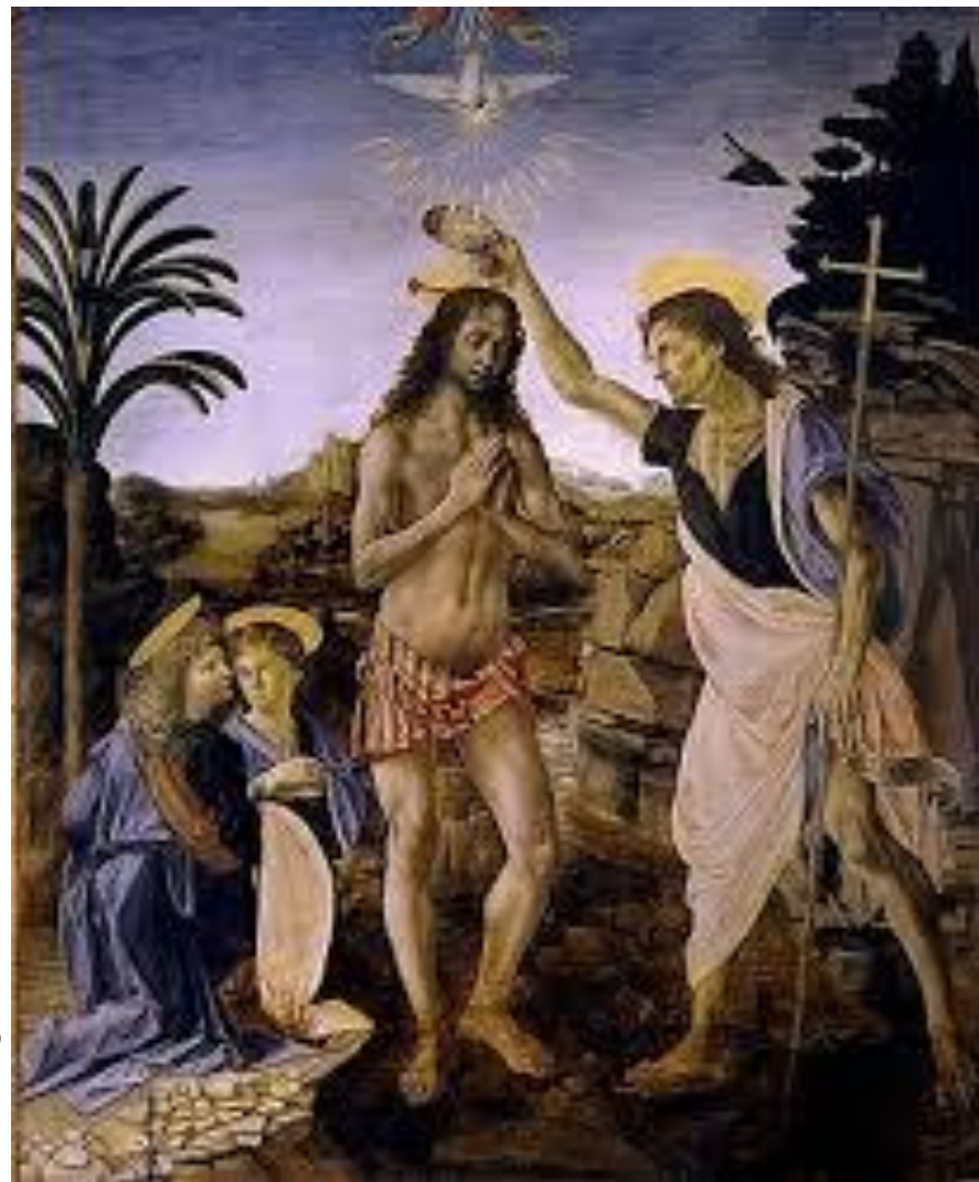
Картина Верроккьо «Крещение Христа». Ангел слева (левый нижний угол) — творение кисти Леонардо

Однажды Верроккьо получил заказ на картину «Крещение Христа» и поручил Леонардо написать одного из двух ангелов. Это была обычная практика художественных мастерских того времени: учитель создавал картину вместе с помощниками-учениками. Самым талантливым и старательным поручалось исполнение целого фрагмента. Два ангела, написанные Леонардо и Верроккьо, недвусмысленно продемонстрировали превосходство ученика над учителем. Как пишет Вазари, поражённый Верроккьо забросил кисть и никогда больше не возвращался к живописи.