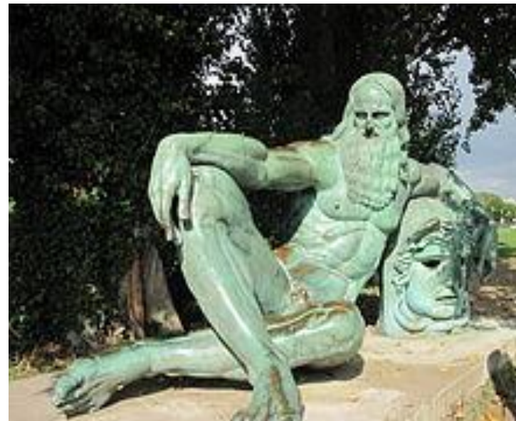
Памятник Леонардо в Амбрузе