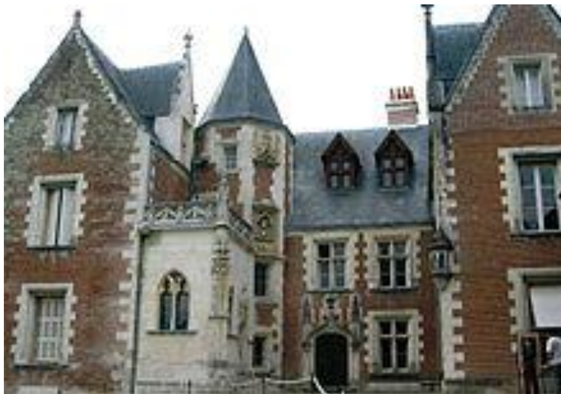
Кло-Люсе, место смерти Леонардо