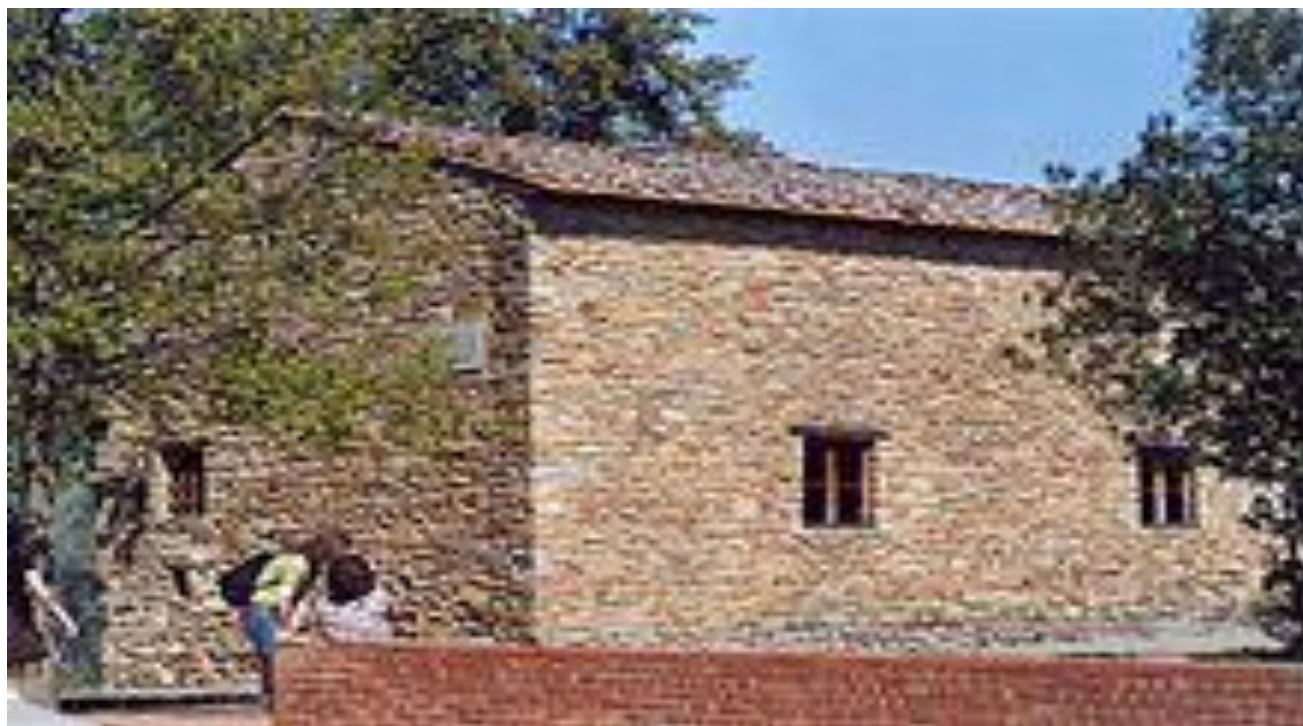
Дом, в котором жил Леонардо