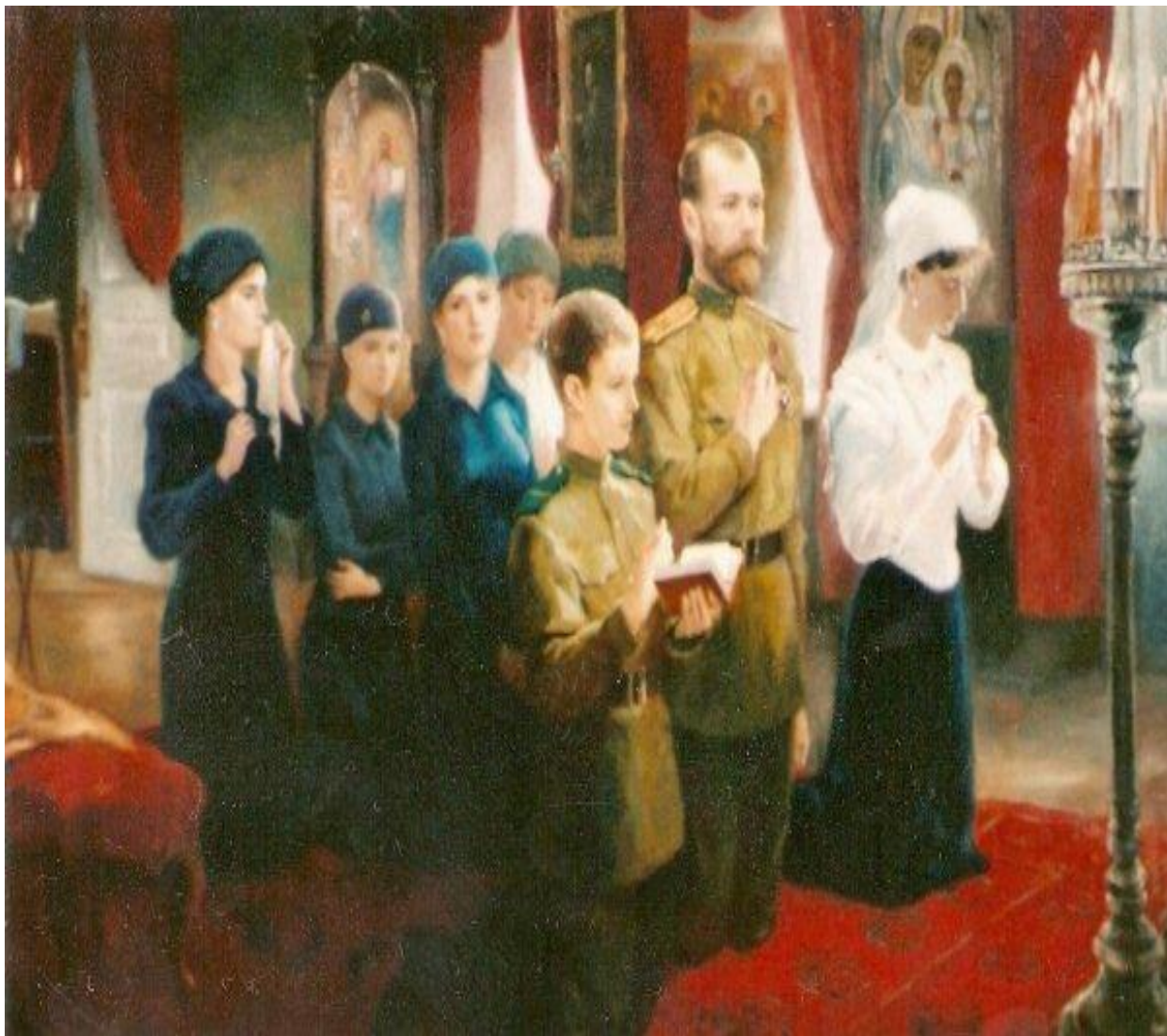
Царская семья на молитве. 1918 год . Город Екатеринбург.