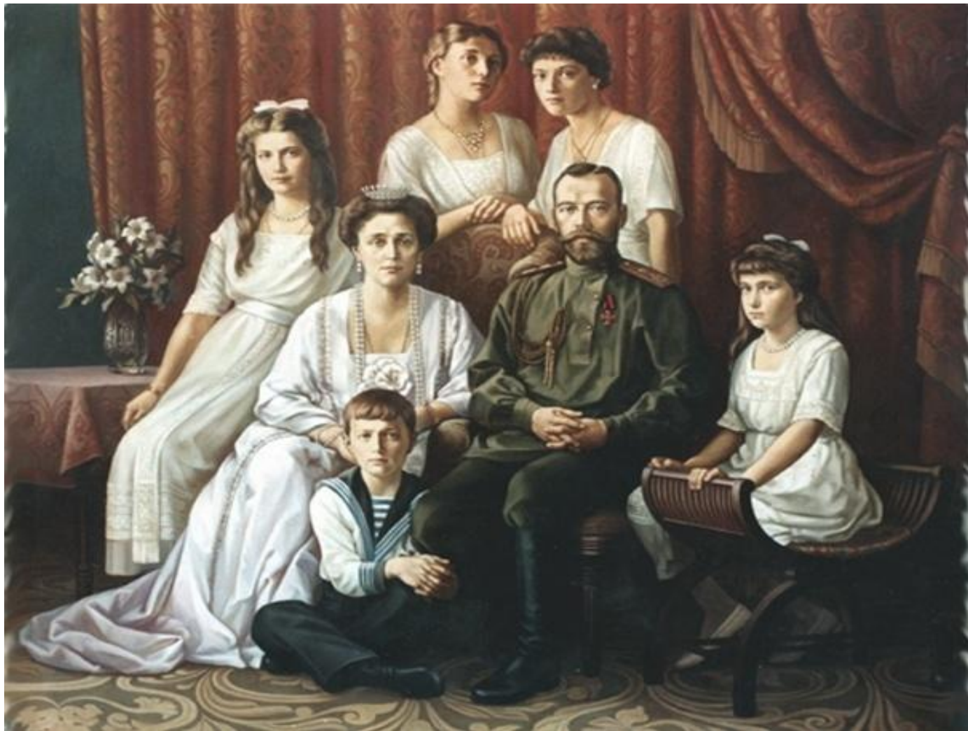
Император Николай II и Императрица Александра Федоровна с детьми.