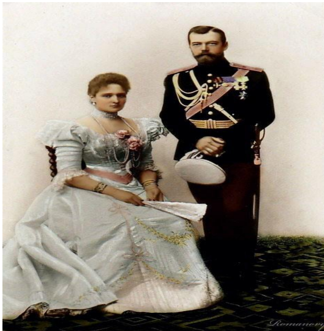
Император Николай II и Императрица Александра Фёдоровна