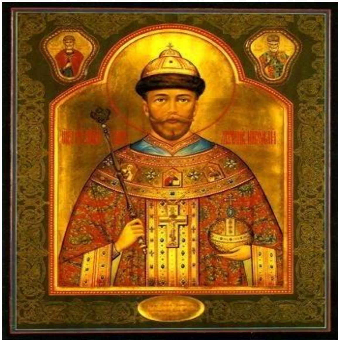
Мироточивая икона Царя – Мученика II