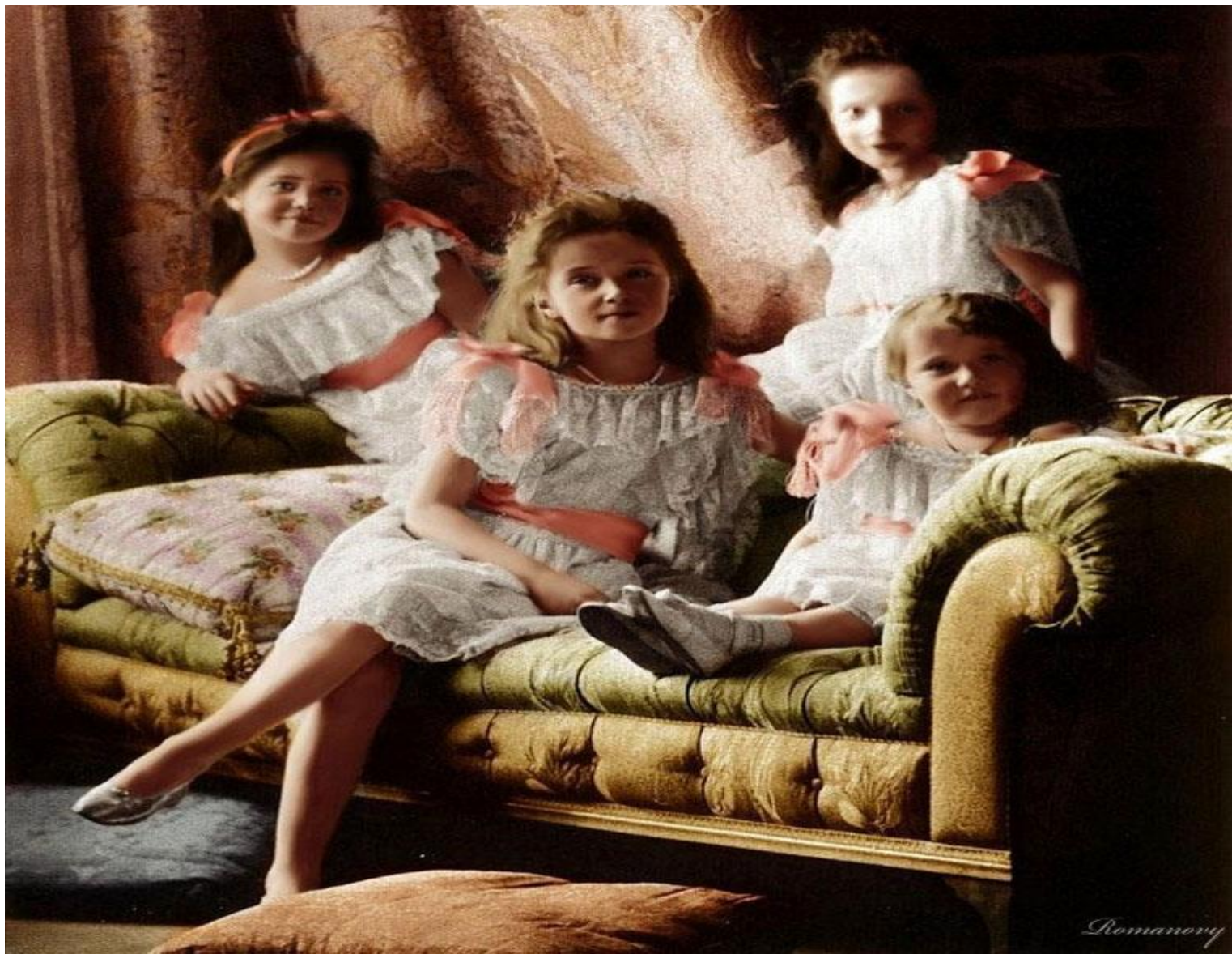
Дочери Императора Никола II (слева направо) Татьяна, Ольга, Мария, Анастасия. Петербург. Фотография 1905 года.