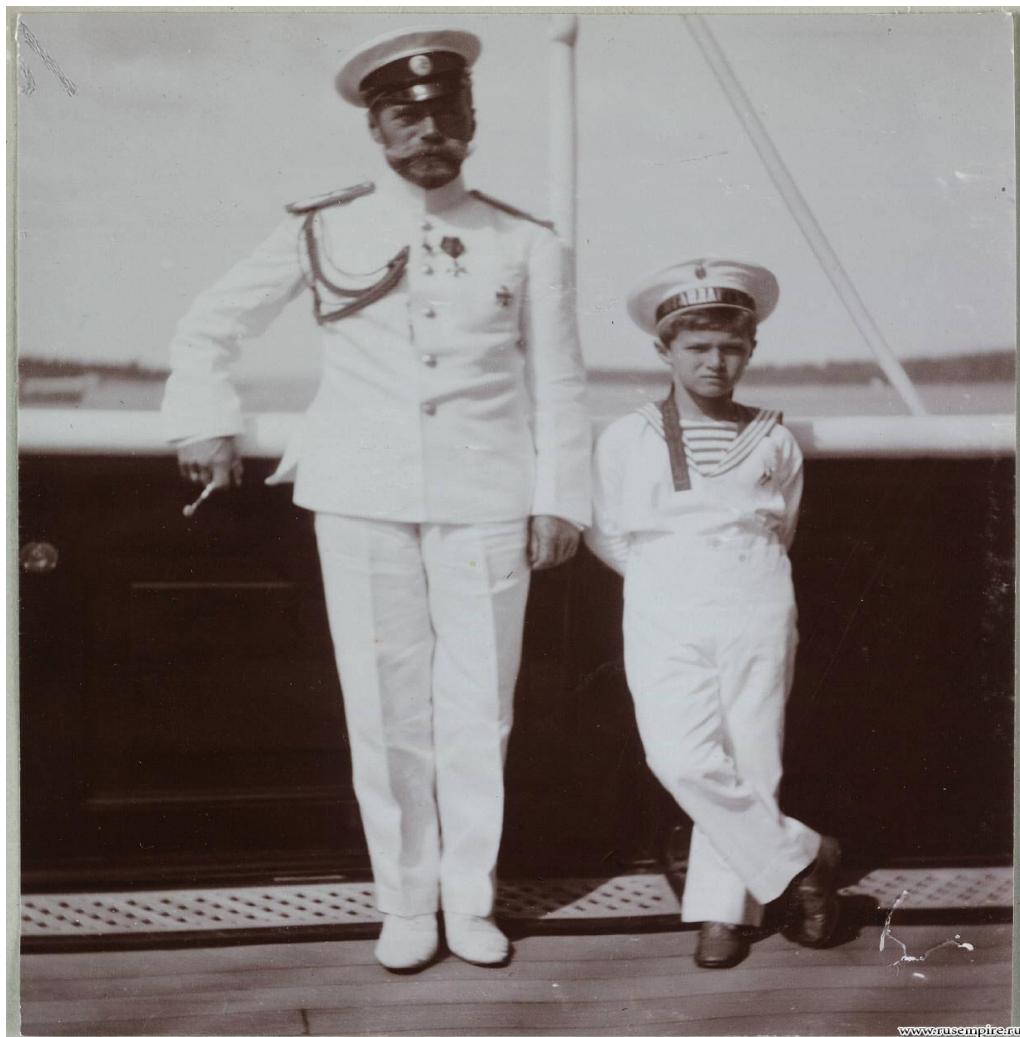
Император Николай II и наследник Цесаревич Алексей