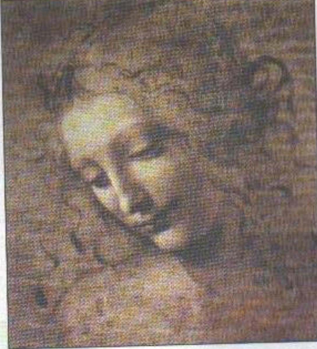
Леонардо да Винчи. НАБРОСОК. Уголь, мел. Италия. XV в.