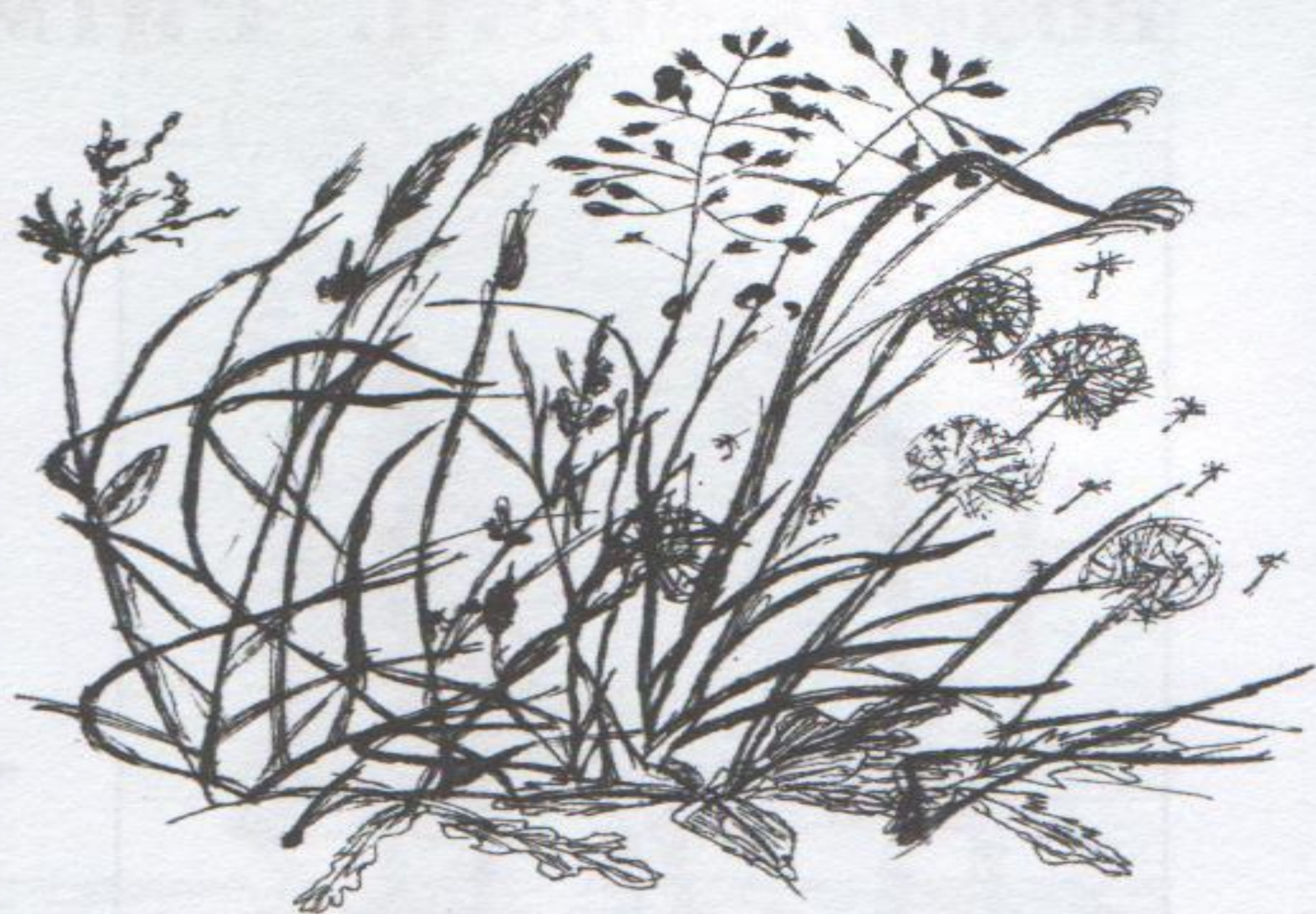
ЦВЕТЫ И ТРАВЫ. Учебная работа. Тушь