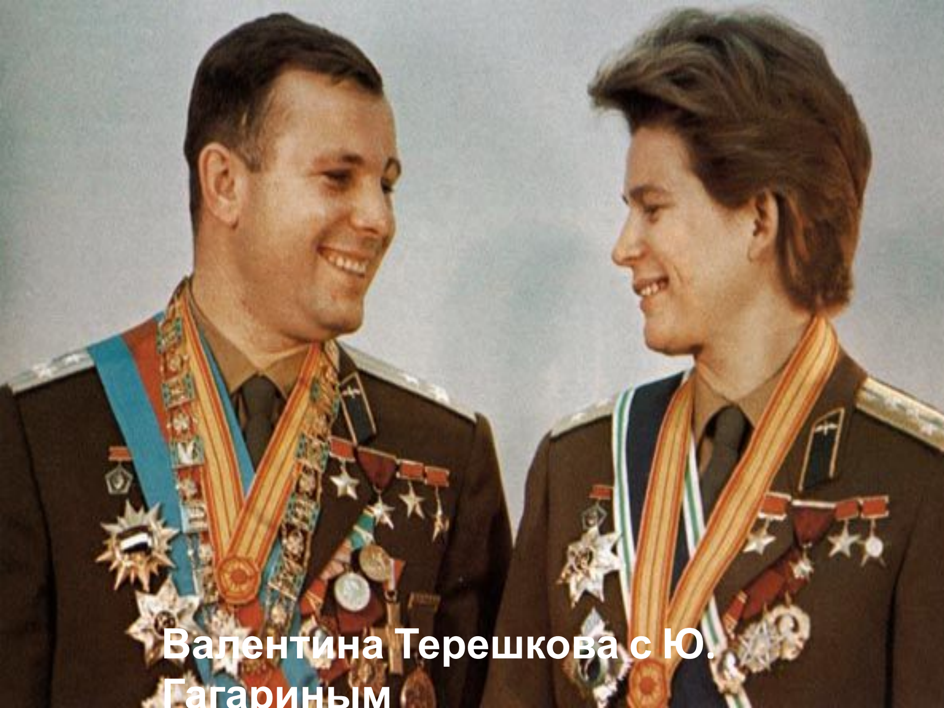
Валентина Терешкова с Ю. Гагариным