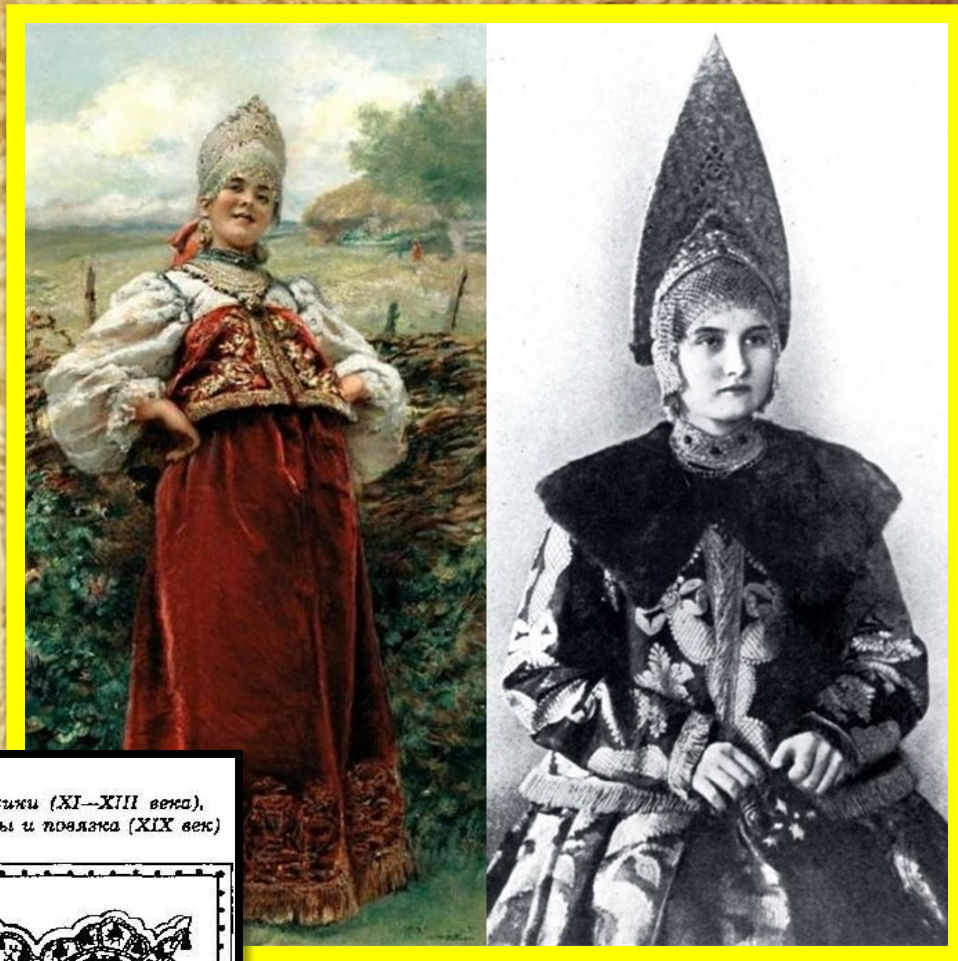
Венчики (XI--XIII века), венцы и повязка (XIX век)