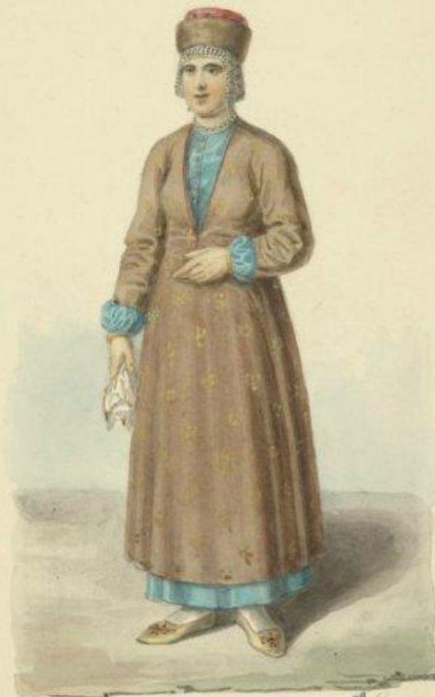
В. Солнцев женщина нижней части Дона 1820 г.