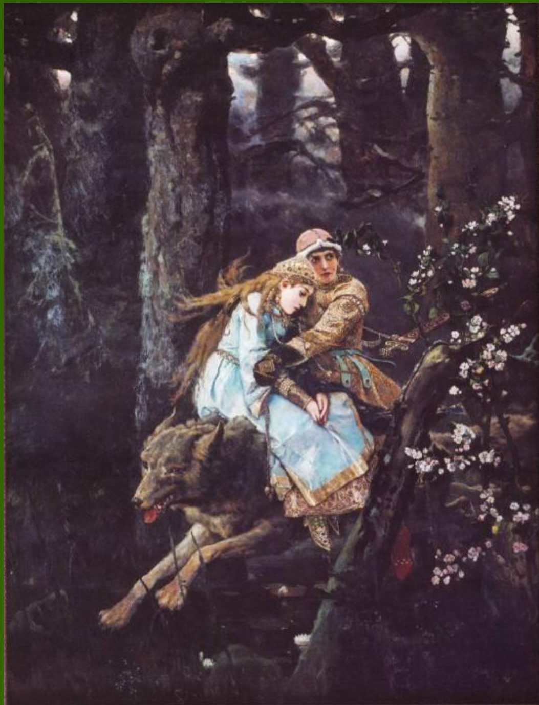
«Иван Царевич на Сером Волке»