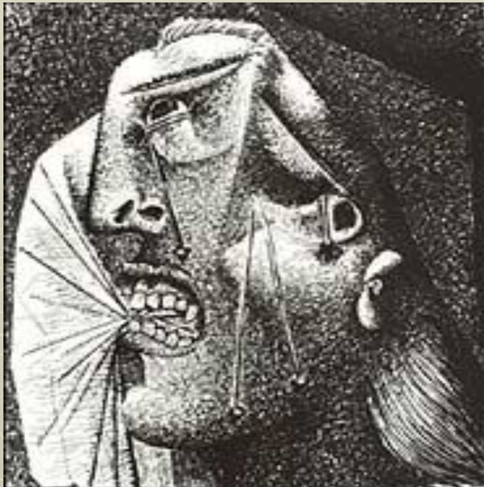
Рисунок выполнен 6 июля 1937 года, уже после создания Герники — одного из основных произведений Пикассо, но на основе более ранних эскизов к ней.