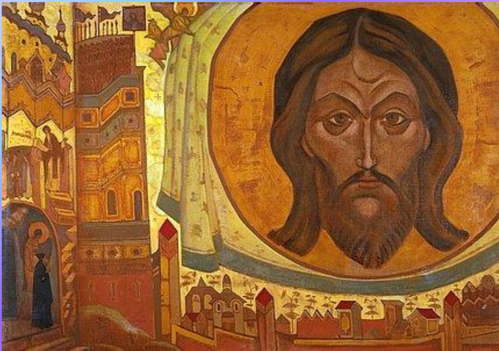
И Мы видим Серия «Святые» 1922. Холст, темпера. 71,1 х 101,5 см Международный Центр Рерихов, Москва