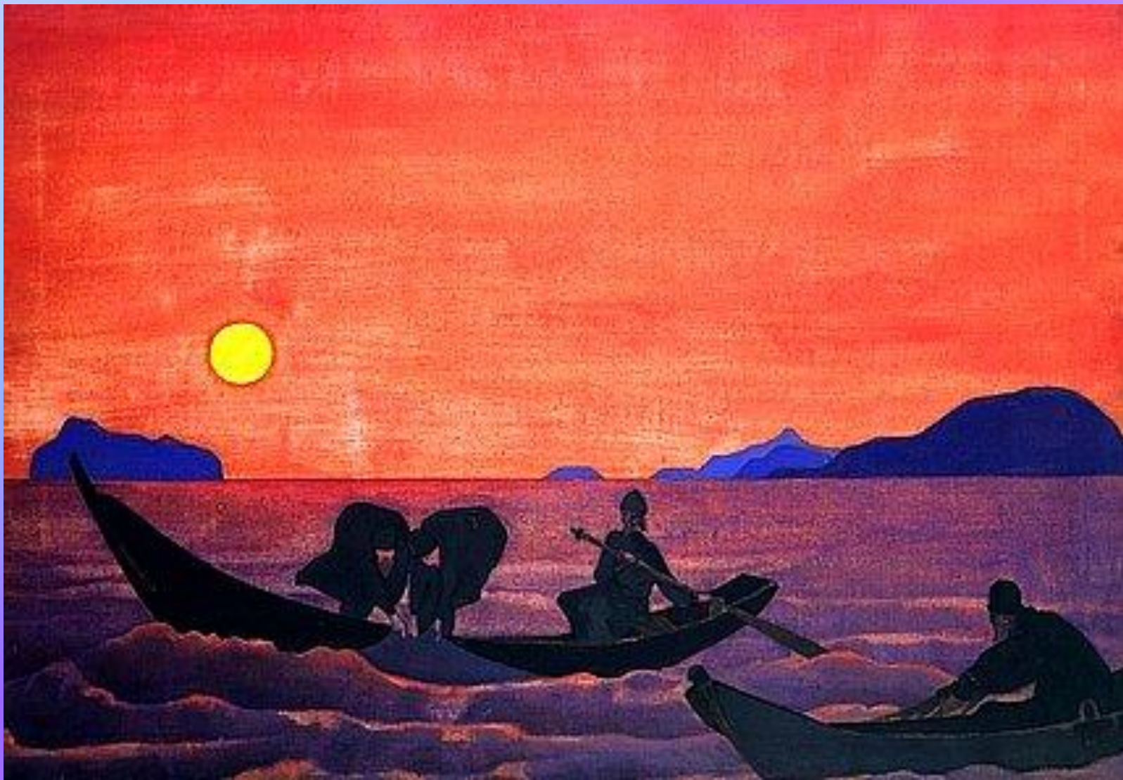
И Мы продолжаем лов. Серия «Святые» 1922. Холст, темпера. 71,1 x 101,5 см Коллекция Боллинга, Гранд Хейвен, Мичиган