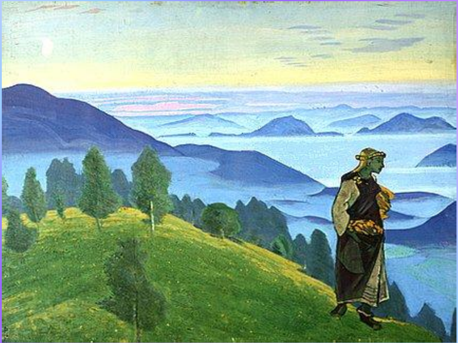
Дочь викинга 1918. Панель, масло. 41,9 x 50,8 см Музей искусств народов Востока, Москва