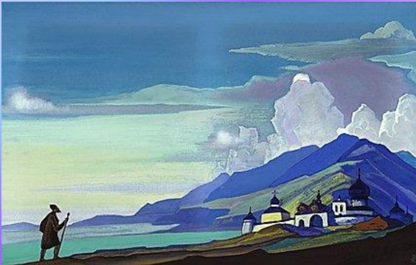
Странник Светлого Града 1933. Холст, темпера. 61,2 x 97 см Музей Н.К.Рериха, Нью-Йорк