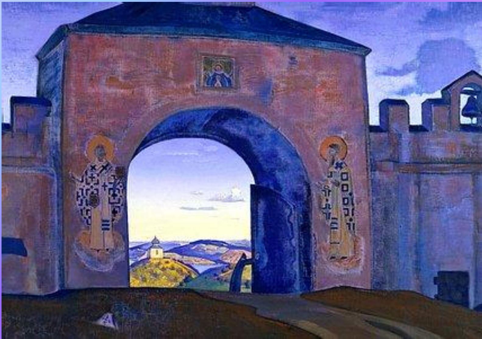
И Мы открываем врата Серия «Святые» 1922. Холст, темпера. 71,1 x 101,5 см Международный Центр Рерихов, Москва