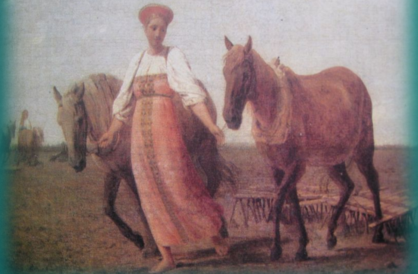
А.Г.Венецианов. На пашне.