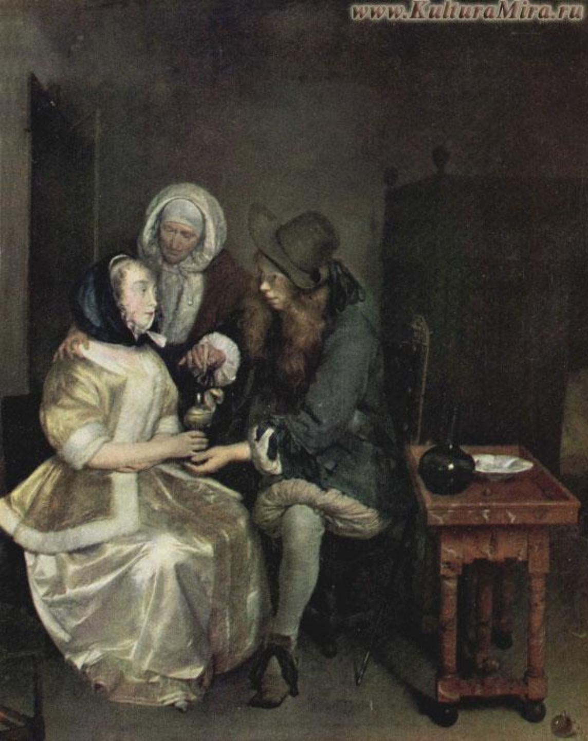
Герард Терборх «Стакан лимонада»