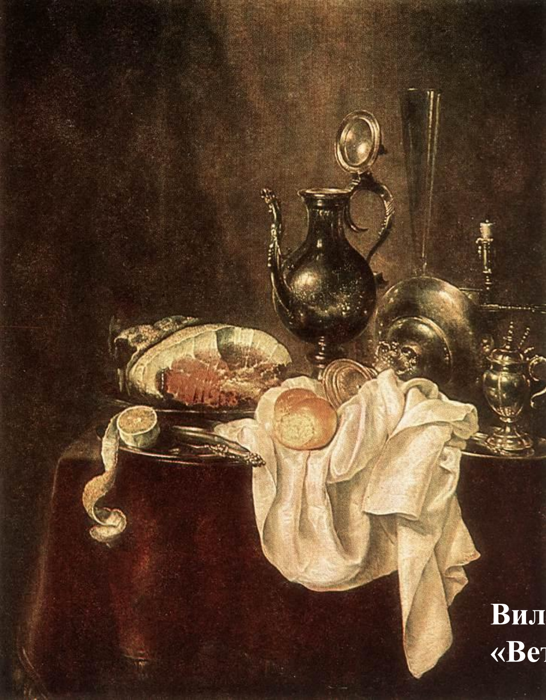
Виллем Хеда «Ветчина и серебряная посуда»