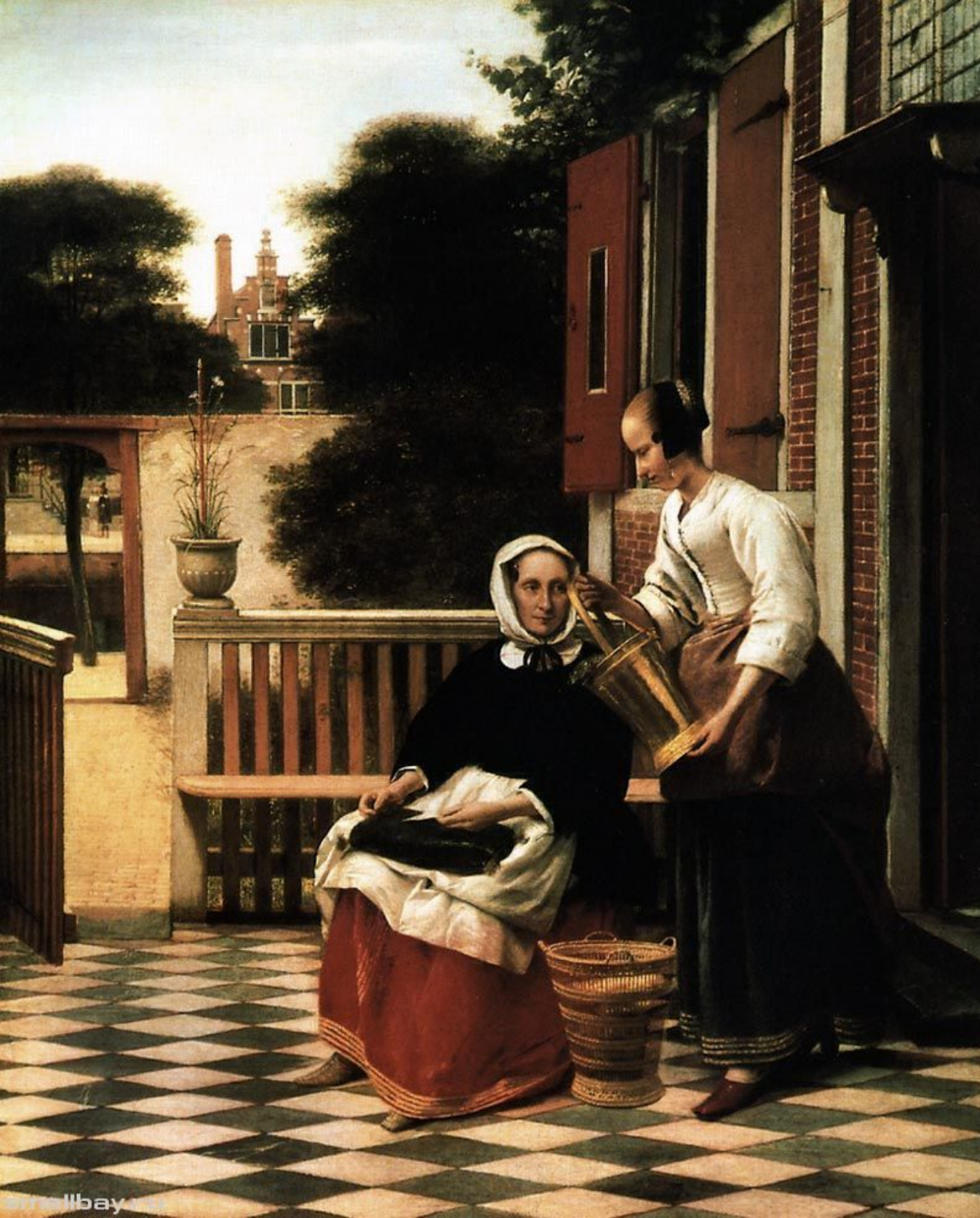
Питер де Хох «Хозяйка и служанка»