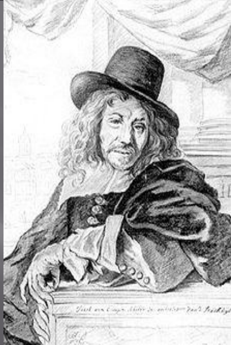
Якоб ван Кампен