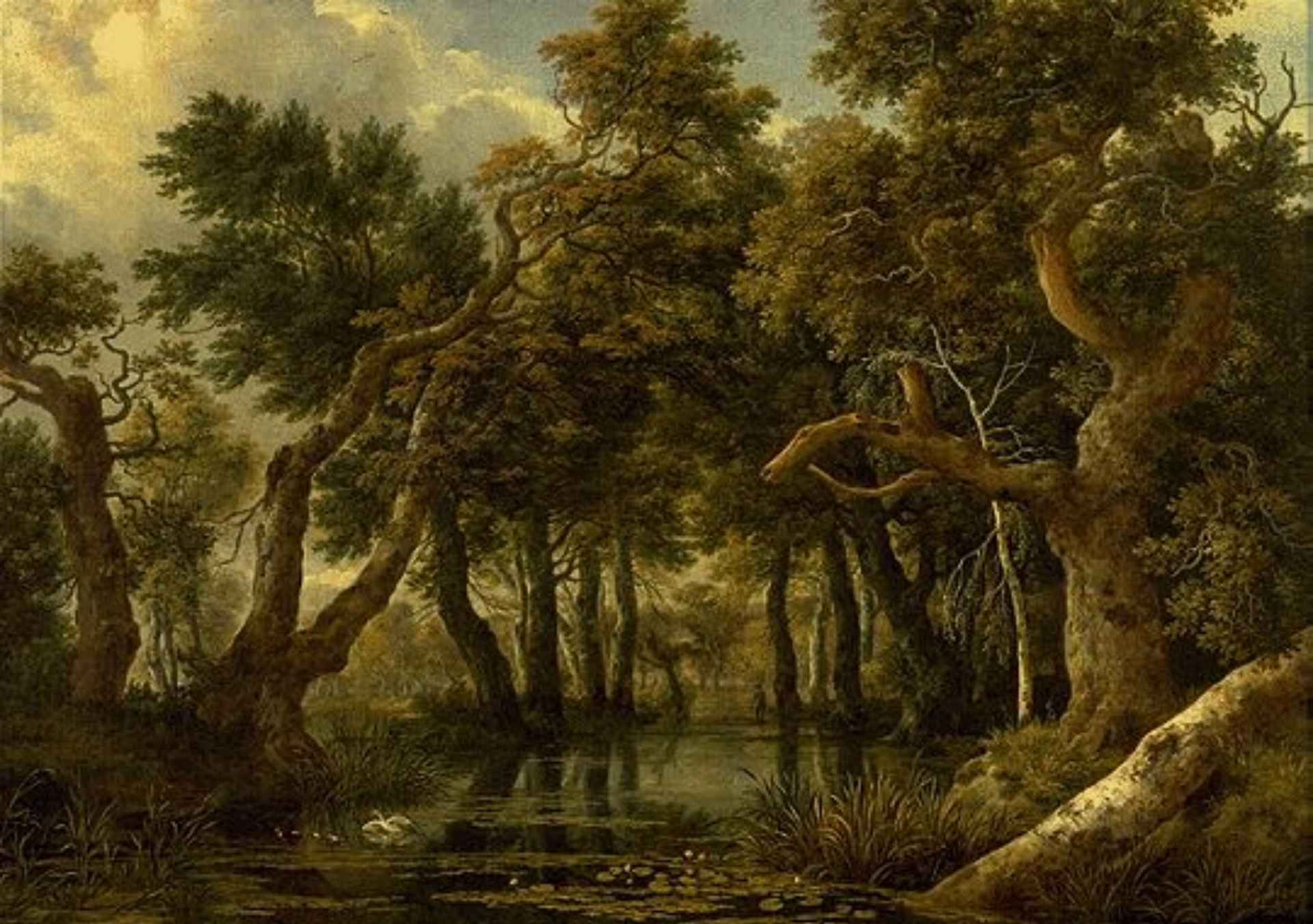
Якоб Рейсдал «Болото»