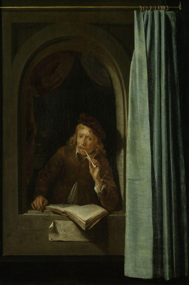
Г. Доу — триста девяносто;