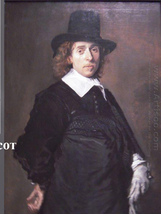
А. ван Остаде — девятьсот двадцать