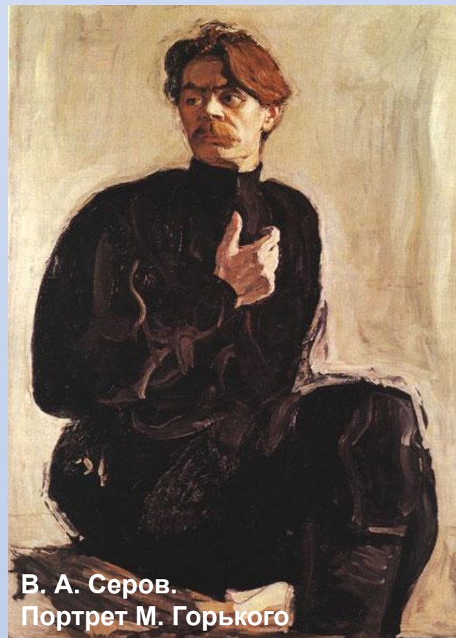
В. А. Серов. Портрет М. Горького

1905 годом – годом гражданской и профессиональной зрелости Серова – датируются его многие полотна.