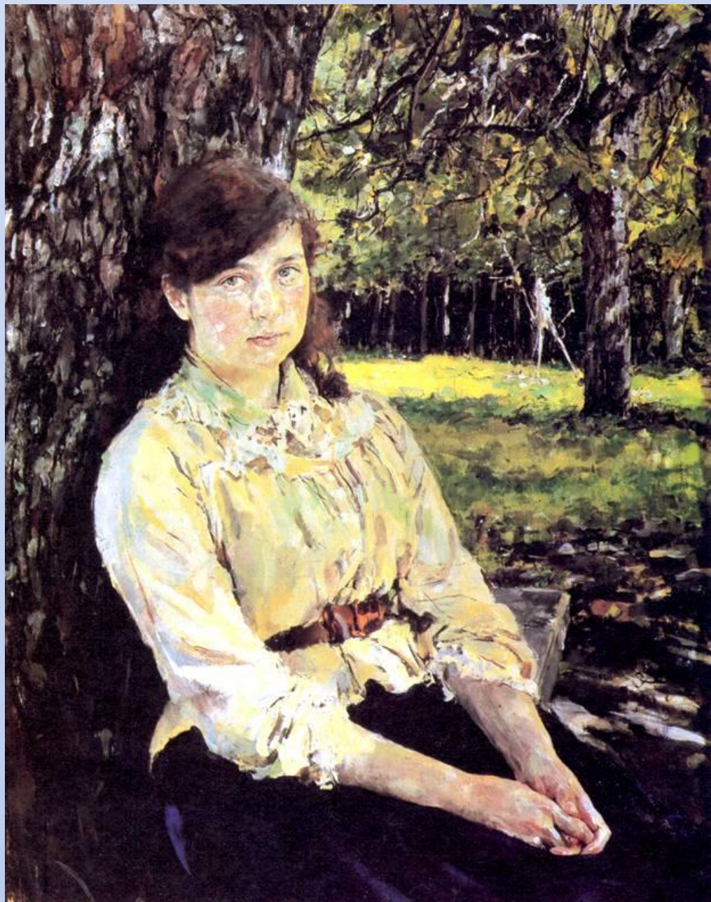
В. А. Серов. Девушка, освещенная солнцем

И вот перед нами серьезная, милая девушка в белой кофточке, со спокойно сложенными на коленях руками, с умным, глубоким взглядом, с незамысловатой прической. А вокруг - все тоже пиршество света, простора, воздуха. Краски чисты и ровны. Только свет солнечного дня, пробиваясь через зелень листвы, становится изумрудным и все преобразует и кажется, что ты попадаешь в волшебное.