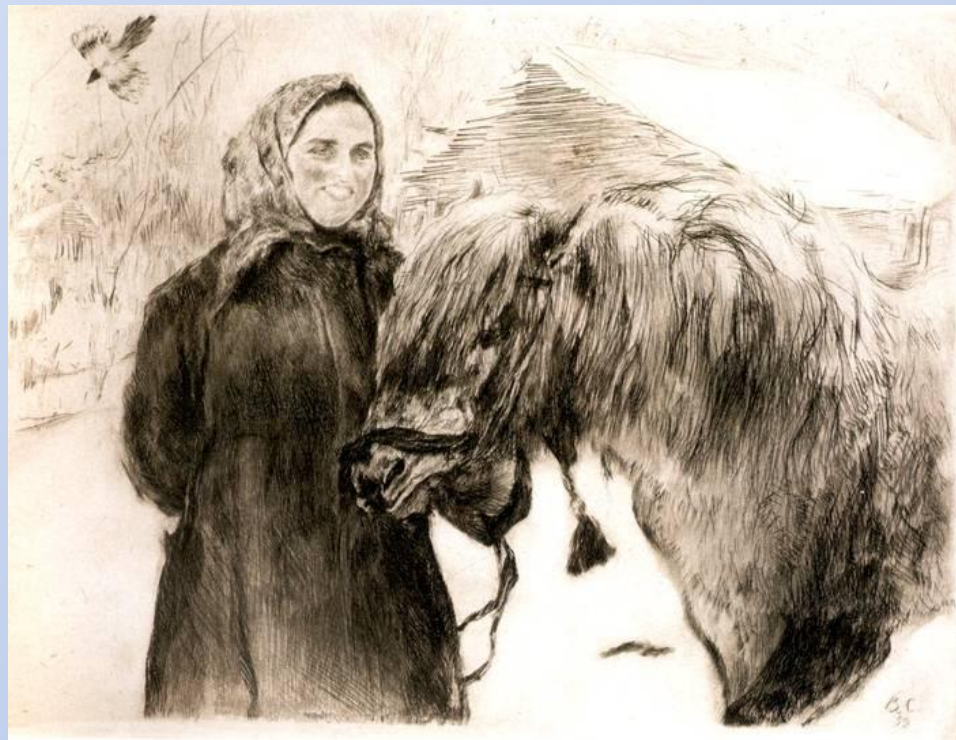
В. А. Серов. Баба с лошадью

Чувством проникновенной любви к родине полны пейзажи художника и произведения, посвященные русской деревне.