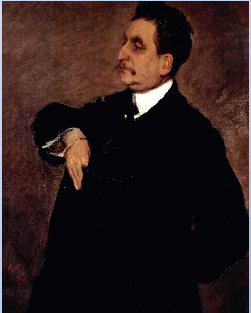
В. А. Серов. Портрет В. Гиршмана

Портрет воспринимается почти как социальная сатира.