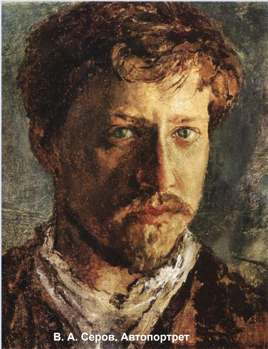
В. А. Серов. Автопортрет

В русском искусстве конца XIX – начала XX века Валентин Александрович Серов является одной из центральных фигур. Человек безупречного вкуса, кристальной честности и прямоты, требовательный к себе и другим, великий труженик, Серов прожил короткую, но исключительную по яркости творческих достижений жизнь.