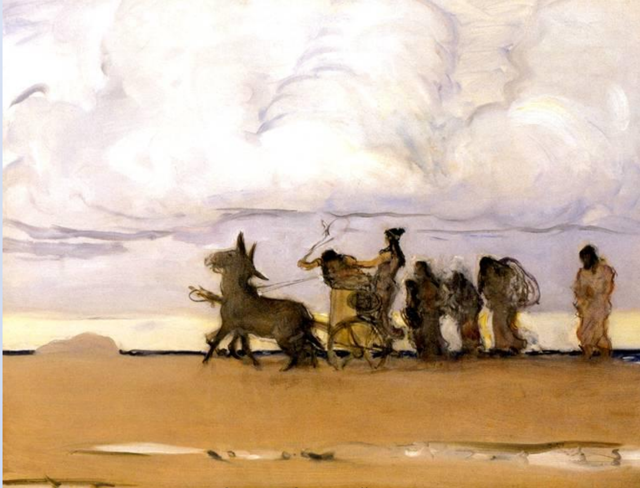
В. А. Серов. Одиссей и Навзикая

Картины античного цикла – последнее специфическое новшество, которым завершается творческий путь художника, как бы точка в его творческой эволюции.