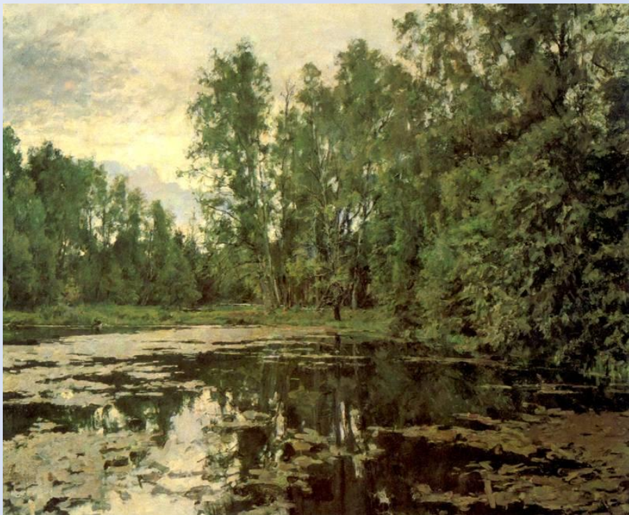
В. А. Серов. Заросший пруд. Домотканово