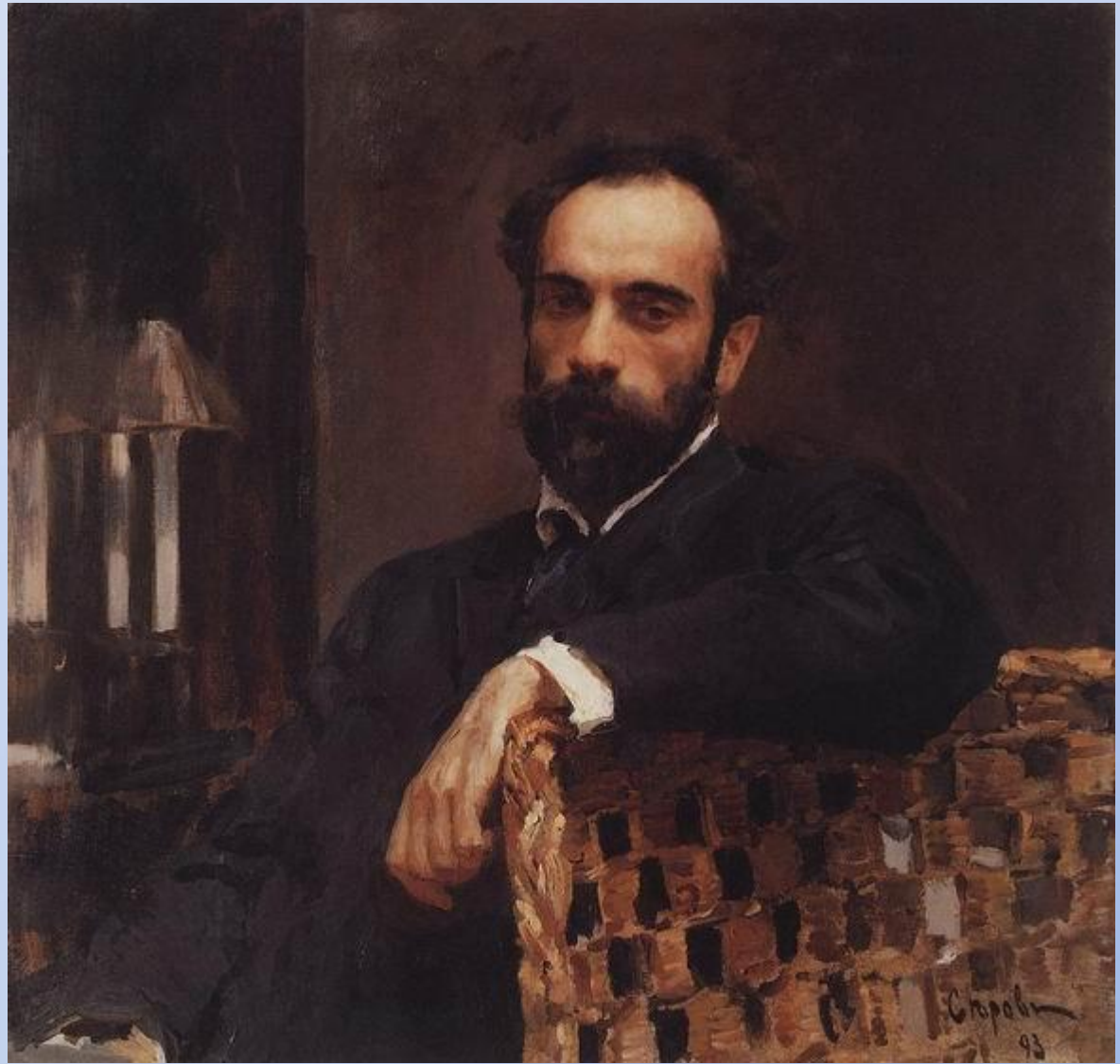
В. А. Серов. Портрет И. Левитана

Совершенно другим Серов изобразил на портрете Исаака Левитана, который не позирует – просто погружен в свои невеселые думы. Колорит картины скуп. Интерьер беден до аскетизма. Главное, на чем сосредоточил художник свое внимание, - состояние души Левитана. Внимание привлекает задумчивый, глубокий взгляд темных глаз, в которых, кажется, сосредоточена вся мировая скорбь.