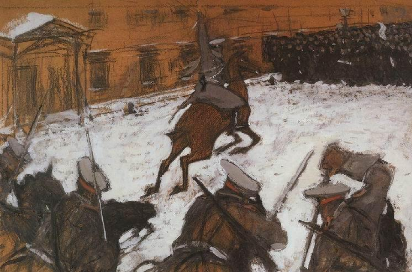
В. А. Серов. Солдатушки, бравы ребятушки, где же ваша слава?

Галерея созданных Серовым образов поражает точностью и остротой характеристик, пластическим соответствием натуре. Серов умел запечатлеть психологию человека и социальные корни явлений жизни.