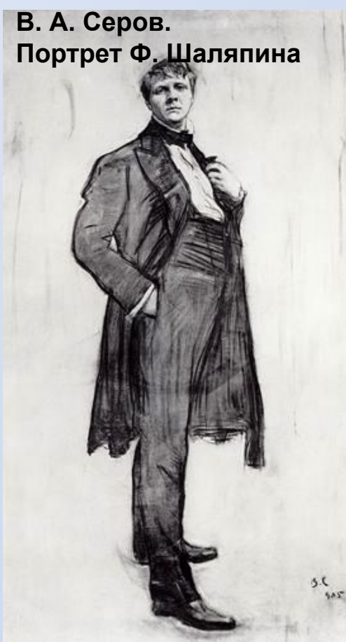
В. А. Серов. Портрет Ф. Шаляпина