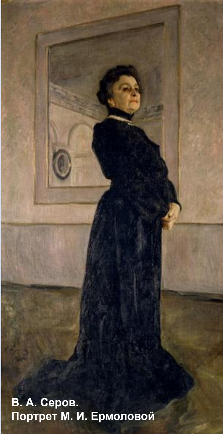
В. А. Серов. Портрет М. И. Ермоловой

Портрет великой актрисы М. И. Ермоловой стал кульминацией в серии портретов революционной эпохи.