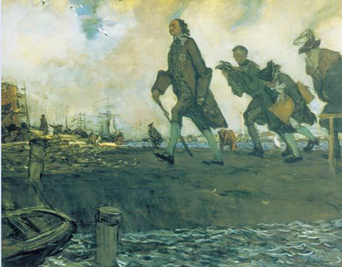
В. А. Серов. Петр I

В истории России Серову особенно интересно петровское время. В картине «Петр I» небольшой по размерам, фигура Петра монументально значительна. Свинцово – серая гамма красок, динамичный строй всего произведения передают энергию созидания суровой и великой для России эпохи.