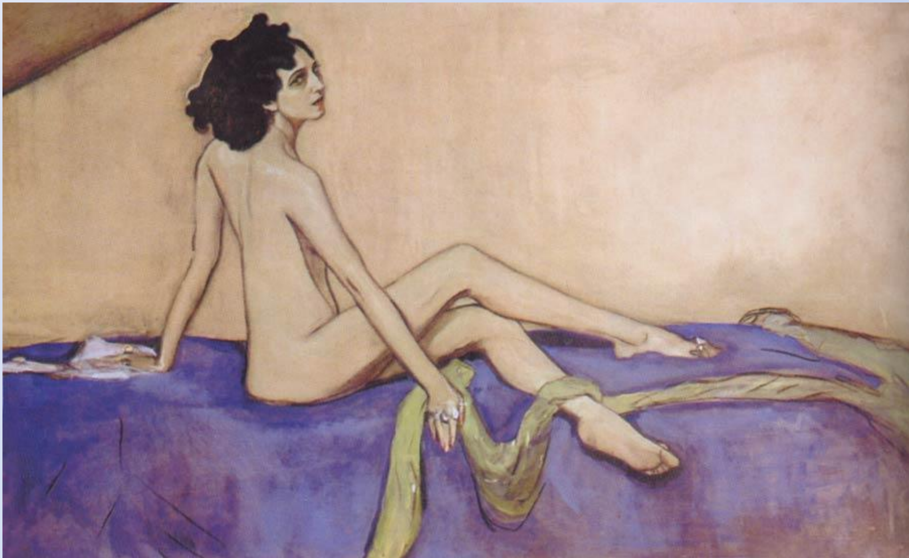
В. А. Серов. Портрет Иды Рубенштейн

Сочетанием графических и живописных средств достигнута выразительность портрета известной танцовщицы Иды Рубинштейн.