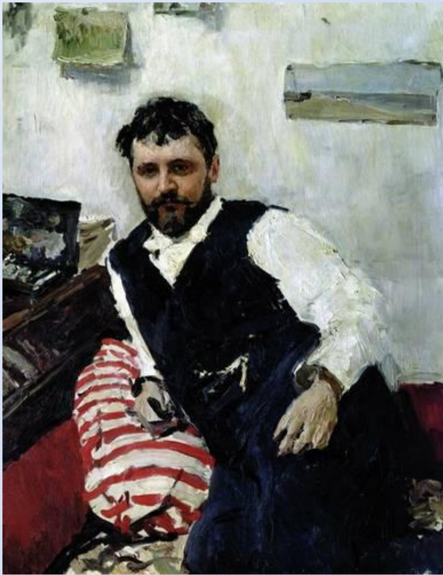
В. А. Серов. Портрет К. Коровина

Константин Коровин – друг Серова. Он хорошо знал художника и любил его. Это был человек широкой натуры, общительный, веселый, доступный.