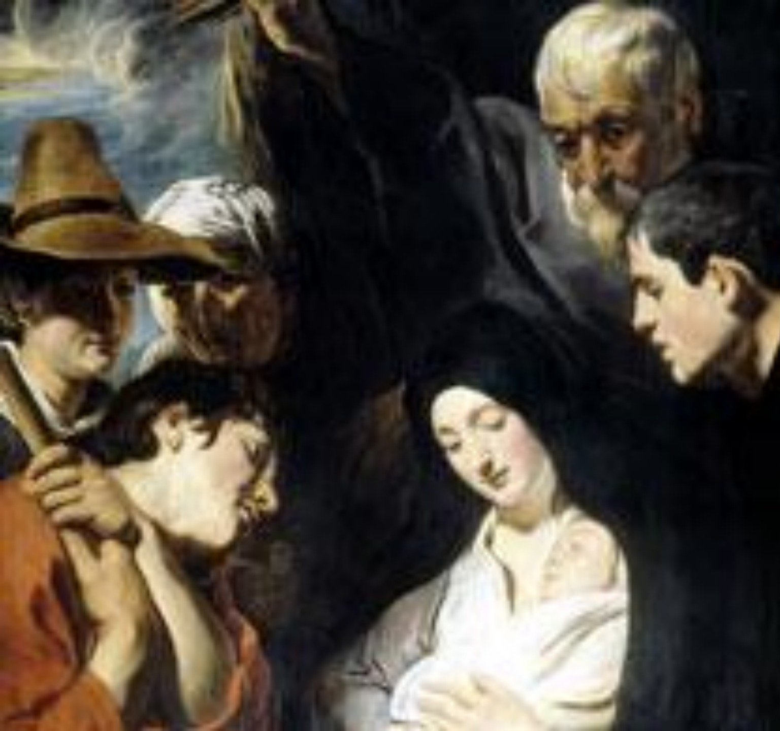
Поклонение пастухов 1615, Маурицхейс , Гаага