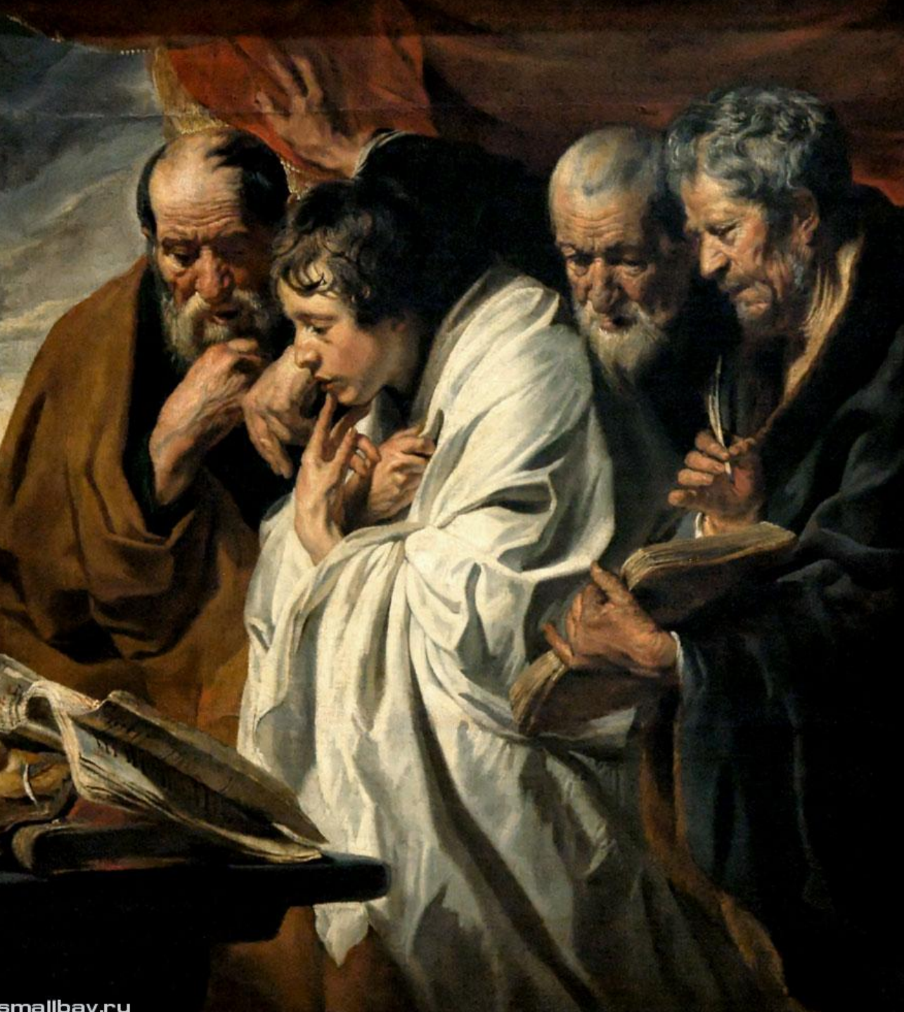
Четыре евангелиста 1622-1625, Музей Лувр, Париж