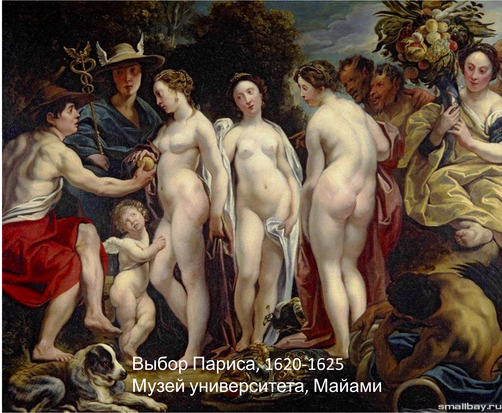
Выбор Париса, 1620-1625 Музей университета, Майами