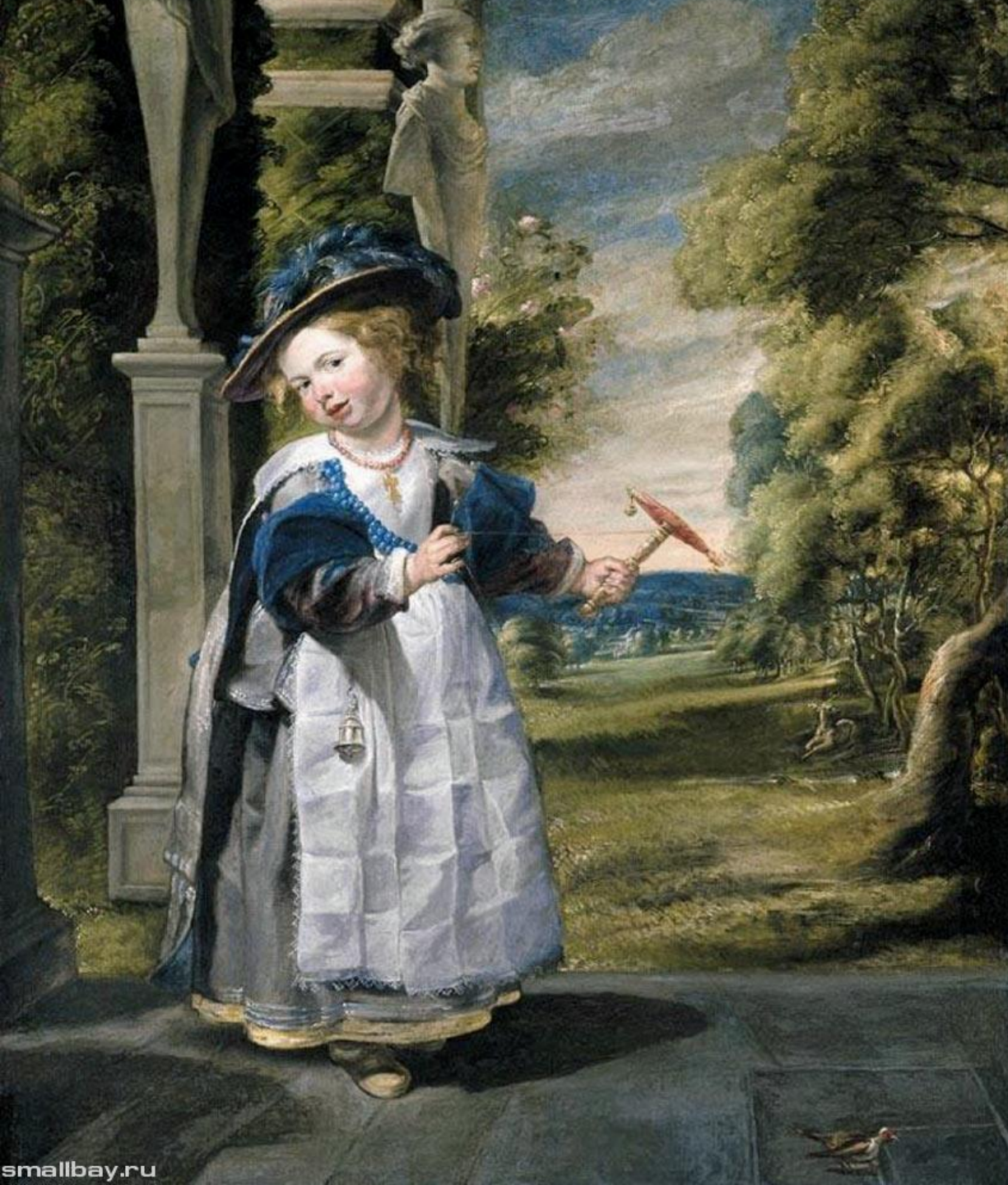
Портрет дочери художника, 1635