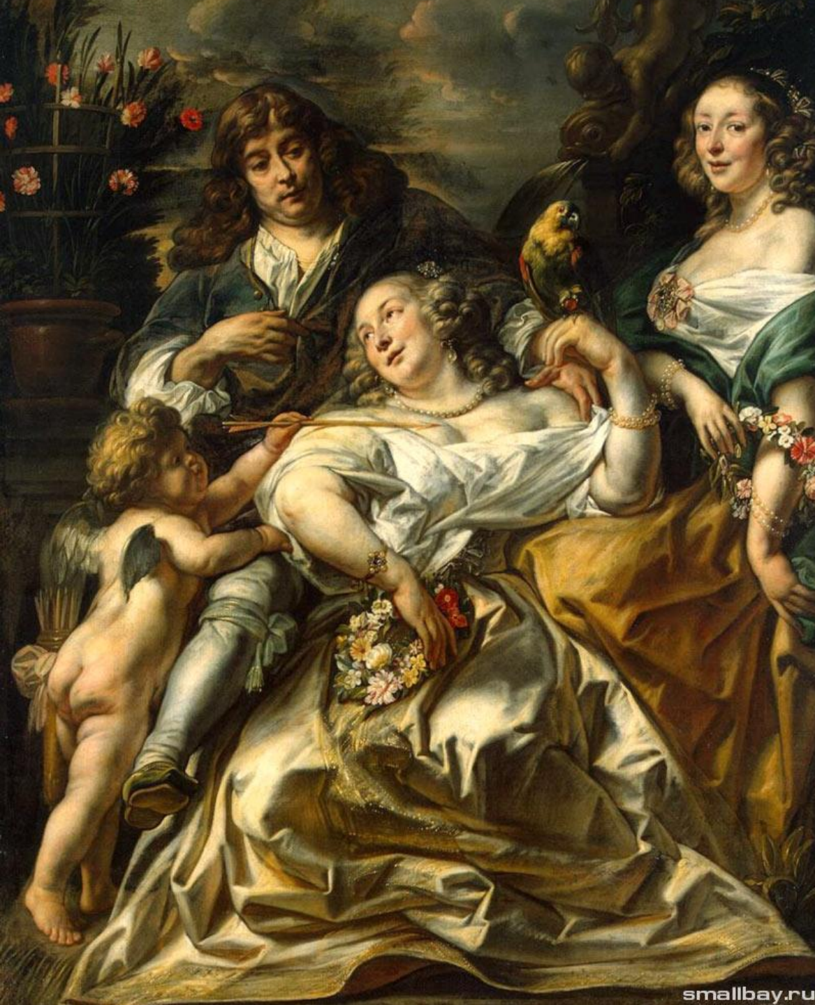
Семейный портрет 1650-1652. Эрмитаж, Санкт- Петербург.