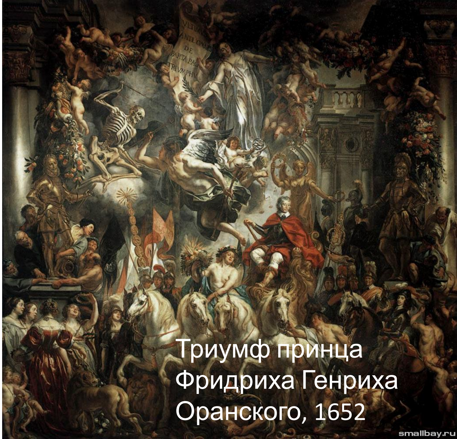
Триумф принца Фридриха Генриха Оранского, 1652