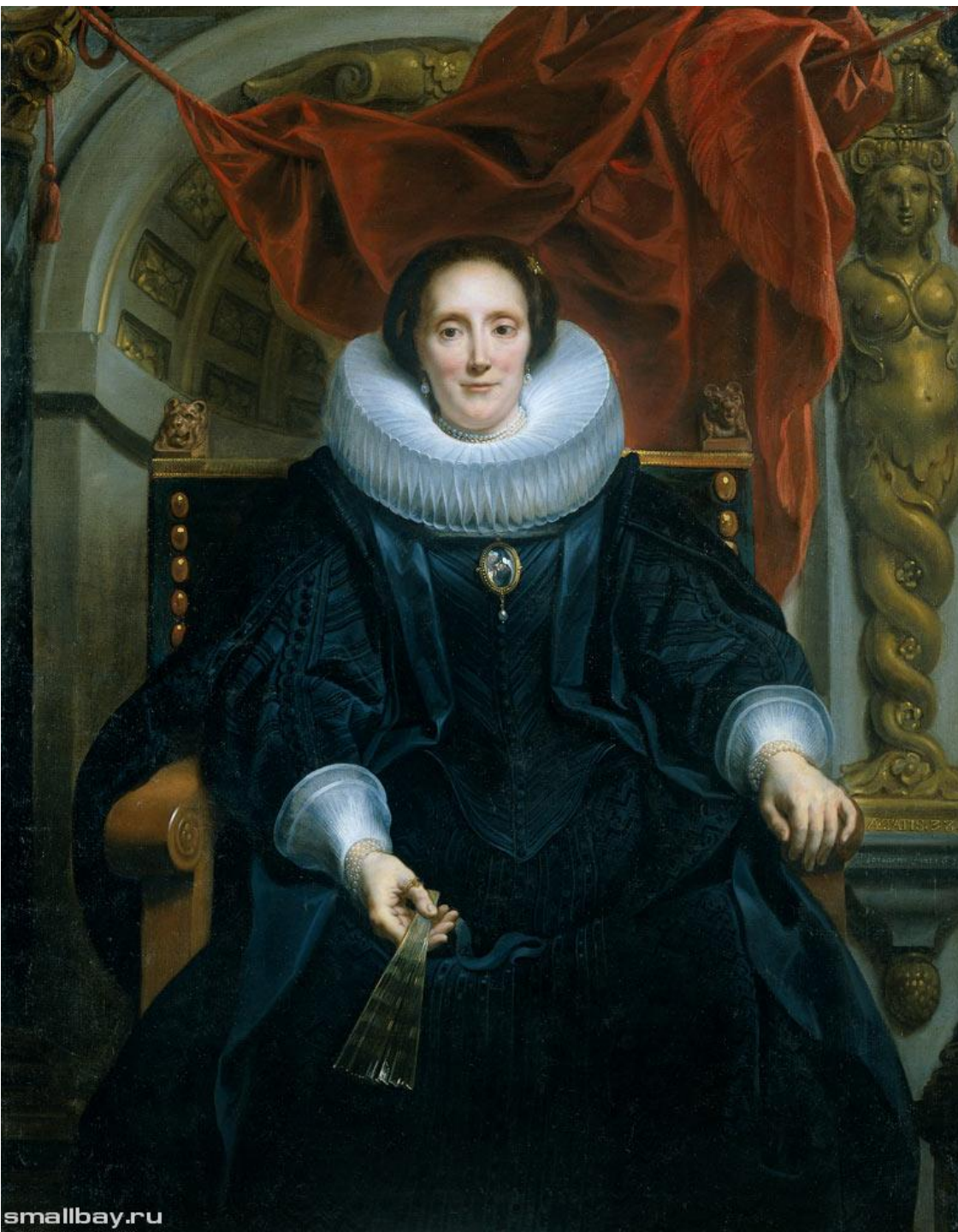
Портрет Катарины Бехагель, 1635