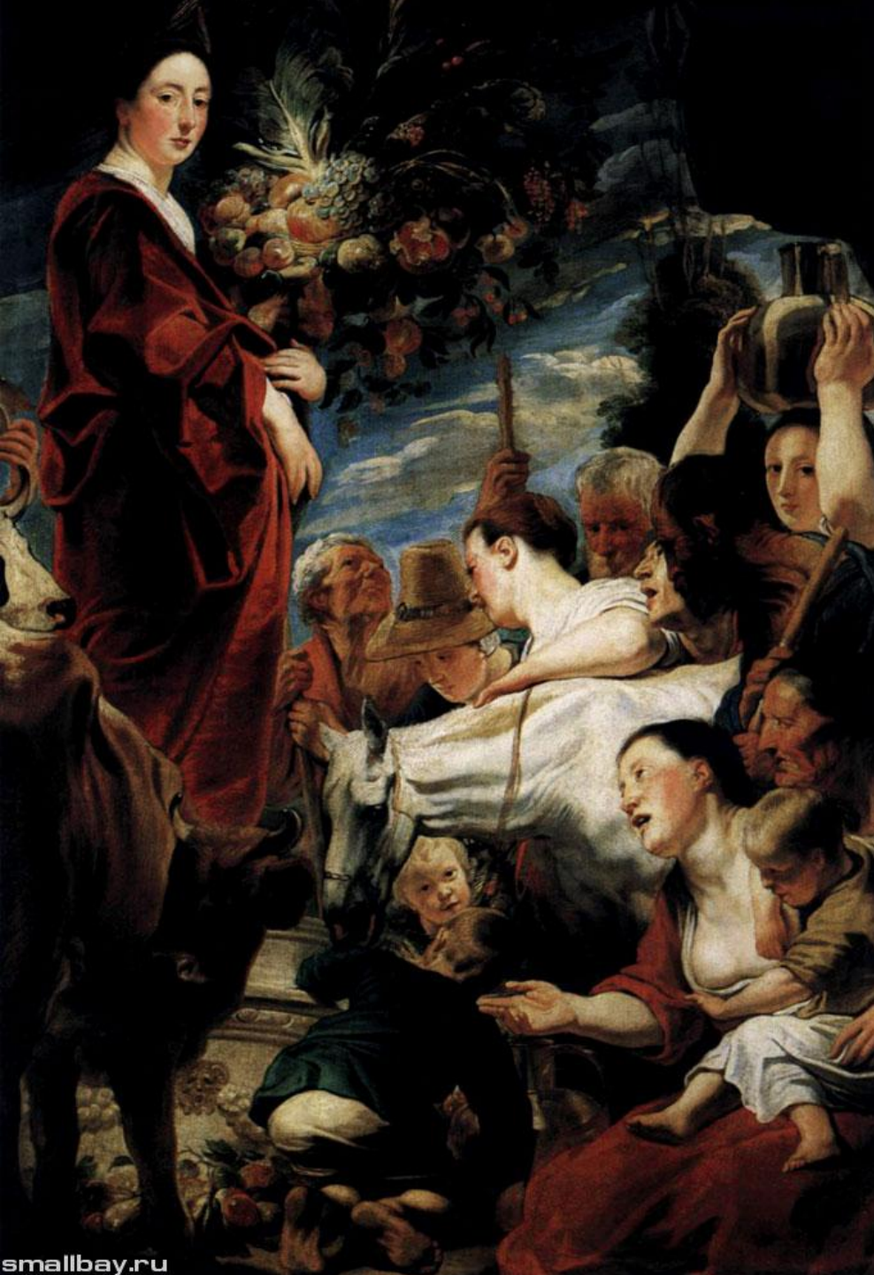
Подношение Церере, богине урожая 1618-1620, Музей Прадо, Мадрид