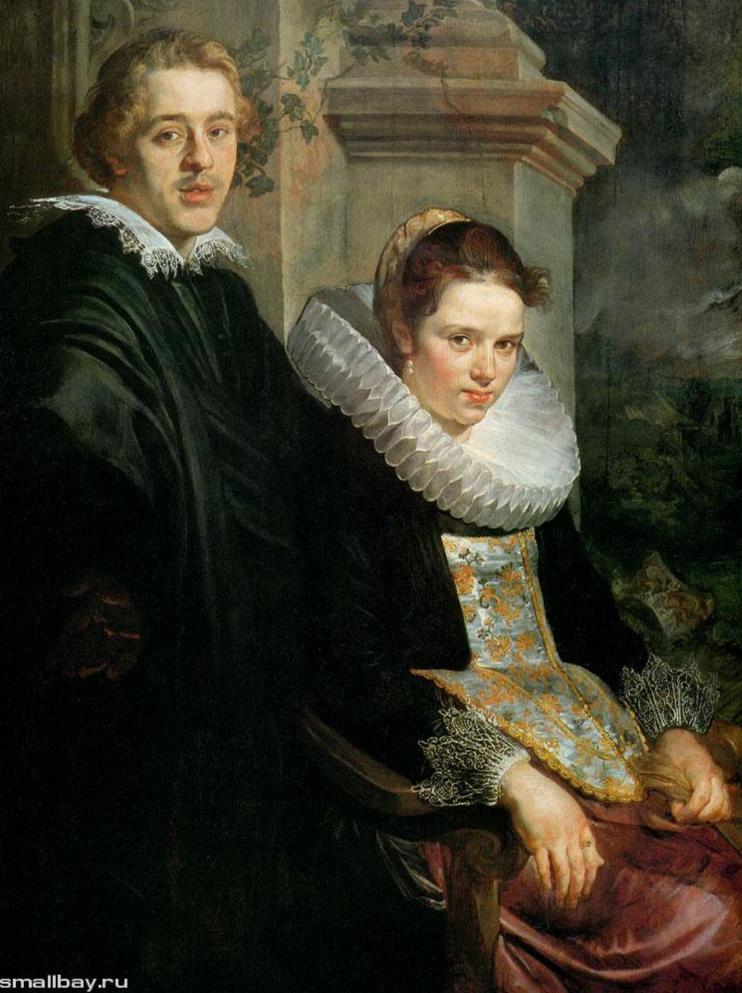
Портрет МОЛОДЫХ супругов, 1620