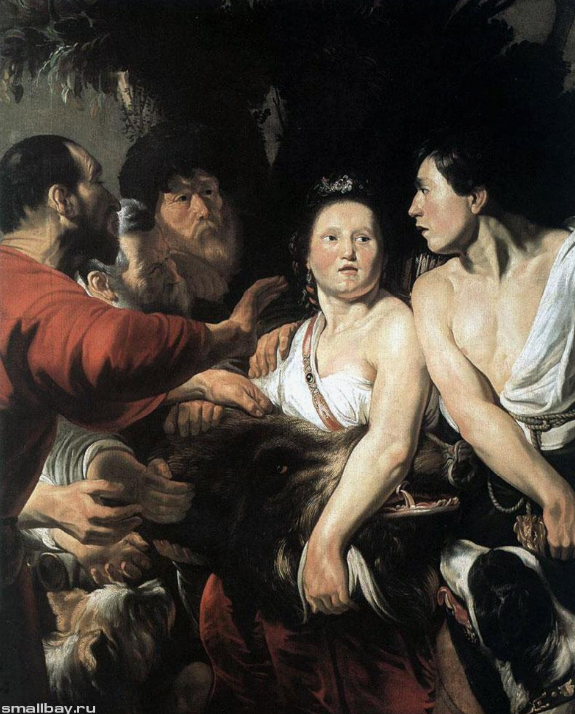
Мелеагр и Аталанта, 1618 Музей изящных искусств, Антверпен