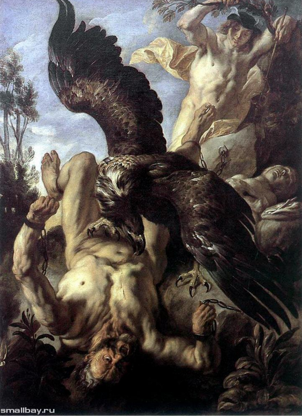
Орел, терзающий Прометея, 1640