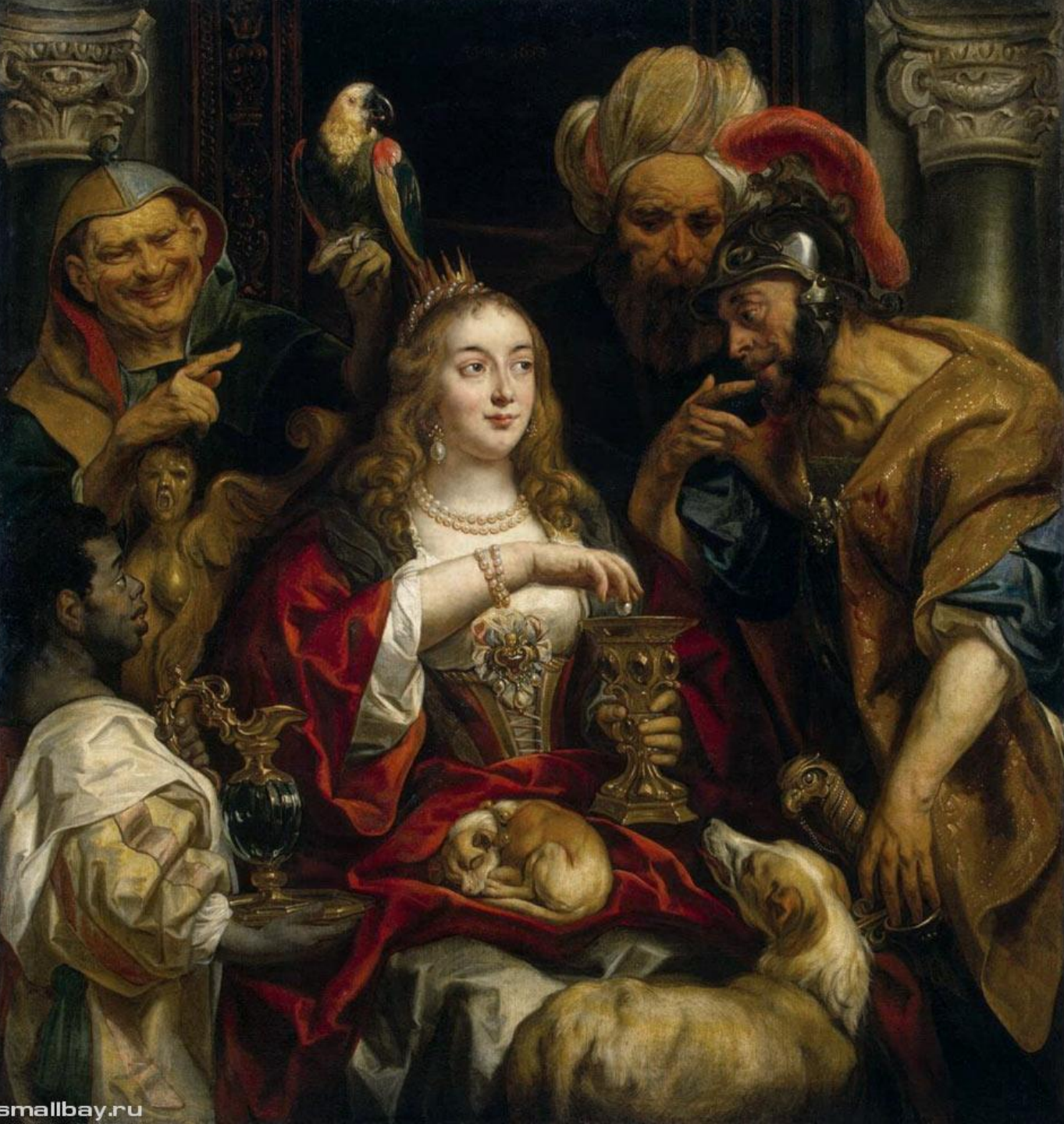
Пир Клеопатр ы 1653