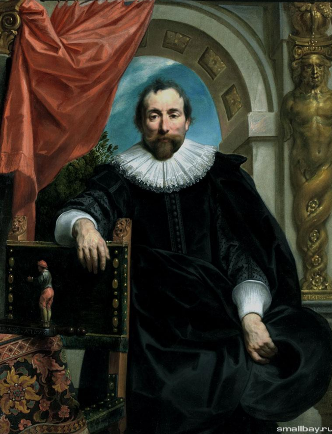
Портрет Рутгера Ле Уитера, 1635