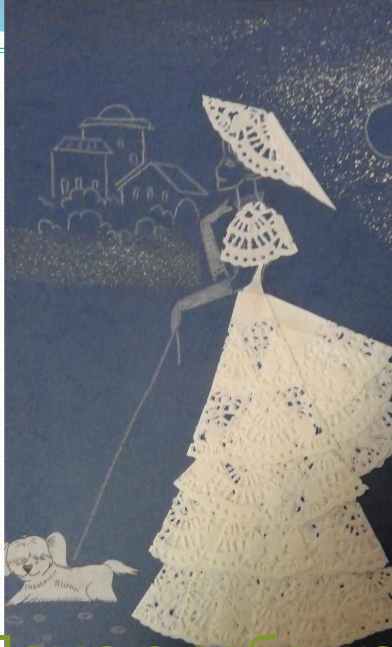
Дама с собачкой