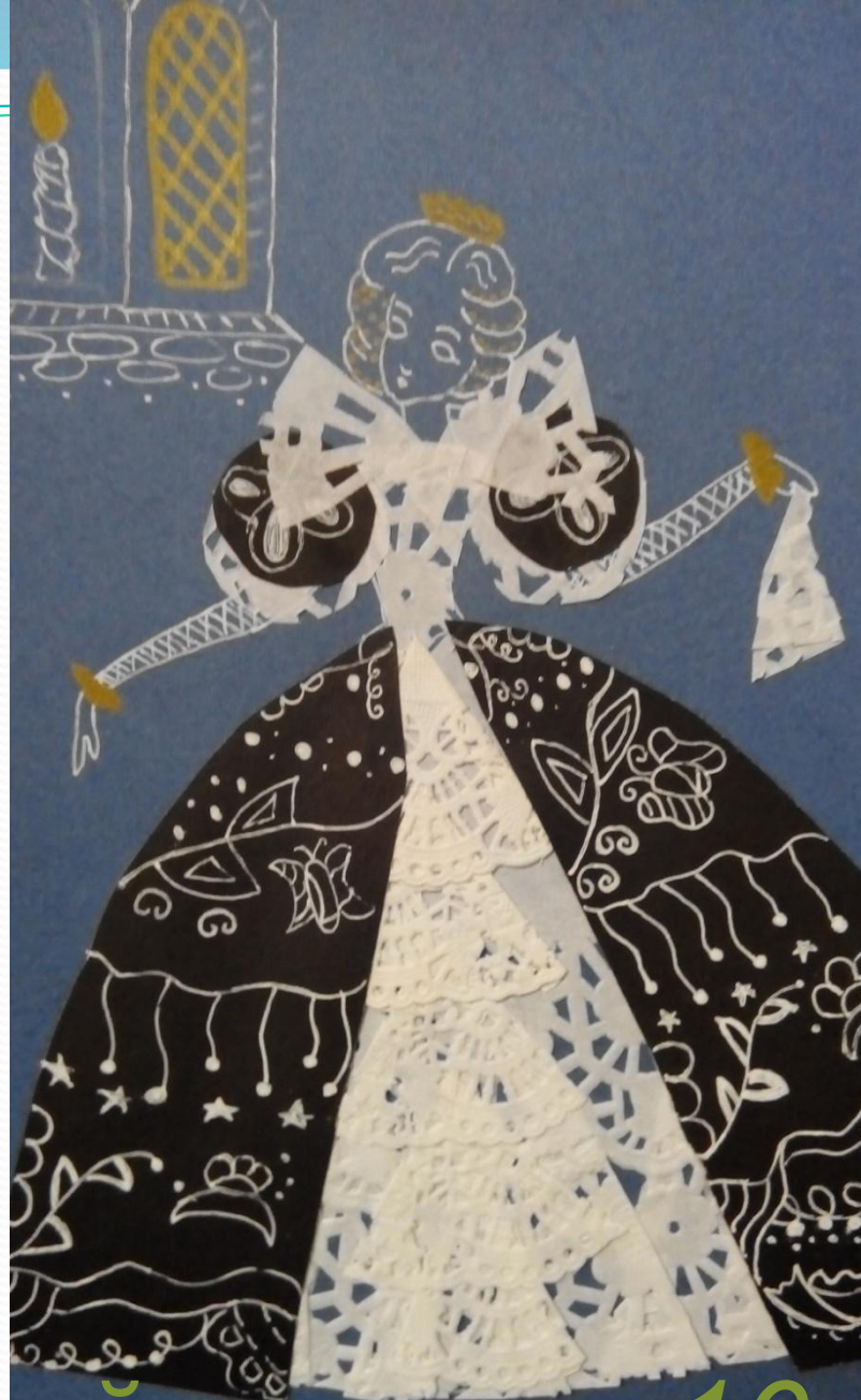
Испанский костюм 16-17 веков