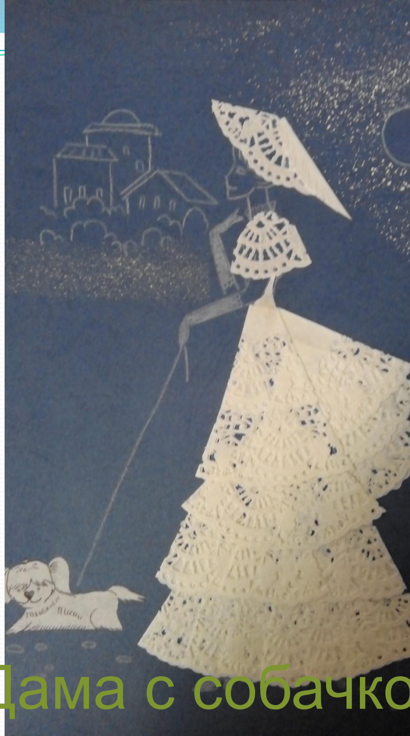
Дама с собачкой