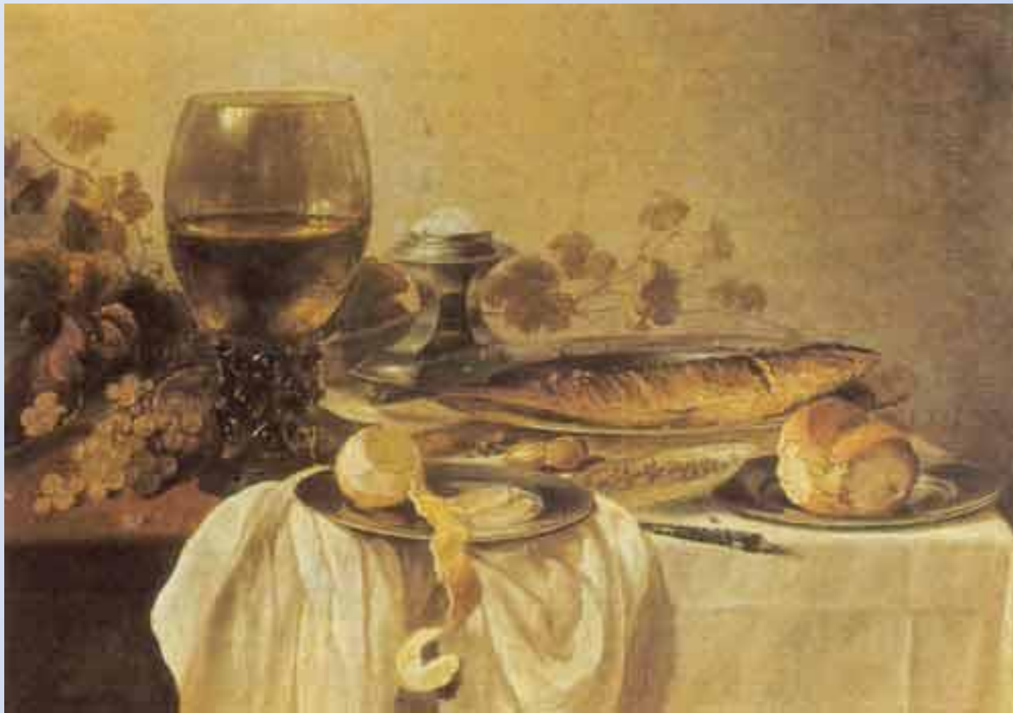
Питер Клас (1597/98-1661) Голландская школа Завтрак.