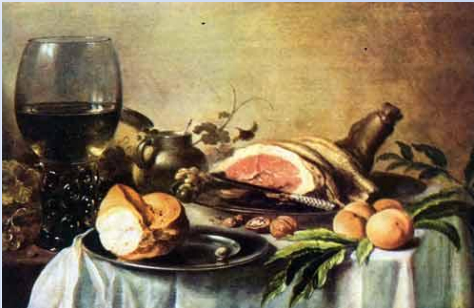
Питер Клас (1597/98-1661) Голландская школа Завтрак.