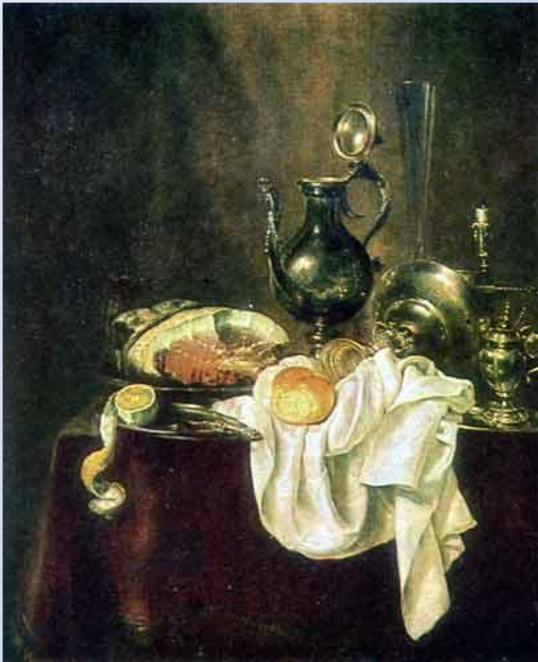
Виллем Клас Хеда. 1594 - 1680 Голландская школа. Ветчина и серебряная посуда.