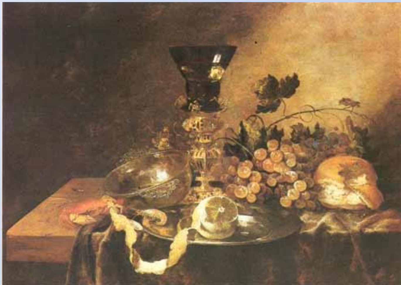
Абрахам ван Бейерен (1620/1621 - 1690). Натюрморт с крабом.