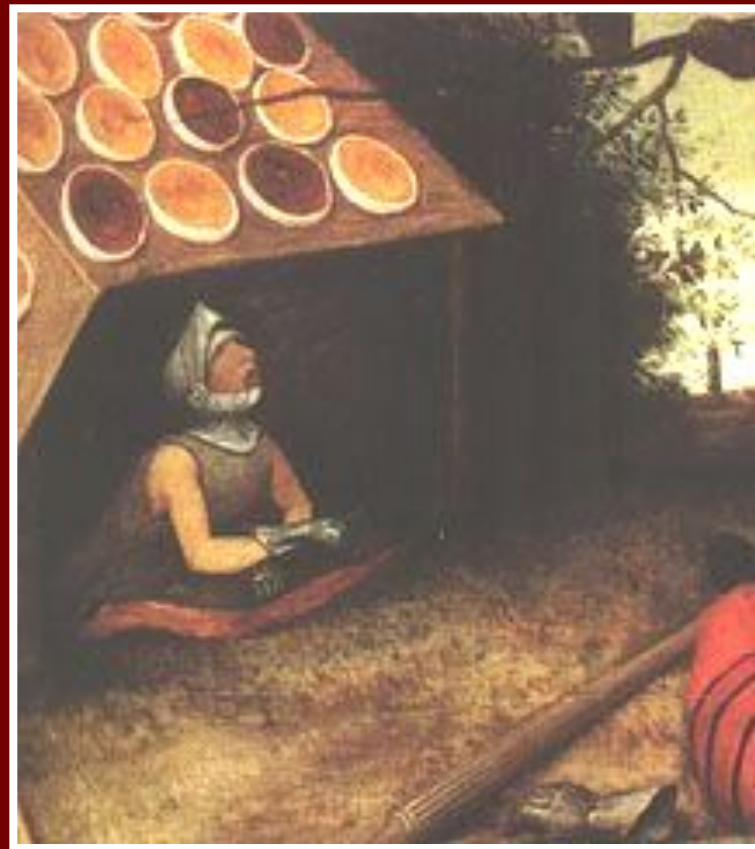
Шалаш с крышей, крытой пирогами