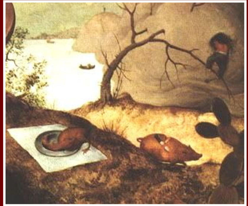
Гора каши и жареный поросенок

■ Чтобы попасть в страну лентяев, нужно было проесть проход в горе из каши, изображенной на картине в правом верхнем углу. Попавший в неё сразу замечает жареного поросёнка, бегающего с ножом в спине, плетень из колбасы, покрытую пирогами крышу шалаша и бесчисленное множество других лакомств. На пороге шалаша лежит с открытым ртом человек, только что