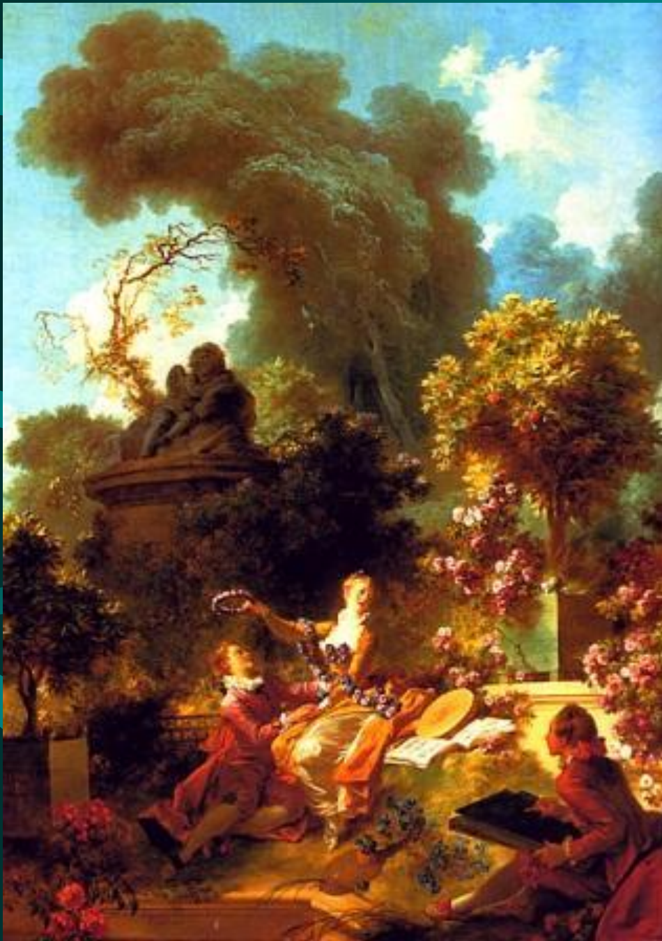
Фрагонар. Коронованный любовник.