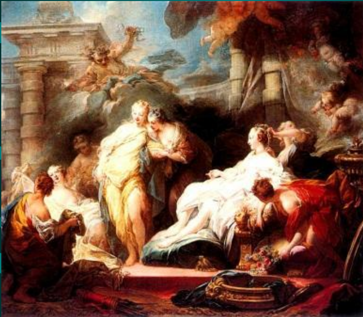
Фрагонар. Психея показывает сестрам дары Амура.