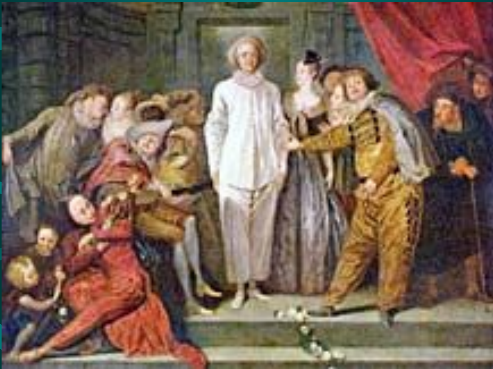
Антуан Ватто. Итальянские комедианты.