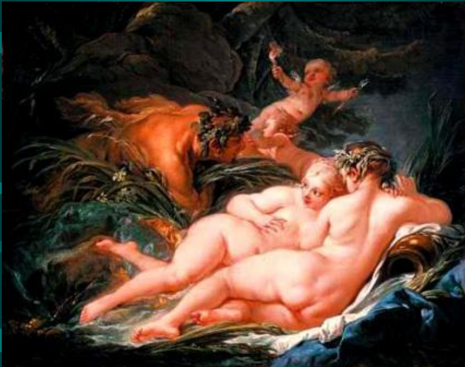
Франсуа Буше. Пан и Сиринга.