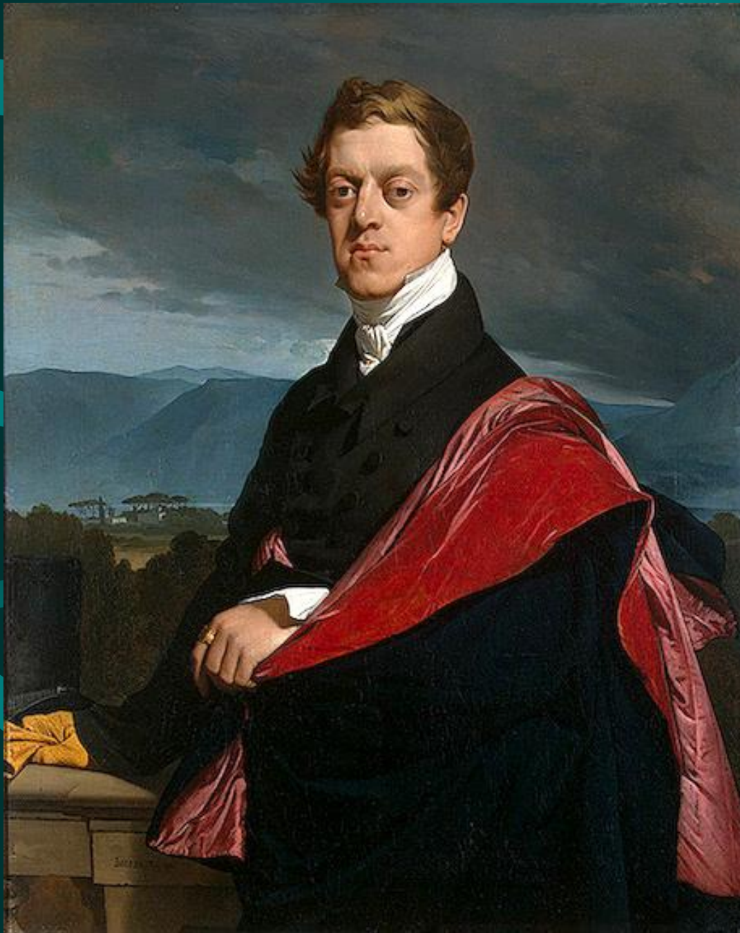
Энгр. Портрет графа Гурьева. 1821 год. Масло, холст. Эрмитаж, Петербург