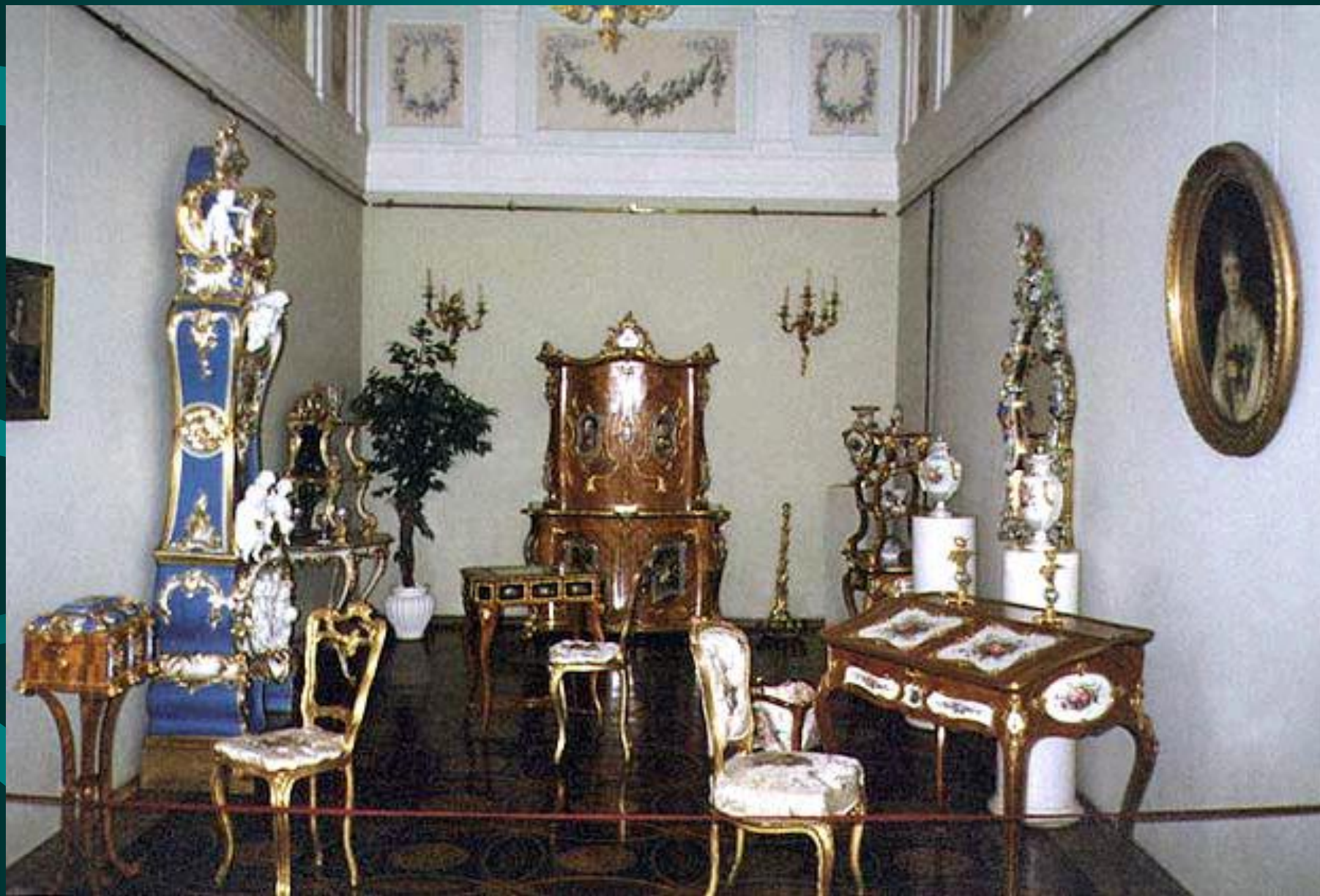
Мебель в стиле рококо