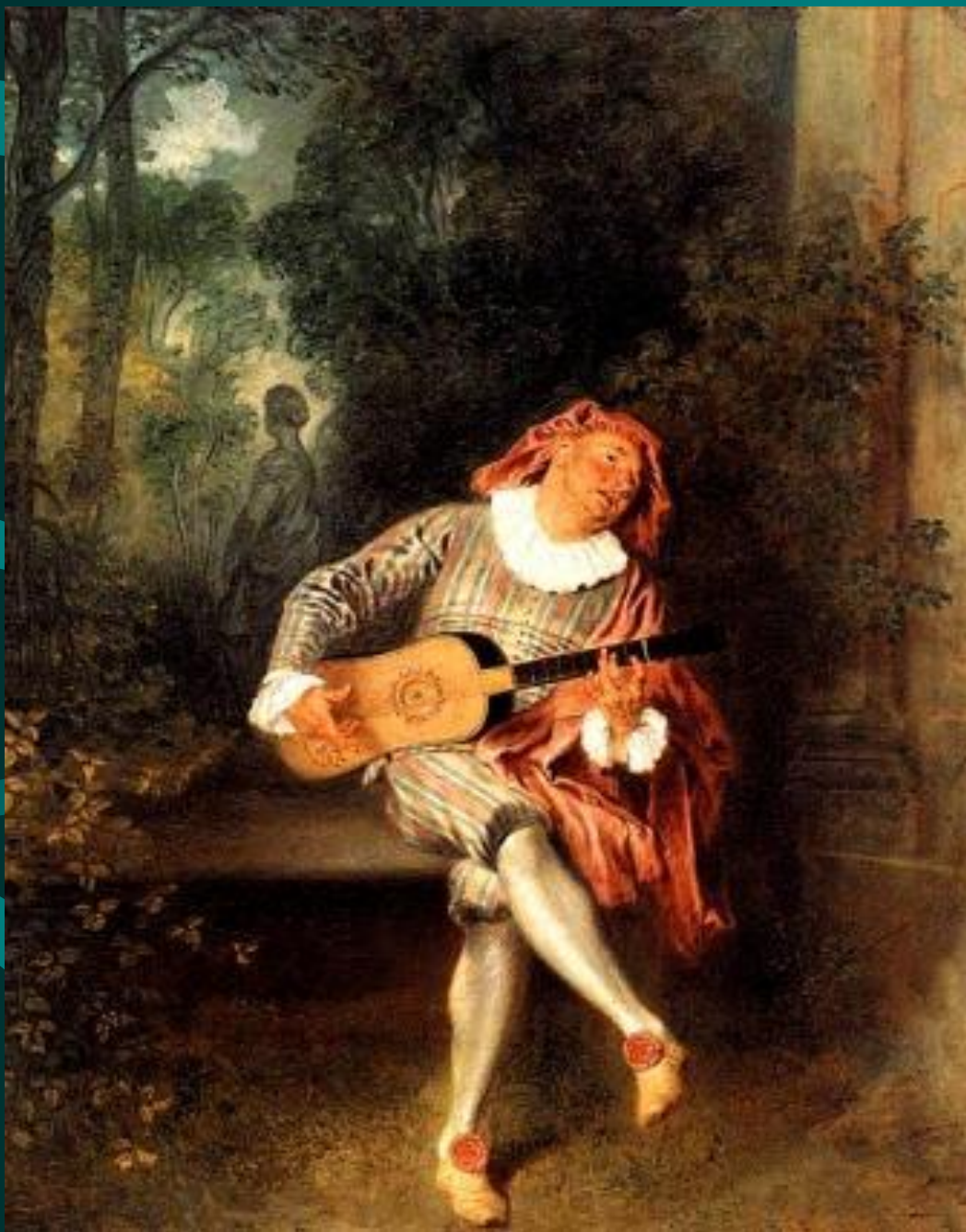
Антуан Ватто. Меццетен. 1717-1719 гг. Метрополитен- музей. Нью-Йорк.