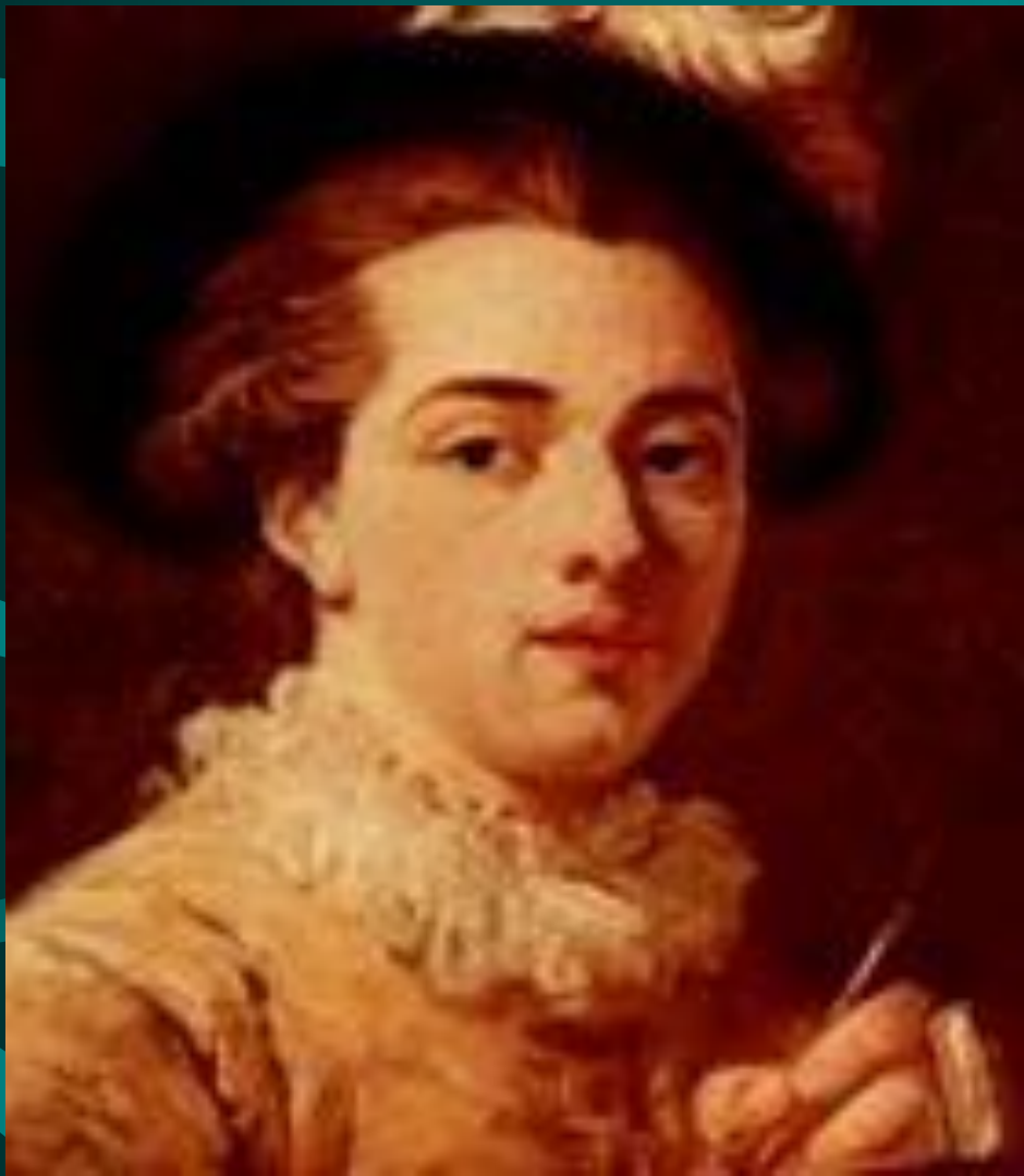
ФРАГОНАР Жан Оноре

ФРАГОНАР Жан Оноре французский живописец и гравёр, крупнейший мастер эпохи Людовика XVI. прославился виртуозно исполненными галантными и бытовыми сценами, в которых изящество рококо сочетается с верностью натуре, тонкостью световоздушных эффектов, величественных античных руин. Наряду с произведениями, созданными на основе реальных наблюдений, он создает и пасторали — импровизируя, он воспроизводит сцену с такой живостью, что она кажется написанной с натуры.