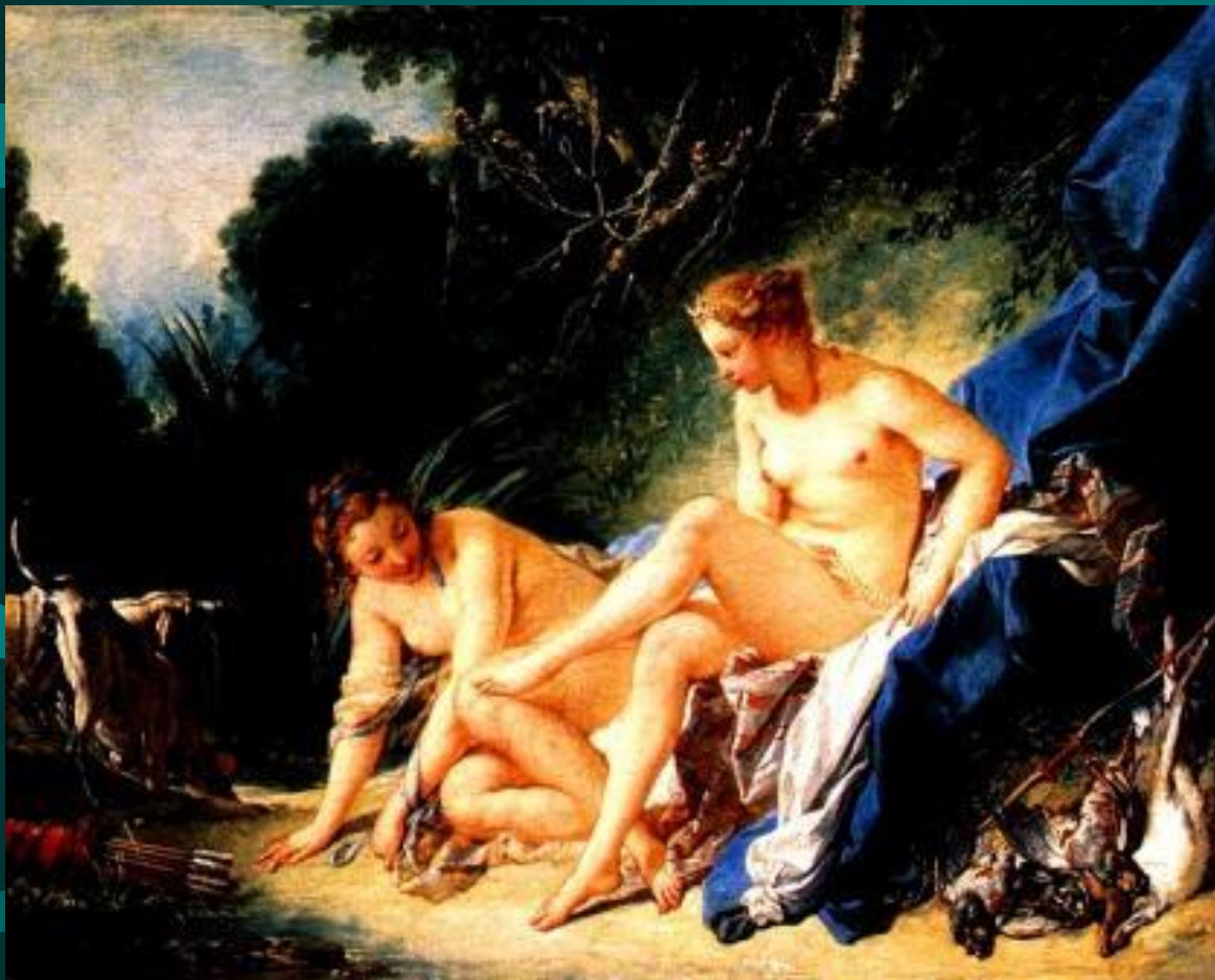
Франсуа Буше. Купание Дианы. . 1742 год. Лувр. Париж.