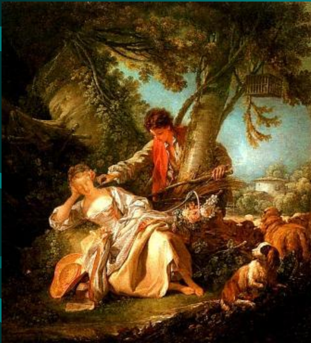
Франсуа Буше. Прерванный сон.

В истории живописи Франсуа Буше по-прежнему остается великолепным мастером колорита и изысканного рисунка. Остроумные решенные композиции, необычные ракурсы героев, причудливые силуэты почти театральных декораций, сочные цветовые акценты, яркие блики прозрачных красок, нанесенных мелкими, легкими мазками, плавные струящиеся ритмы – все это делает Ф.Буше непревзойденным мастером живописи. Его картины превращаются в декоративные панно, украшают пышные интерьеры залов и гостиных, они зовут в мир счастья, любви и прекрасных грез.