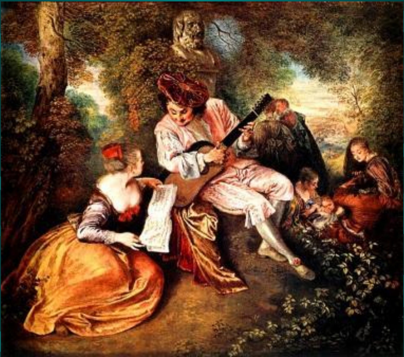
Антуан Ватто. Гамма любви.