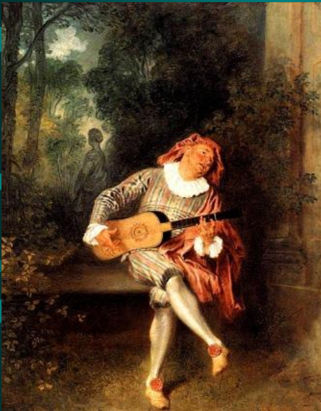
Антуан Ватто. Меццетен. 1717-1719 гг. Метрополитен- музей. Нью-Йорк.