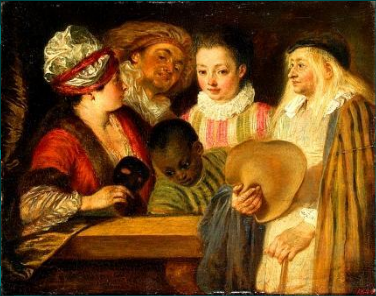
Антуан Ватто. Актеры французского театра.