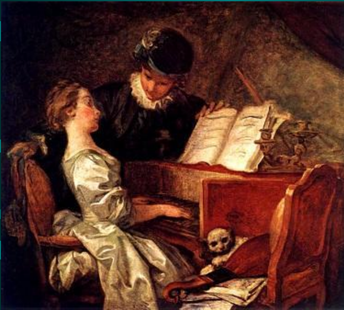
Фрагонар. Урок музыки