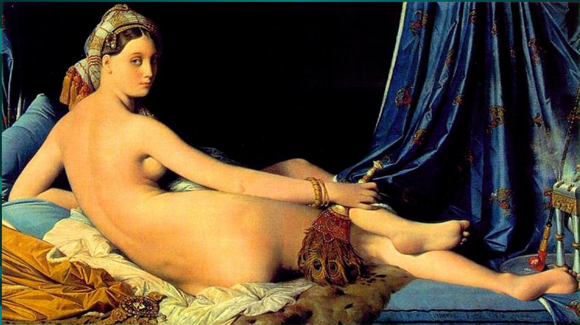
Энгр. Большая одалиска. 1814 год. Масло, холст. Лувр, Париж.