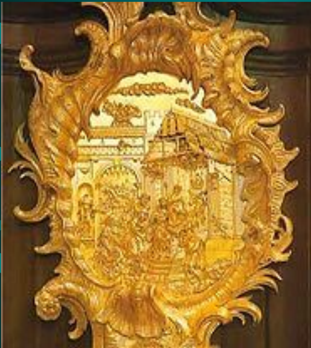
Мебель в стиле рококо. Зимний дворец, Санкт- Петербург.