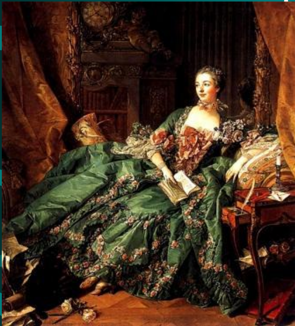
Франсуа Буше. Госпожа де Помпадур. 1756 г. Старая Пинотека, Мюнхен.

.Кисти художника принадлежит ряд портретов фаворитки короля Людовика XV маркизы де Помпадур. Известно, что она покровительствовала Буше, не раз заказывала ему картины на религиозные сюжеты для загородных резиденций и парижских особняков. В картине «Госпожа де Помпадур» героиня представлена в окружении разбросанных цветов и роскошных предметов, напоминающих о ее художественных вкусах и увлечениях. Она царственно возлежит на фоне пышных, торжественных драпировок. Книга в ее руке – явный намек на просвещенность и приверженность интеллектуальным занятиям. Маркиза щедро отблагодарила художника. Назначив его директором Гобеленовой мануфактуры, а затем присвоила ему титул «первого живописца короля».