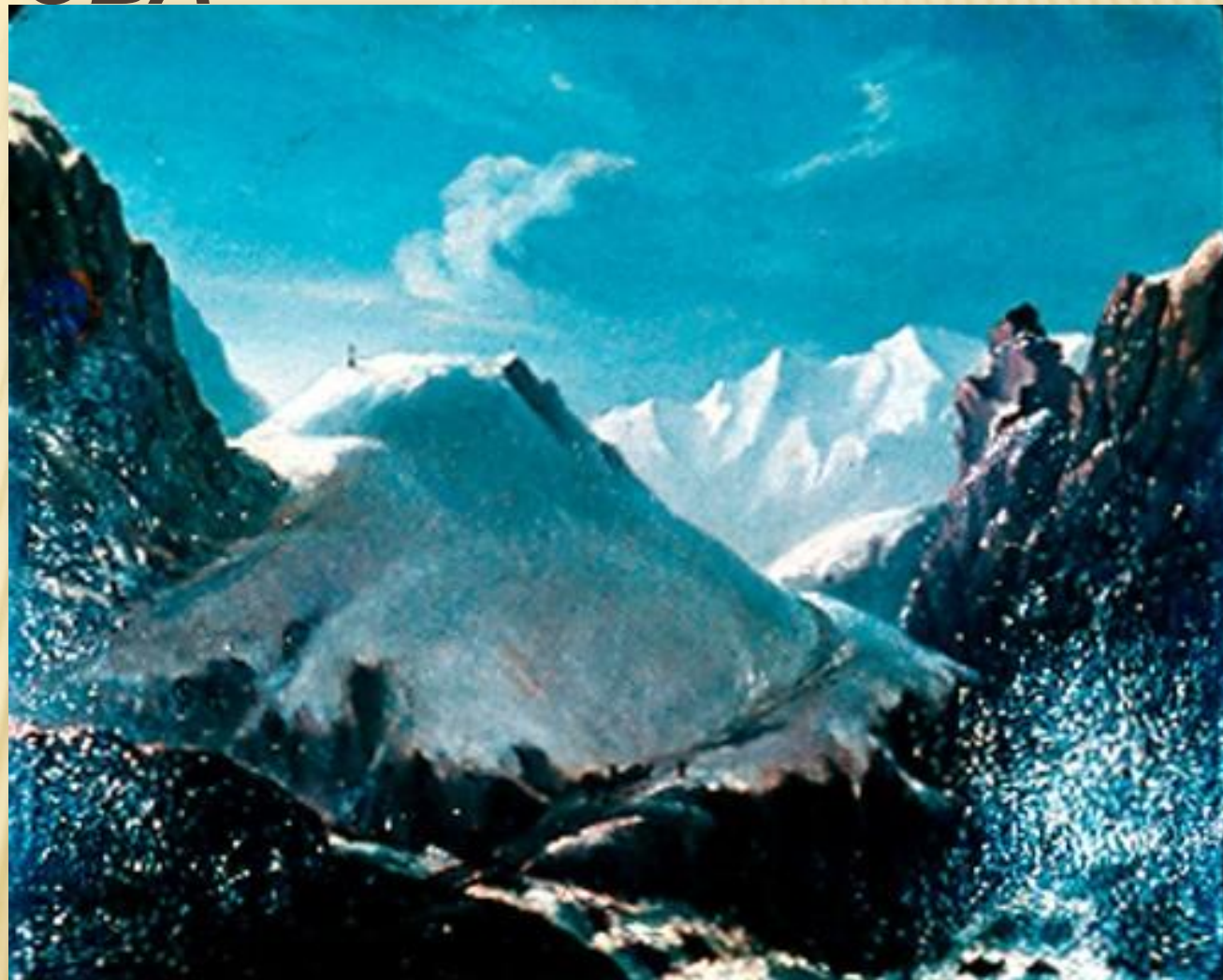
Крестовый перевал. Масло. 1837-1838.

□ Картина "Крестовый перевал", отличающаяся мастерством композиции и умелой передачей перспективы, свидетельствует о зрелом живописном мастерстве Лермонтова.