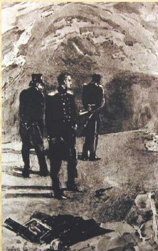
Дуэль. Иллюстрация М. А. Врубеля. Чёрная акварель. 1890-1891.