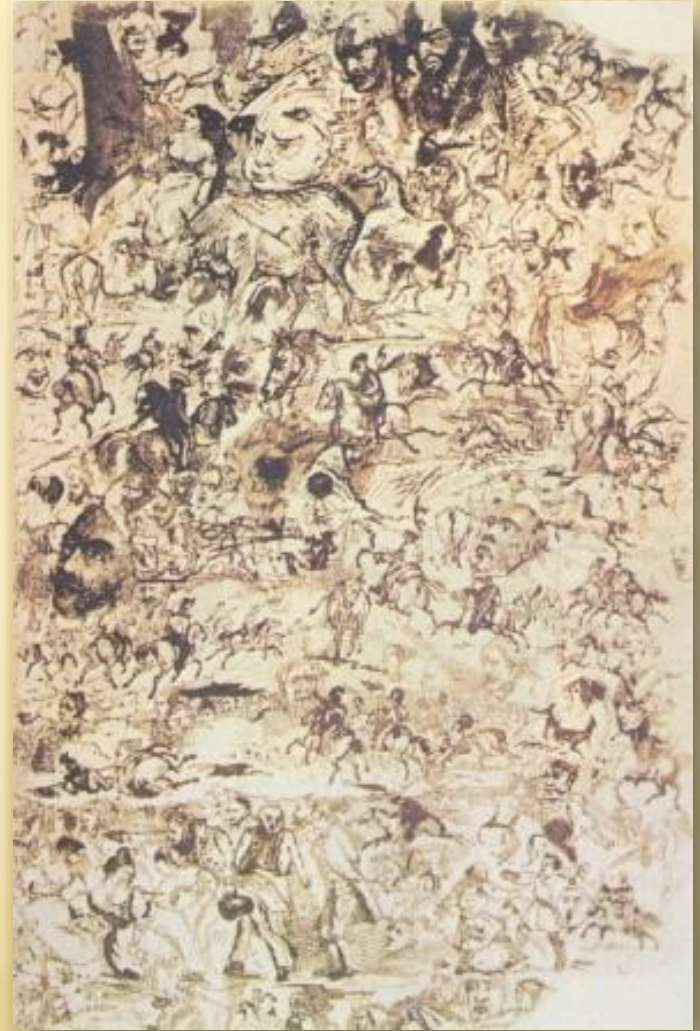
Рисунки М.Ю. Лермонтова на обложке рукописи «Вадима». 1832-1834.