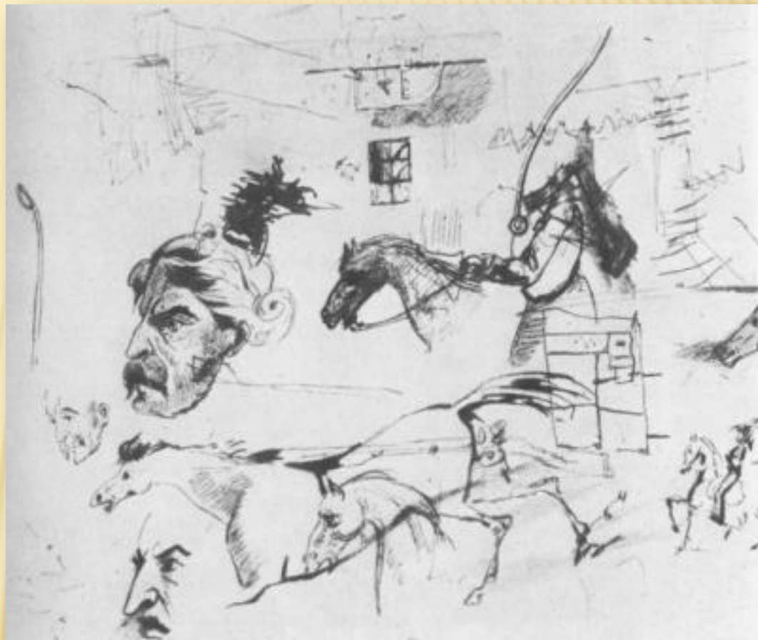
Наброски М.Ю.Лермонтова за шахматной игрой

□ Пока партнёр размышлял, Лермонтов на подвернувшемся листке бумаги быстро набрасывал строчки стихов, планы новых произведений. Рисовал человеческие