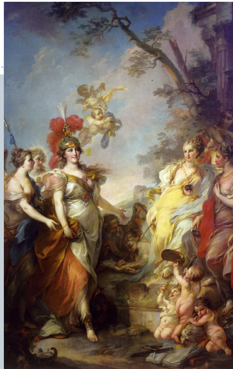
императрица в облике Минервы

В 1787 году художник написал две аллегорические картины. На одной изображена Екатерина II засевающая поле, и Петр I в облике землепашца, а на другой — императрица в облике Минервы в окружении мудрецов Древней Греции. Картины понравились императрице, это и открыло Боровиковскому дорогу в Петербург.