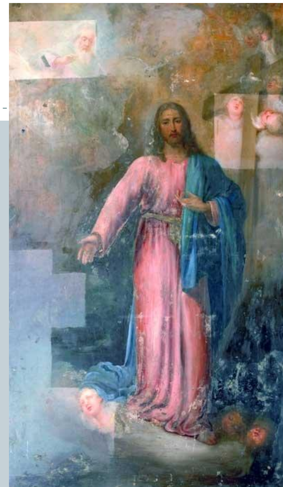
Христос в окружении ангелов