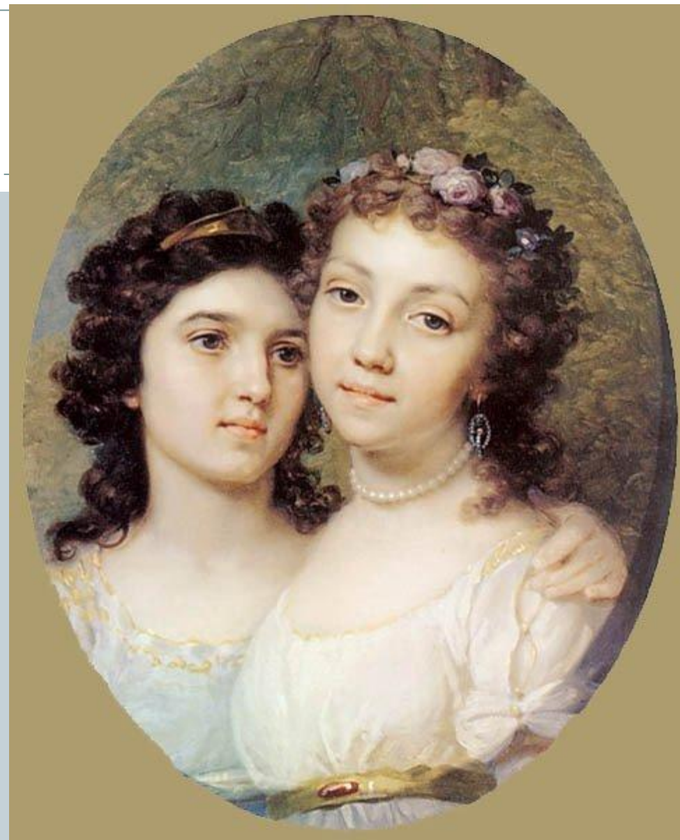
Лизонька и Дашенька

6 апреля 1825 года В. Л. Боровиковский внезапно ушел из жизни тончайший поэт сентиментального женского образа. Он скончался от разрыва сердца. Похоронен на Смоленском кладбище.