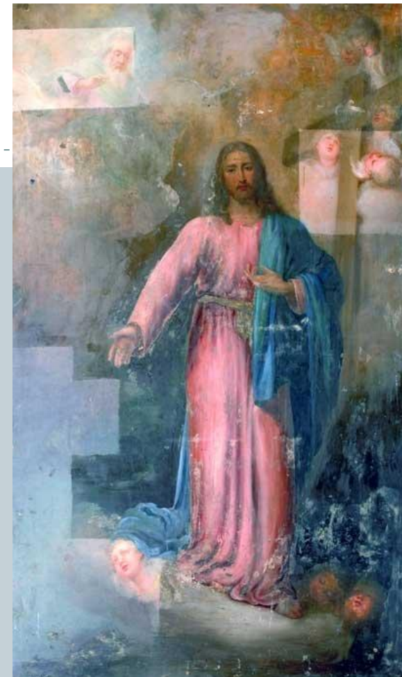
Христос в окружении ангелов