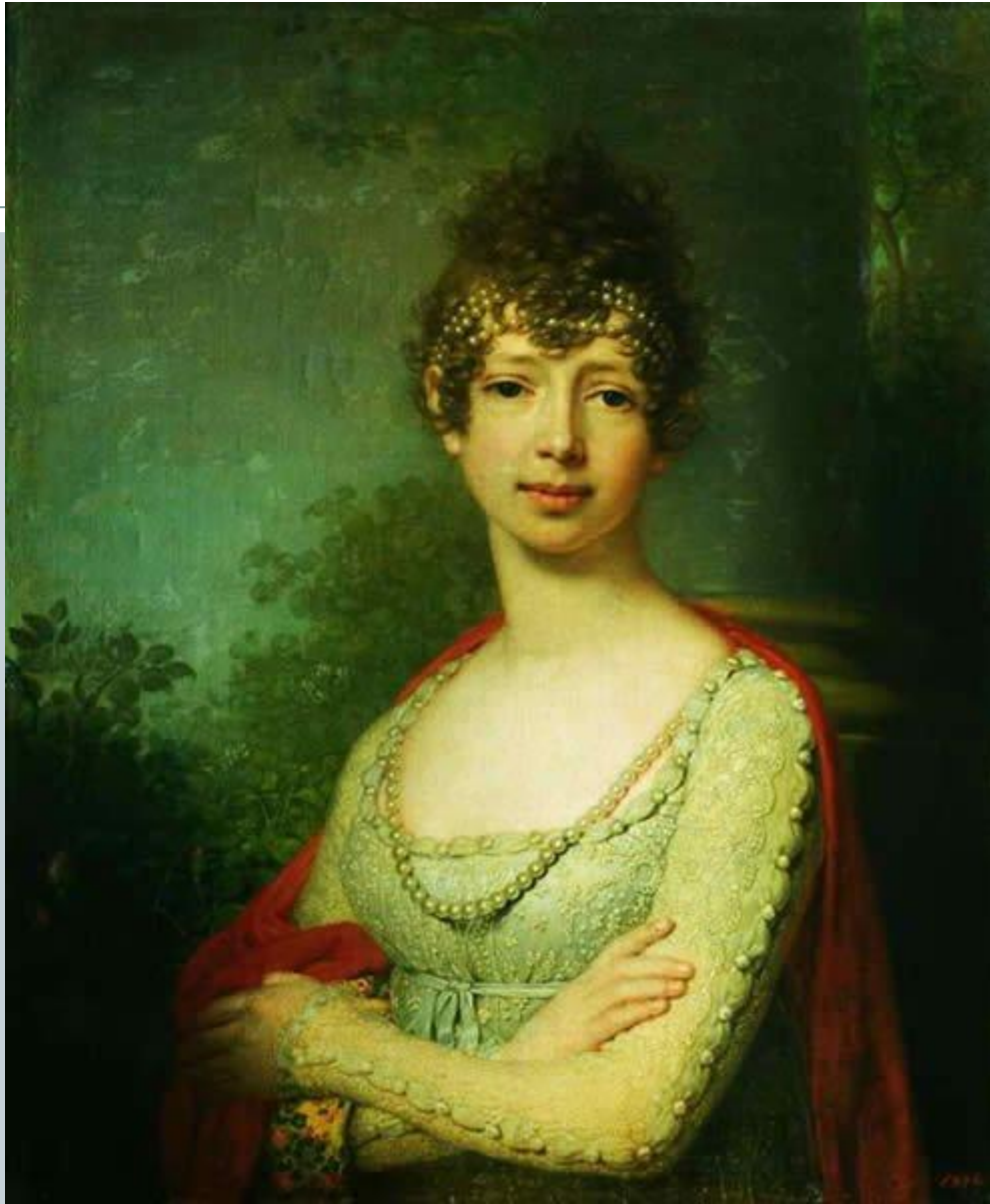
Портрет Великой Княгини Марии Павловны

В Академию Художеств в силу возраста он поступить не мог и потому получал частные уроки у своего земляка Д. Г. Левицкого, а у известного австрийского живописца, который работал при дворе Екатерины||, И.Б. Лампи.