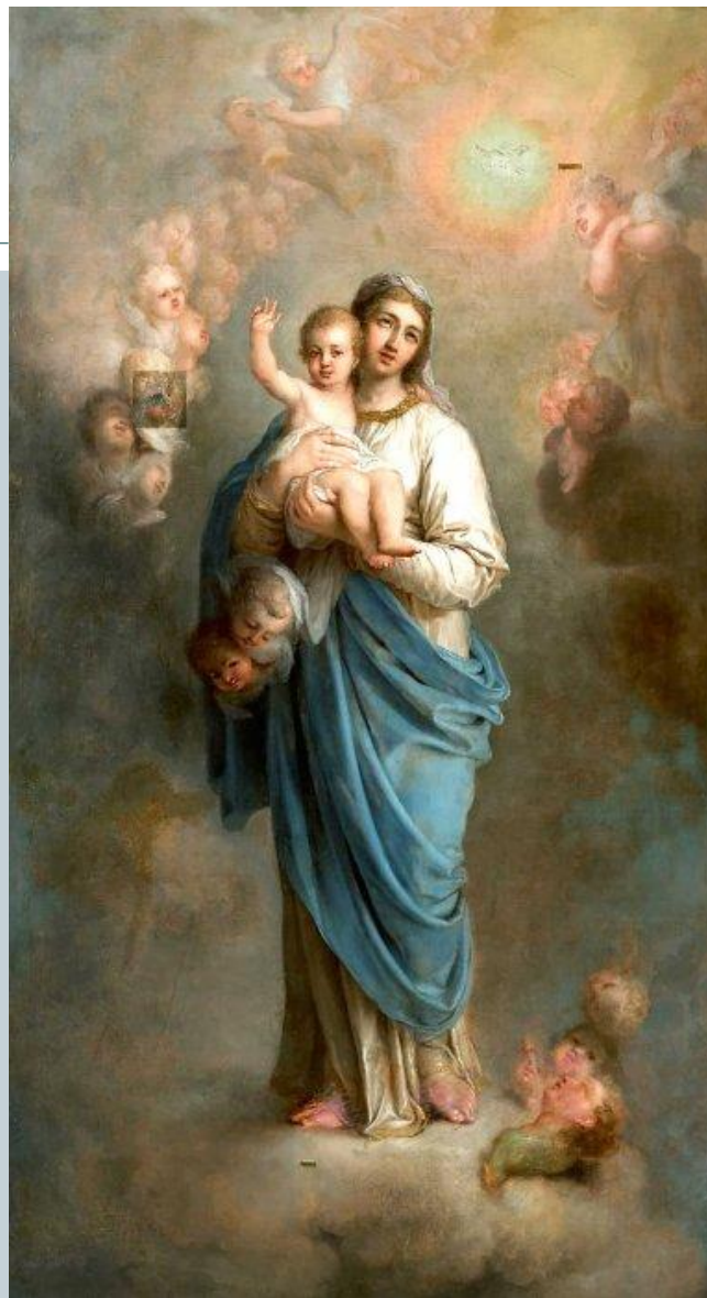
Богоматерь с младенцем

В конце жизни художник больше не писал портретов, а занимался лишь религиозной живописью. Последней его работой был иконостас для церкви на Смоленском кладбище в Петербурге.