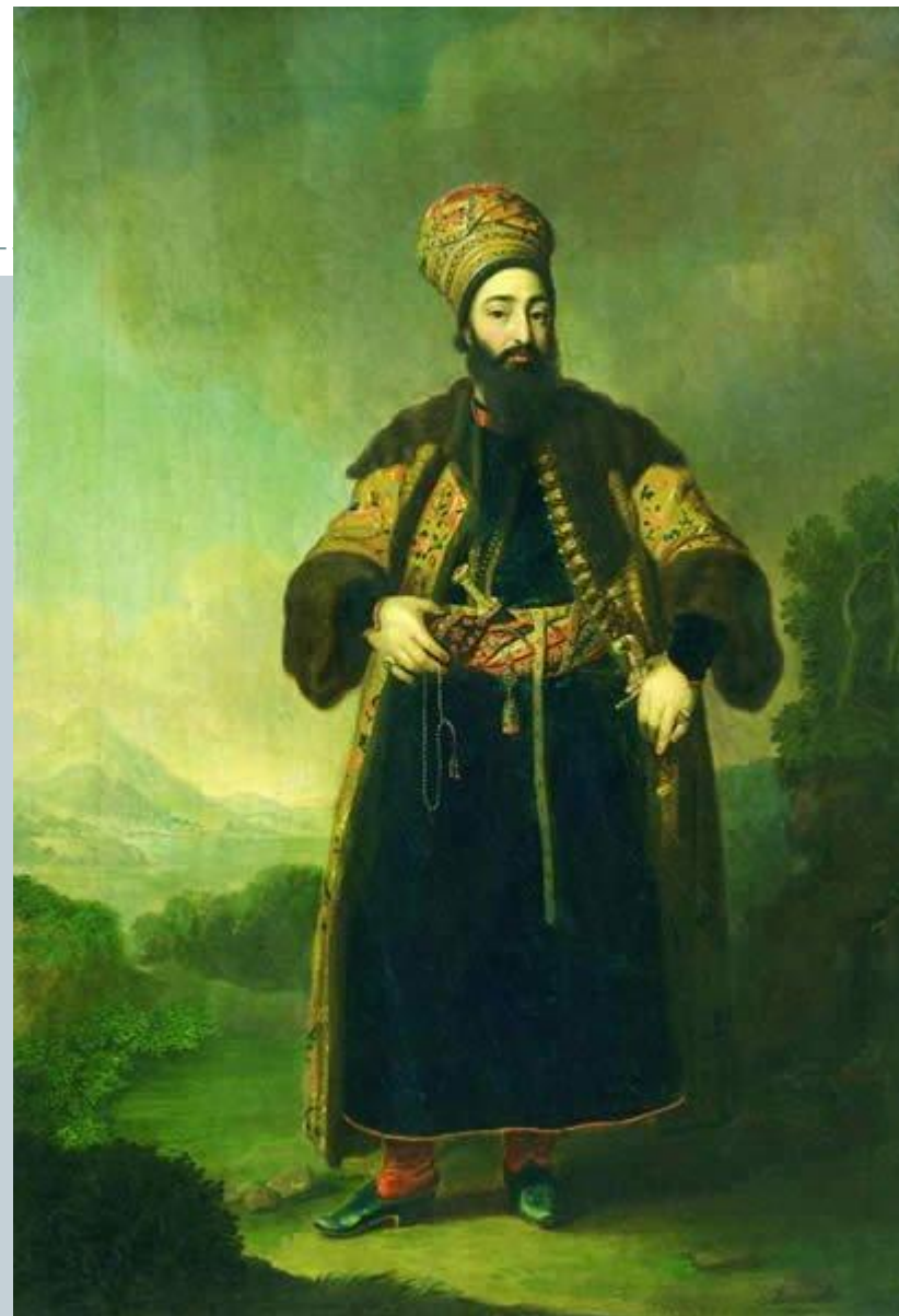
Портрет Муртазы Кули-хана

В числе его работ портреты Г.Р. Державина, князя Лопухина и огромный портрет Муртазы Кули-хана брата персидского хана, графа Куракина.