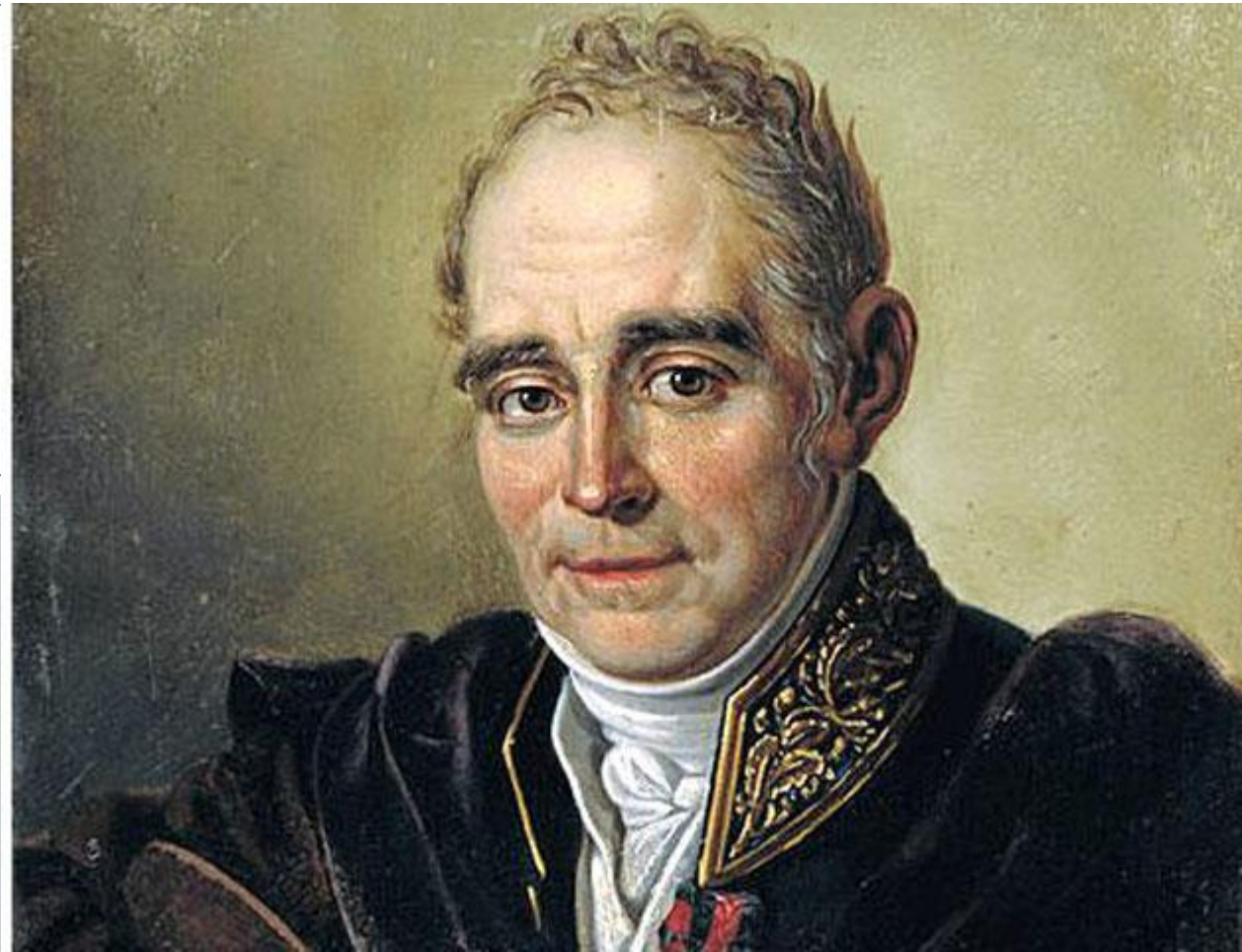
Боровиковский Владимир Лукич (1757-1825)