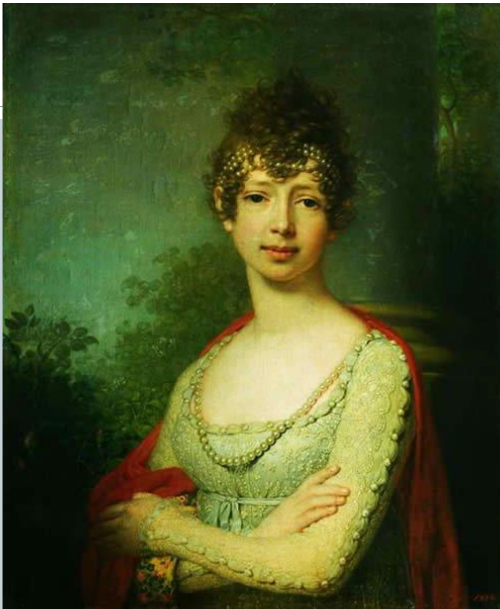
Портрет Великой Княгини Марии Павловны

В Академию Художеств в силу возраста он поступить не мог и потому получал частные уроки у своего земляка Д. Г. Левицкого, а у известного австрийского живописца, который работал при дворе Екатерины||, И.Б. Лампи.