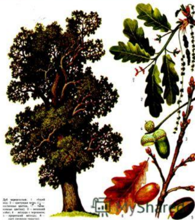
Дуб черешчатый: 1 — ствол; 2 — ветви; 3 — листья; 4 — почка; 5 — шишка; 6 — шишка с орехом; 7 — орех; 8 — лист (показана черешок).