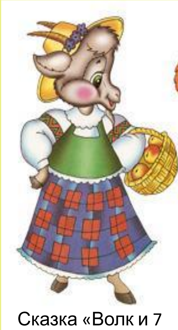
Сказка «Волк и 7 КОЗЛЯТ»