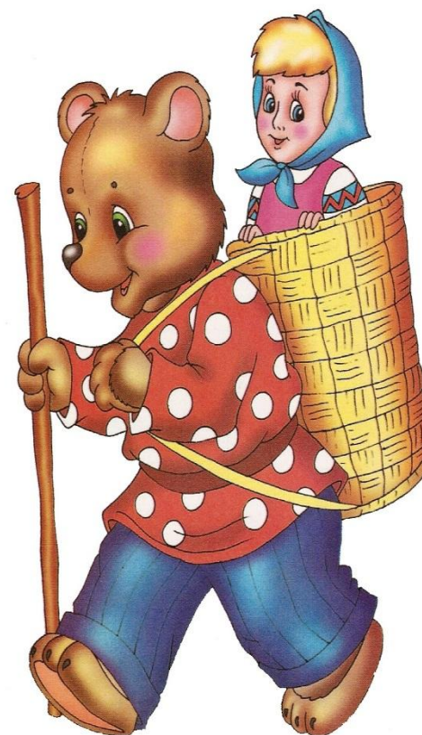
Сказка « Маша и медведь »