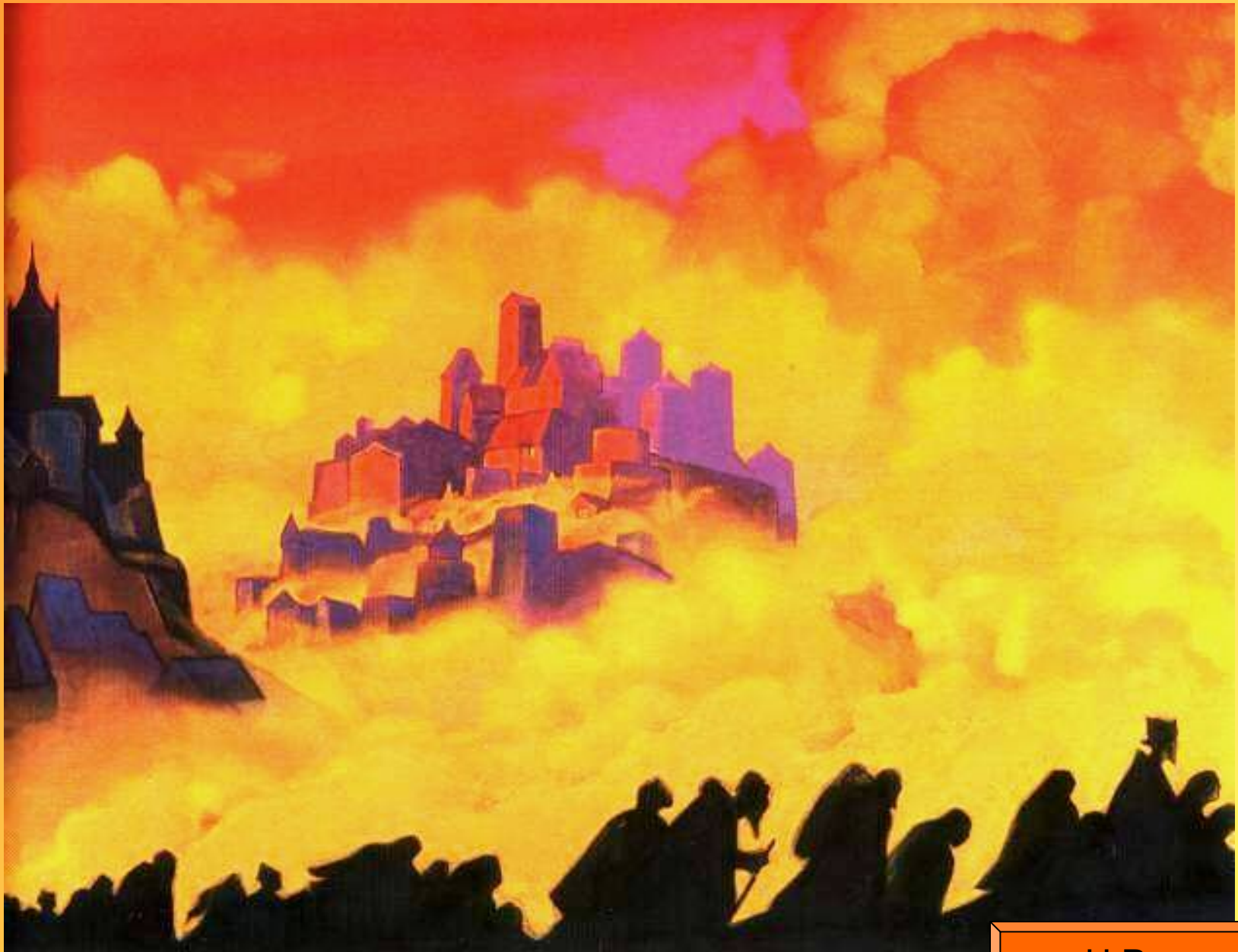
Армагеддон 1940 г. Н.Перих