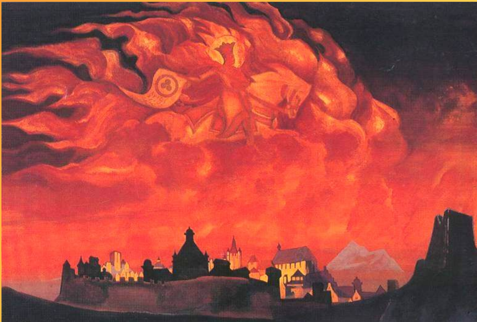
Святая София. Н. Рерих