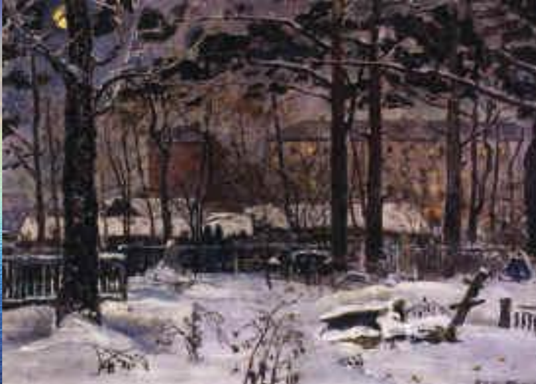
Старое кладбище. 1966