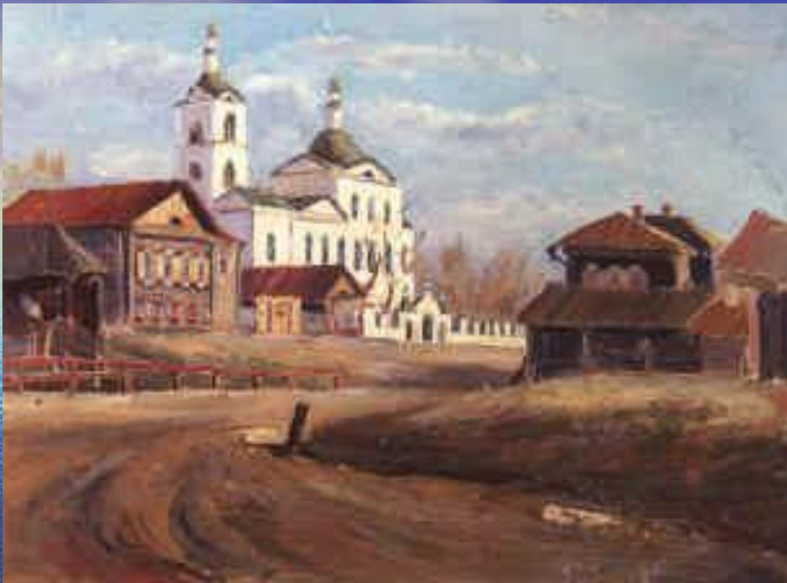
Пейзаж. Тюмень. Вид на Троицкий собор. 1960-е