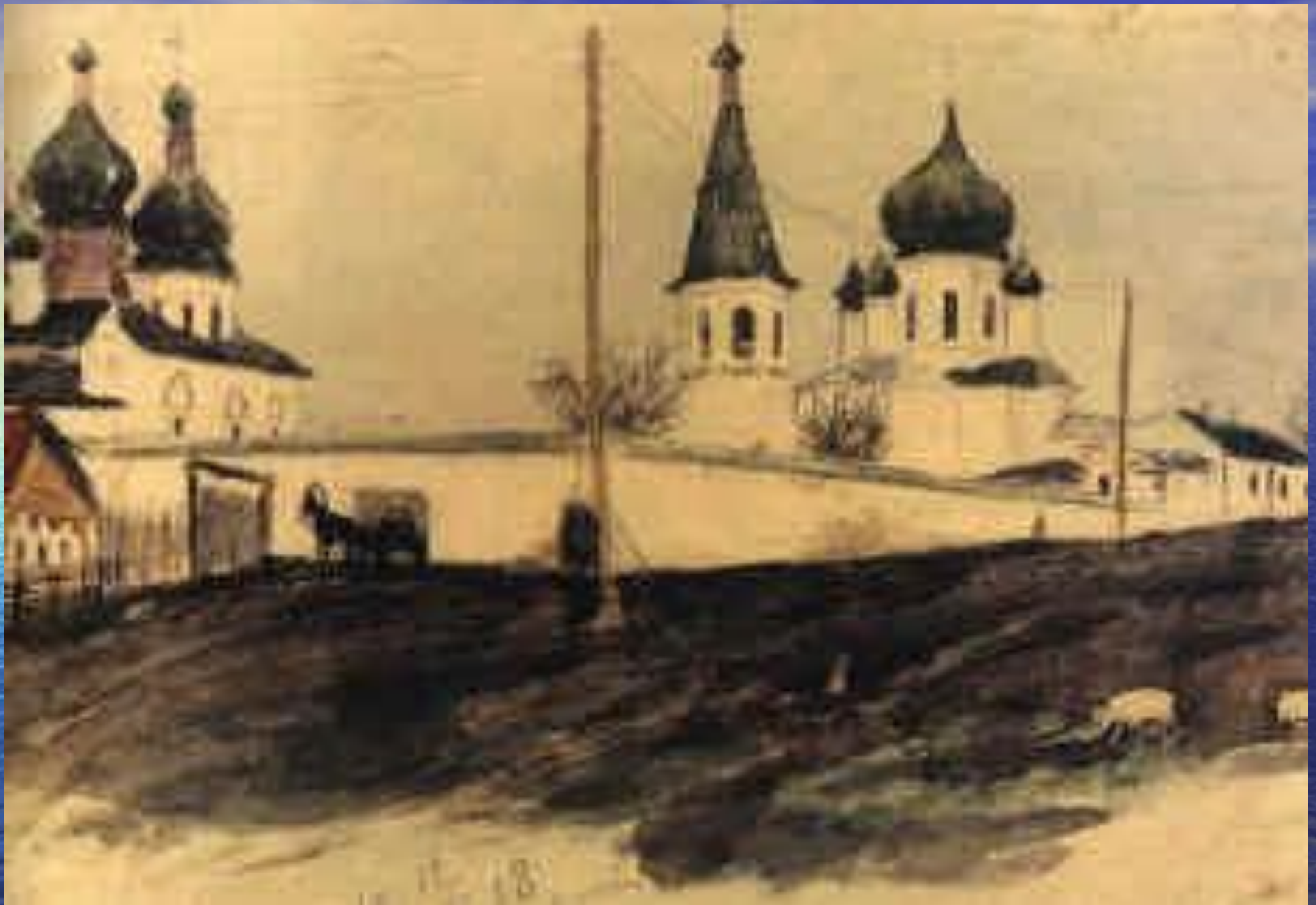
Тюмень. Троицкий монастырь. 1918. Бумага, акварель. 14,2x20,5.