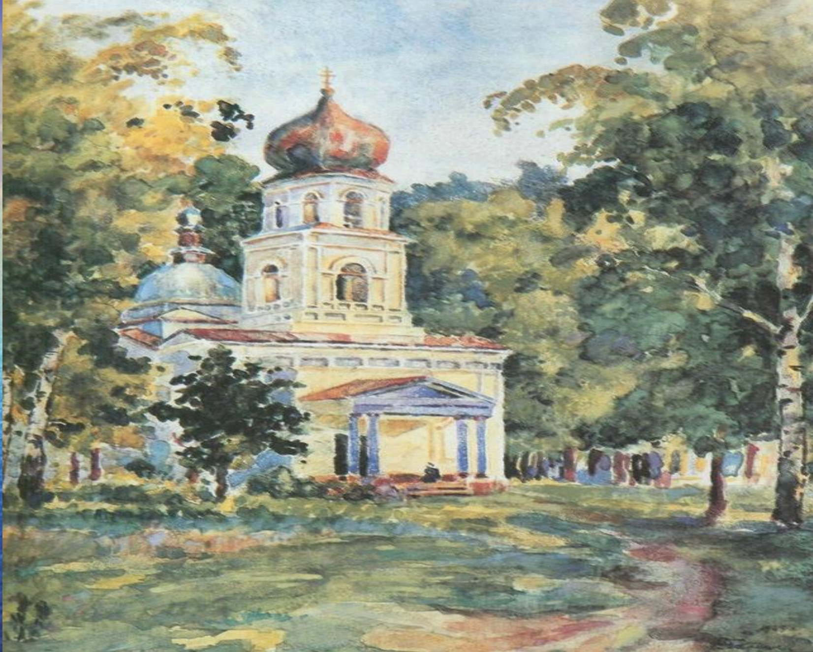
«Церковь на Парфеновском кладбище», 1969 бумага, акв., 67 x 39 собрания ТМИИ