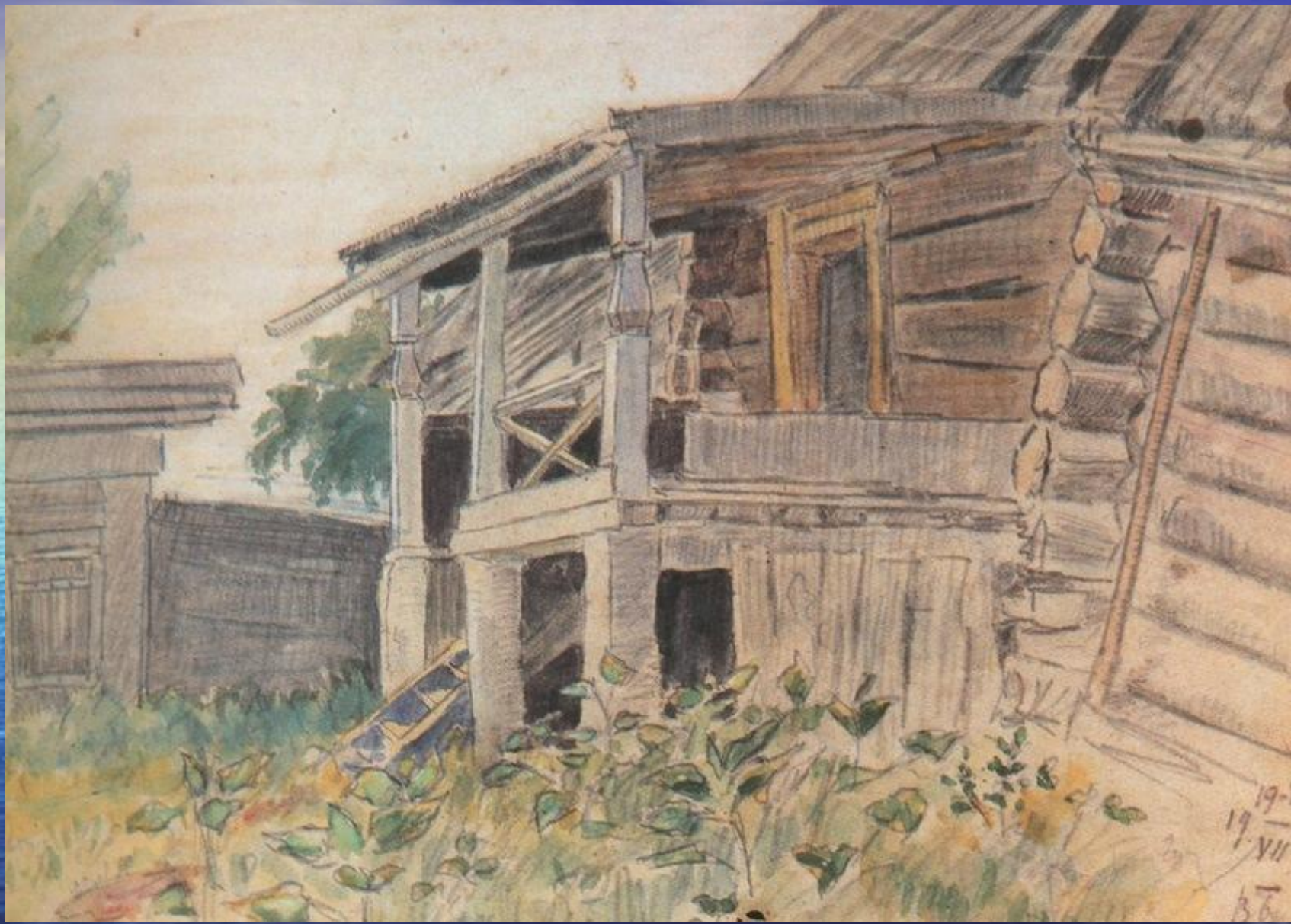
«Крыльцо старого дома». 1921 бум., кар., 20,5 x 29,6 Из собрания ТМИИ